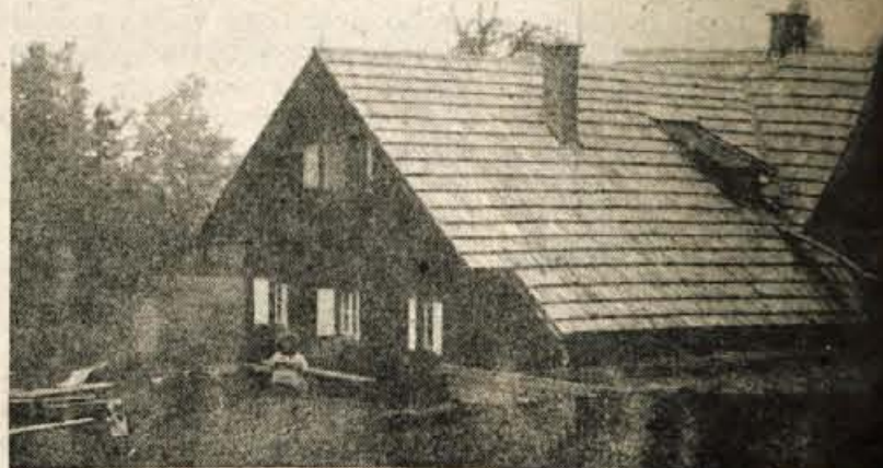
Obnova kočice na Črnem vrhu — Smučarska kočica na Črnem vrhu napoli, posebej pa pozimi prijazno zavetje številnim obiskovalcem Črnega vrha in Španovega vrha nad Jesenicami. V njej postrežejo z jedmi in pijačo, nudijo pa tudi prenočišča. Letos so Jeseničani organizirali udarno akcijo za obnovo strehe, kočico pa tudi sicer nameravajo popraviti.

Mercator, Bistrica 14, Mercator, Cankarjeva 1 a, Živila-Lipa, Koroška 3 in Mercator, Pristava