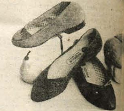
Model BETI za mlade

Praznih rok nam iz Alpinine prodajalne res ne bo treba iti.