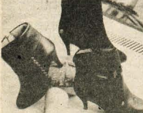
Elegantni gležnarji RITA s srednje ozko peto