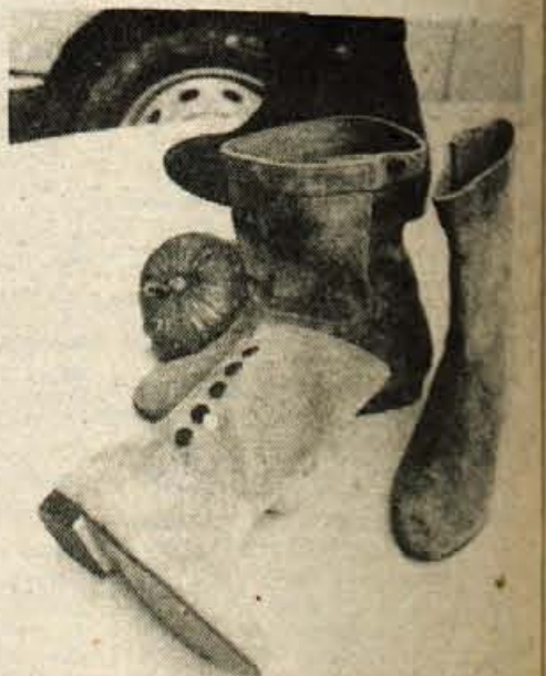
ROBIN HOOD so poimenovali živobarvne gležnarje v semišu — mladi so nad njimi navdušeni