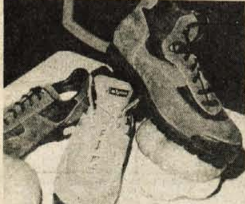
Planinski čevlji niso več šivani, a strokovnjaki pravijo, da niso nič slabši