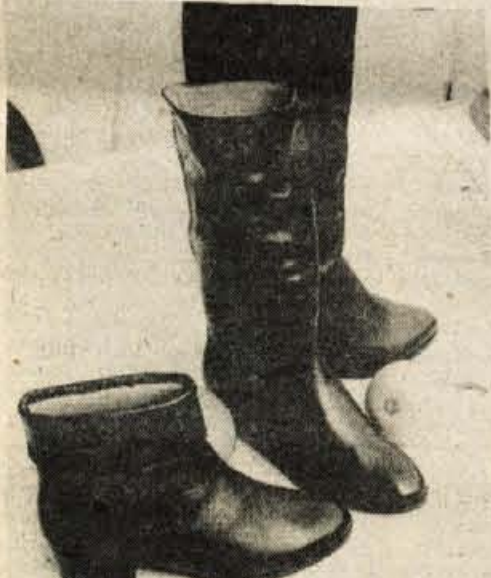
Mladi imajo pri škorenjih in gležnarjih radi nizko peto