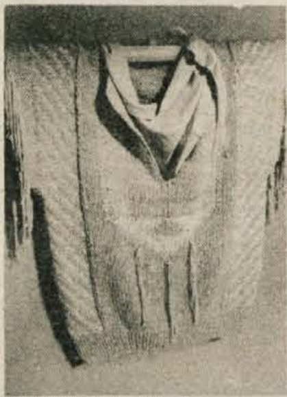
V Almiri pravijo, da bo na ljubljanskem sejmu mode z zmajem nagrajena poletna kolekcija na prodajnih policah maja.

Almira je tako kot vsi naši tekstilci odvisna od uvoza surovin, zato skuša vse več izdelkov prodati na tujem. Lani so ustvarili 600 tisoč dolarjev izvoza, letos načrtujejo 800 tisoč dolarjev. Lani niso dosegli izvoznega načrta, ki so ji ga začrtali