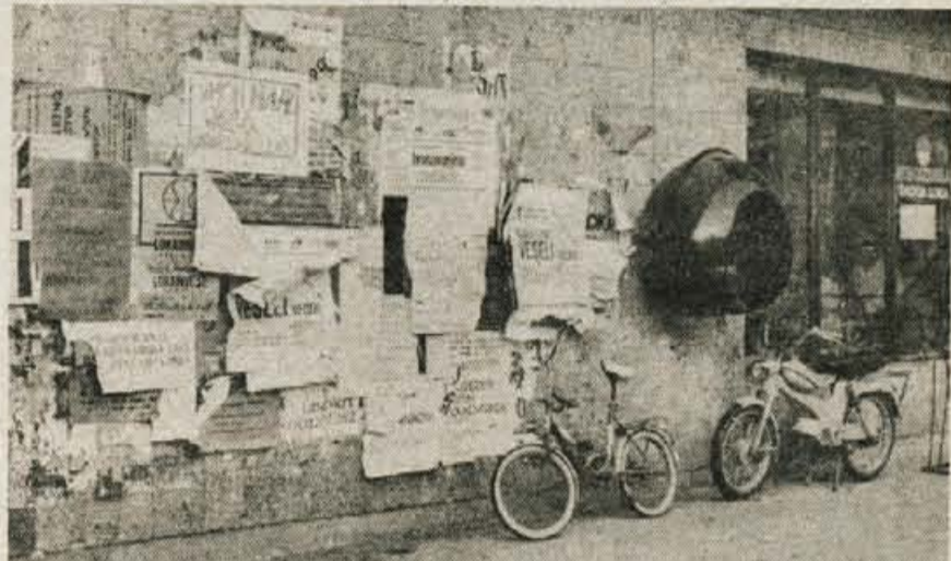
Škofja Loka — Pred približno dvajsetimi leti so uredili Cankarjev trg v Škofji Loki in prek njega speljali prijeten izhod z Mestnega trga do avtobusne postaje. Žal pa tako dekorirana stena na prodajalni Mesoizdelkov ne pripomore k urejenemu izgledu.