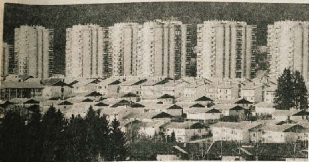
Škofja Loka januarja 1983