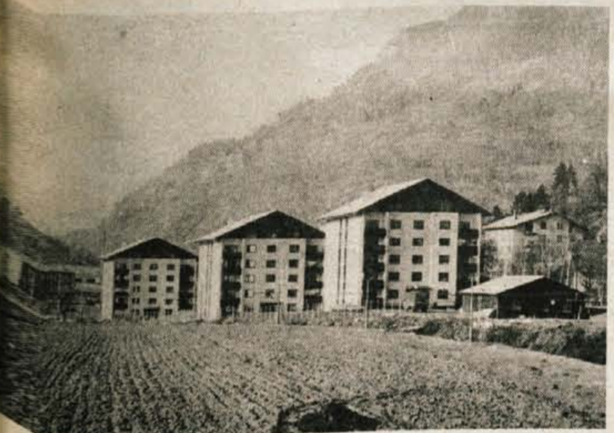
Na Koroški Beli so zgradili precej novih stanovanj, v kratkem se bodo uselili stanovalci še v poslednji stanovanjski blok.