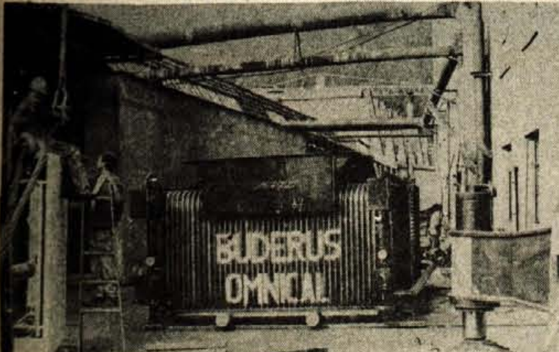
Nov kurilni kotel v Tekstilindusu — Minuli tork so v kranjsko tovarno Tekstilindus pripeljali nov kurilni kotel, kar je za vse Kranjčane vesela novica, saj bo odpravil neznosno onesnaževanje mesta s sajami. Kotel morajo delavci mariborske Hidromontaže. Izdelala ga je zahodnonemška tovarna Omnical, uvozil celjski Emo, ki ga z Omnicalom veže poslovno tehnično sodelovanje. Gre za visokotlačni parni kotel, ki bo dajal 40 ton pare na uro, s 400 stopinjami Celzija in 40 bari pritiska. V novem kotlu bodo kurili zemeljski plin, saj računajo, da se bo Tekstilindus tja do konca leta priključil na plinovod, novo kotlovnico pa bodo poskusno pognali na začetku februarja prihodnje leto. Novi kotel je namreč le »srce« nove kotlovnice, namestiti bodo morali še vse potrebne instalacije. Tekstilindus pa velja sedaj pohvaliti, saj opremljanje nove kotlovnice teče časovno natančno po načrtu. M. V.