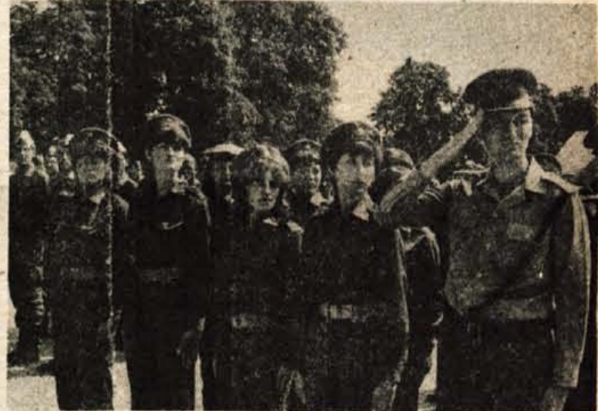
Zgodovinski dan za naše oborožene sile — V soboto je v vojašnici Ljubla Serćerja v Ljubljani prvič v zgodovini naših oboroženih sil skupaj s pripadniki jugoslovanske ljudske armade dala svečano zaobljubo tudi skupina vojakinij, ki so v začetku julija prostovoljno vstopile v vojaške enote. Na slovesnosti so predstavniki vojaškega in družbenopolitičnega življenja poudarili, da se je s tem pričela uresničevati Titoova zamisel o oboroženem narodu, kakor tudi ustavna pravica, da se tudi ženske usposabljujejo za obrambo domovine. Mlade vojakinje so povedale, da so se hitro naučile na red in disciplino in da je vojaško življenje pestro in zanimivo.