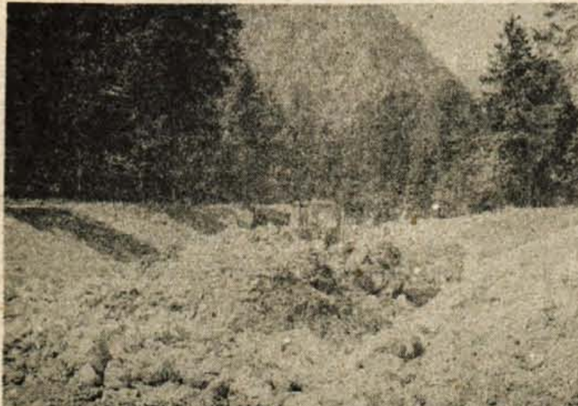
Urejanje hudournikov v Radovni — Hudournika Krmarca in Kotarca v Zgornji Radovni sta muhasta in večkrat rada prestopita bregove. Zato so se odločili, da je treba strugo poglobiti in tako ukrotiti vodo, ki je ob obilnem deževju silno nadležna.