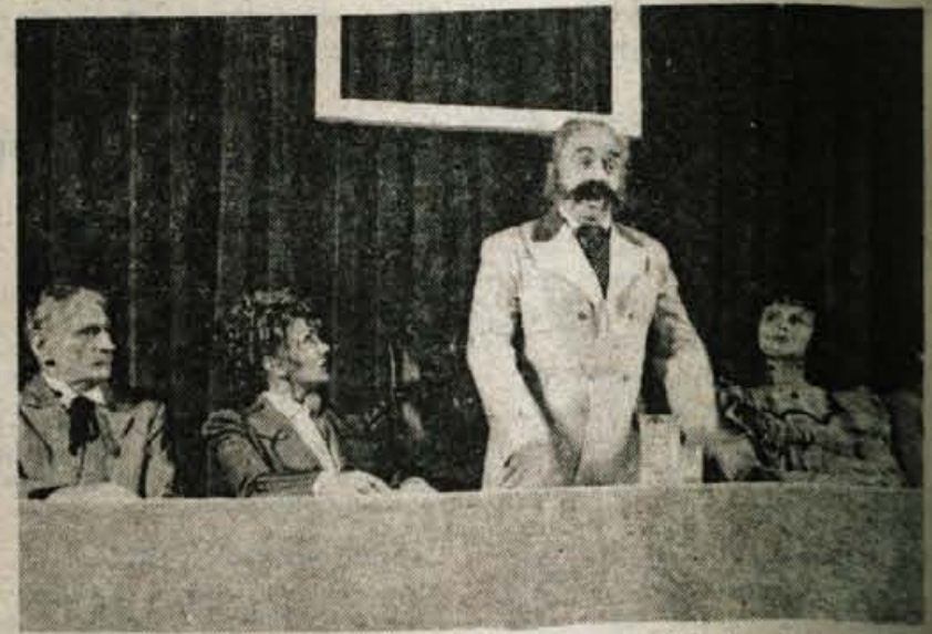
Prizor iz banjaluške uprizoritve Cankarjevega »Pohujšanja v dolini šentflorjanski«

»Zgodba o zakladu« je nastala tik pred koncem vojne, med partizansko akcijo v bližini Trsta. Partizanska minerja Just in Karel minirata most ter pri tem napadeta nemški avto. V njem najdeta zabojček zlatih palic, dolarjev in funtov. Justa mika, da bi zaklad vtaknil v svoj žep, po glavi se mu pode davne želje, da bi hitro obogatel. Karel to opazuje in pošle nanj na poti nazaj med borbe posebej pazi. Zaklad terja življenja. Knjiga obsega 194 strani, kupite pa jo lahko za 530 dinarjev.