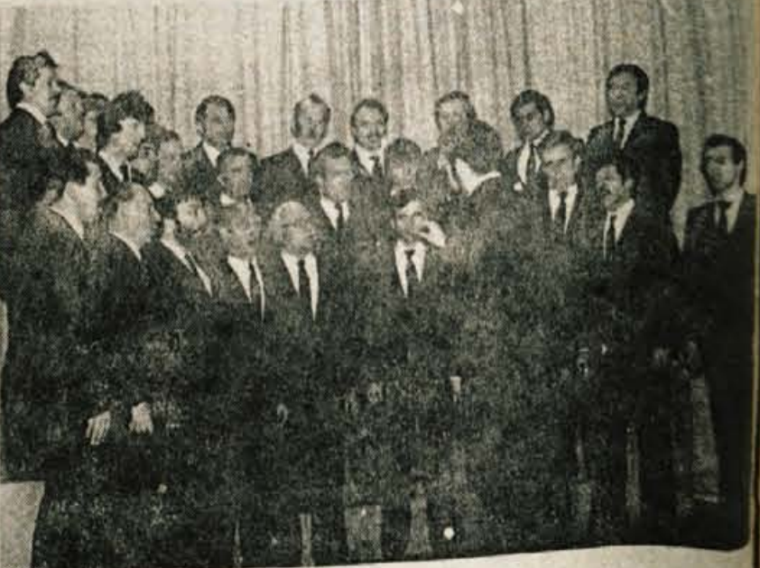
Uspel koncert — V domu kulture v Smedniku je bil celovečerni koncert moškega pevskega zbora Medvođe in mešana pevskega zbora Stane Kosec Gameljne. Pevci obeh zborov so se številnim poslušalcem predstavili z 22 pesmimi in če sodimo po navdušenem sprejemu, si takšnih nastopov še želijo. — fr