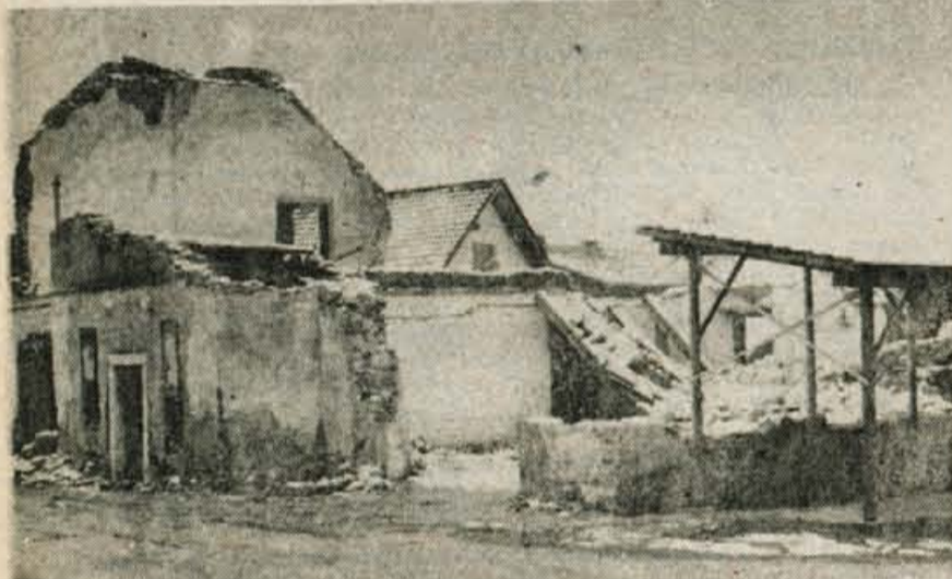
Razvaline kulturnega doma — Nekdaj mogočni in znani kulturni dom v Olševku je docela zdelala starost. Dotrajano ostršeje se je sesedlo in kranjano ni preostalo drugega, da dom porušijo skoraj do temeljev. Zdaj bodo morali v kraju zopet zbrati toliko volje in pomoči družbene skupnosti, da bo dom čez leto ali dve zopet v ponos kraju. Čeprav gre za majhno vas, je verjeti, da bo Olševčanom to uspelo. To so dokazali tudi na lanskim udarniških akcijah, ko so odstranjevali ruševine. V domu bo dovolj prostora za zbor vaščanov in za društveno dejavnost. — C. Zaplotnik

JEZIKOVNO RAZSODIŠČE, Republiška konferenca SZDL Slovenije, Ljubljana, Komenskega 7.