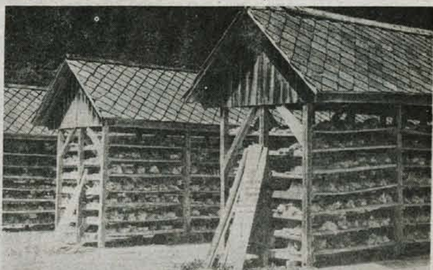
Posodobitev in razširitev Krede — Če bo uspel dogovor o združenju denarja s Slovenijalesom, prek katerega naj bi se nato odvijala tudi prodaja izdelkov, se bo kolektiv Krede že letos lotil naložbe v tehnološko posodobitev in razširitev proizvodnje v Radovni. Investicija bo Krede, ki v ničemer ne ogroža okolja — tako je tudi mnenje mariborskega inštituta za varstvo okolja — veljala okrog 40 milijonov dinarjev. Z razširitvijo in posodobitvijo proizvodnje bi delavci namesto sedanjih 2500 ton krede na leto povečali količino za okrog 7000 ton. (H. J.)