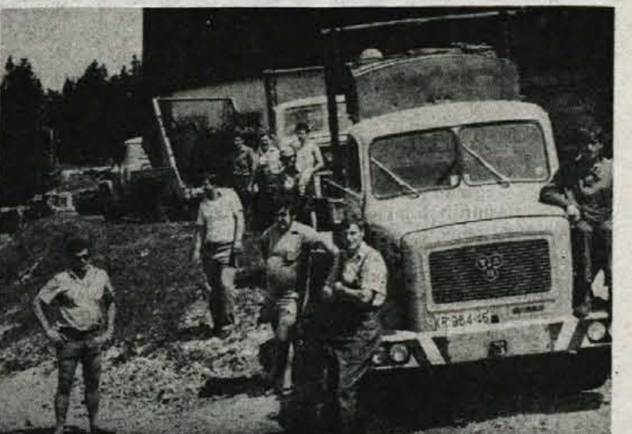
Čiščenje Kravca — Planinsko društvo Kranj, ki skrbi za zatočišče planincev na Kravcu, se posebno pozornost posveča tudi čiščenju na Kravcu in okrog planinske postojanke. Tako so pred dnevi tovornjaki Komunalnega podjetja Kranj iz smetiščne jame pri planinskem domu odpeljali 30 kubnih metrov neuničljive embalaže in odpadkov v dolino v smetiščno jamo v Tenetiše. Z ostalih postojank Planinsko društvo odvažajo odpadke v dolino s tovornimi žičnicami. Čistoči posvečajo planinci na Kravcu posebno skrb tudi zato, ker so pod njim zbiralniki pitne vode. — A. Ž.

Kranj — V okviru javne razprave o spremembah in dopolnitvah družbenega plana občine Kranj za obdobje 1981—1985 bo v avli Skupščine Kranj, Trg revolucije 1, od torika, 5. julija do petka, 8. julija, razgrnit kartogramov prostorskega razvoja občine v tem obdobju. Vsak dan od 9. do 12. ure in od 15. do 17. ure je zagotovljeno strokovno vodstvo in razlaga.