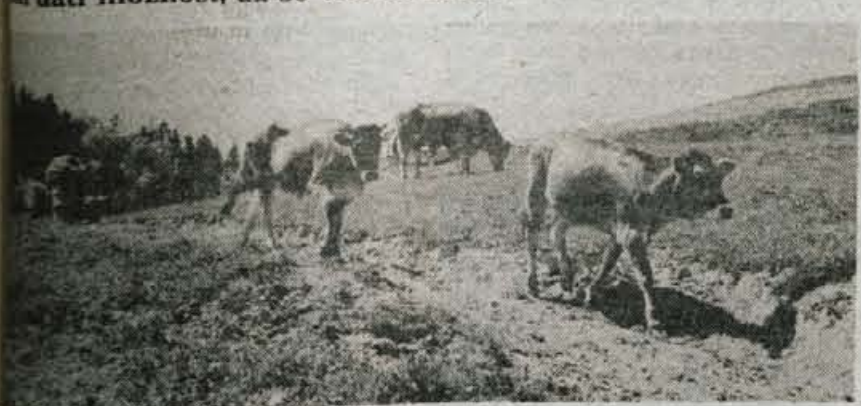
Živinoreji so še precejšnje rezerve

Raziskava Mešane kmetije kot dejavnik razvoja je potrdila dosežene ugotovitve: razdrobljenost zemlje, velika zaposlenost kmečkih gospodarjev, drago pridelovanje v hribih, pomembnost gradnje infrastrukture. V proizvodnji so še precejšnje rezerve, ki bi bilo treba skrbeti za izobraževanje kmetov in popeševalca dati možnost, da so več na terenu