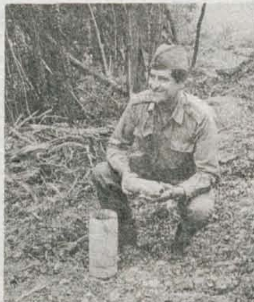
Bregova Soče med Solkanom in hribom Sabotin bo na novi cesti povezoval največji most v Sloveniji

»Okrog 1500 metrov dolg odsek ceste od Solkana do državne meje,« je povedal predstavnik izvajalca del na naši strani, SGP Primorje iz Ajdovščine, »bo najtrši oreh pri izgradnji. Najprej bo treba postaviti most prek Soče, ki bo s 102-metrskim razponom loka največji v Sloveniji, potem se bo cesta uprla 110 metrov visoko v pobočje Sabotina, kjer bo višino premagala z dvema serpentinama. Od meje bo tekla približno 1600 metrov po italijanskem ozemlju, kjer bo vkopana 5 metrov pod terenom, nato pa se bo na naši strani 4500 metrov dolga nova trasa priključila v naselju Hum na sedanjo cestno mrežo v Brdih.«