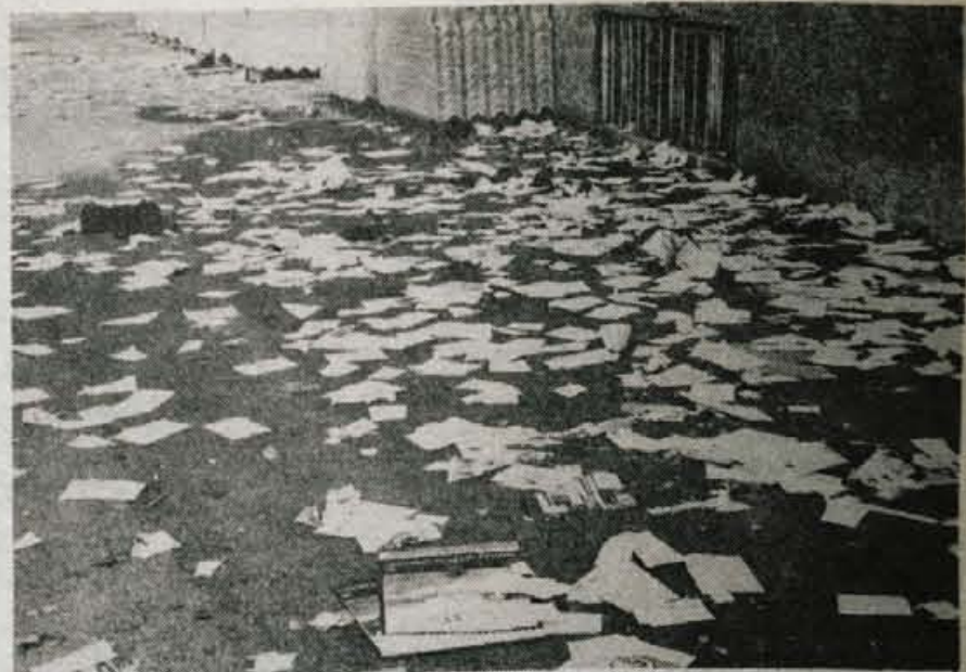
»Veselo« proslavljanje — Konec šolskega leta je prav gotovo vesel in enkratni dogodek. Tako so slavili v noči iz četrta na petek minuli teden tudi stanovalci v stari stavbi dijaškega doma na Zlatem polju v Kranju. Kaže pa, da se v splošnem proslavljanju (ali nezadovoljstvu?) večini popustile »zavore« in rezultat prekipelega praznovanja je bil zjutraj milo rečeno žalosten. — A. Ž.

Stara dvorana gorjuškega izobraževalno umetniškega društva, v katerem je 46 članov, je v nekdanji os-