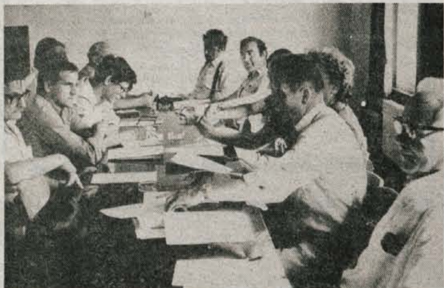
Planinci morajo ohraniti enotnost tudi pri izpolnjevanju obvez, so ocenili na seji meddruštvenega odbora za Gorenjsko

Meddruštveni odbor PD Gorenjske je nedavno sejo posvetil nekaterim gospodarskim vprašanjem — Več pomoči Planinske zveze Slovenije društvom pri upravljanju postojank — Dogovor za letošnje akcije