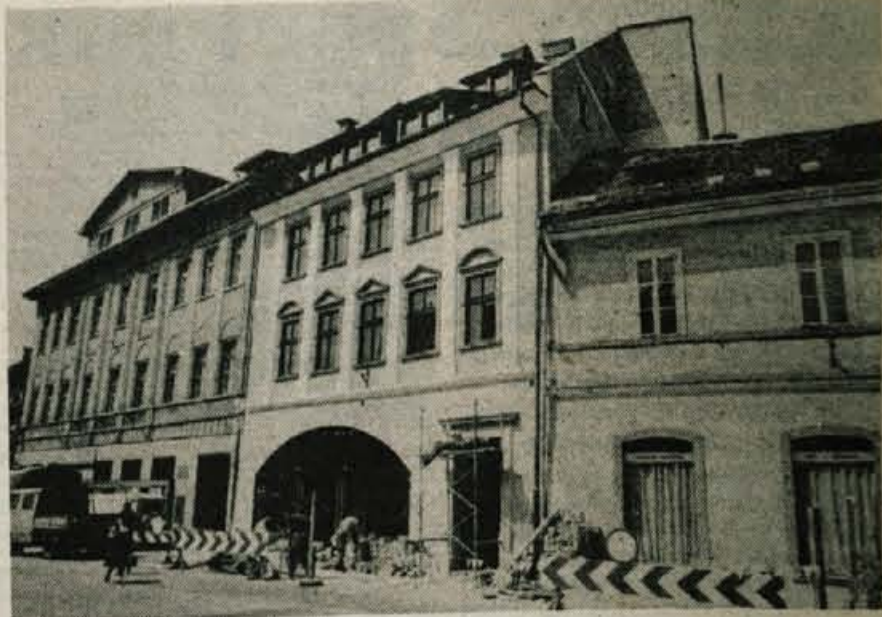
V program revitalizacije starega mestnega jedra Kranja sodi tudi stavba na Maistrovem trgu, kjer se dolgotrajna dela zdaj bližajo koncu.