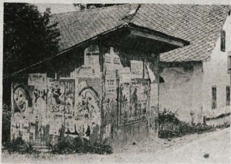
PLAKATIRANJE — Takšnole je žabniško plakatiranje, čeprav je mesto za plakate prav nasproti tega neuglednega objekta.

ni bila več povšeči. No, pa sem se gotovo tudi ne poda najbolje! (S)