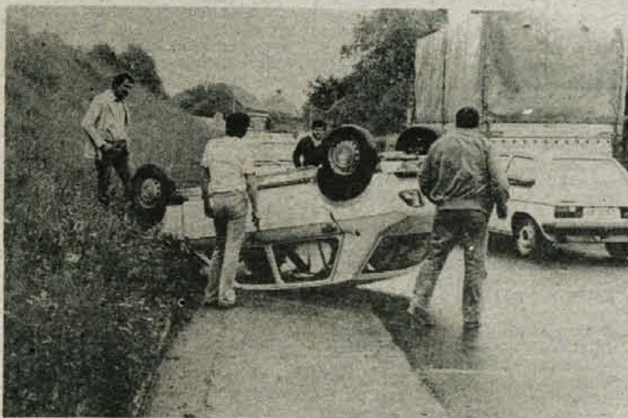
Previdnost nikdar odveč — Zgodilo se je v četrtek zjutraj v Škofji Loki. Zahvaljujoč naključju se je vse srečno izteklo. Voznik je bil le preplašen, na avtomobilu pa je bilo nekaj prask. — A. Z.

pešce zmanjšati hitrost, da bi po potrebi lahko ustavili in odstopili prednost pešču. Večina naših prehodov je vsaj dobre pol leta zelo slabo obarvana z belo barvo, zato so učinkovitejši le svetlobni znaki, ki voznika opozarjajo, da se bliža prehod za pešce. Do 20. februarja prihodnjega leta bodo morali biti po zakonu o varnosti cestnega prometa označeni vsi prehodi za pešce. Tak osvetljen znak z utripajočo lučjo — pešec na prehodu se je doslej izkazal kot najbolj učinkovit, jasno pa je, da ga prav na vseh dosegljivih prehodih za pešce ne bo mogoče postaviti. Sicer pa so dosegljivi prehodi narisani tudi tam, kjer jih niti ne bi bilo treba. Prehod za pešce mora biti namreč označen na cesti, kjer je gostota vozil 300 do štiristo na uro oziroma pred vrtni, šolami, bolnišnicami.