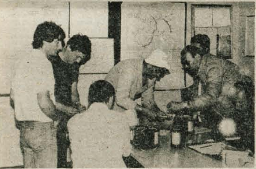
Priprave pred poletom. V ozadju so vremenske karte.