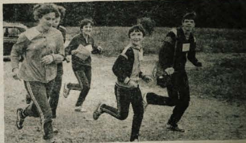
Orientacijski pohod pomeni preizkus moči in znanja

Pred odhodom na orientacijski tek smo poiskali tudi tekmovalce iz drugih gorenjskih občin. Učenci