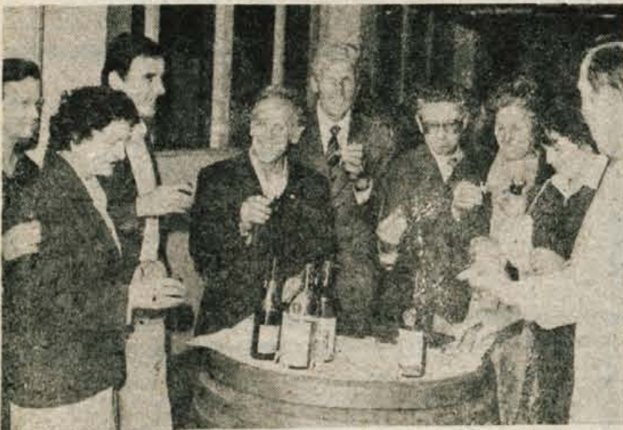
Najprej smo izvedeli kako se dobra kapljica pridela... potem pa okušali

Ljubljana — V soboto, 11. junija, se bodo v rekreacijskem centru na Ježici sešli brigadirji veterani. Srečanje, ki naj bi sčasoma postalo tradicionalno, je v Ljubljani že drugo po vrsti. Lanskega, ki je bilo prav tako na Ježici, se je udeležilo prek 800 brigadirjev in brigadirki. Organizatorji, Republiška konferenca ZSMS, mestni konferenci ZSMS in SZDL Ljubljane in Nedeljski dnevnik, tudi letos pričakujejo številno udeležbo. S srečanjem in podobnimi aktivnostmi (kot je razstava brigadirskega gradiva iz povojnih akcij) želijo poudariti družbeni pomen prostovoljnega dela, vzdrževati in krepiti tovariške vezi, ki so se med mladimi spletle v času aktivnega brigadirskega dela in življenja.