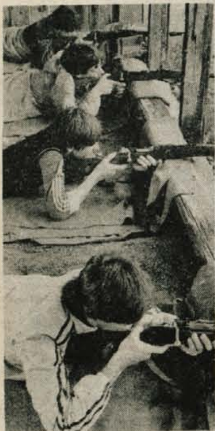
Natančno merjenje — dober zadetek

Gorenjsko tekmovanje mladih v SLO in družbeni samozaščiti