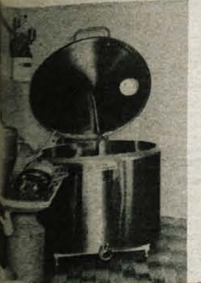
Novo tovarno hladilnikov pomagajo graditi novo proizvodno halo — Delavci tega podjetja so se priključili LTH — 50 delavcev dobilo delo. Za bazen je žirovska zadruga odšla 100.000 dinarjev.

Delavci v obratu so se tudi odločili, da ne bodo več organizirani v okviru Obrtne zadruge Ljutomer, temveč da se organizirajo kot temeljna organizacija Loških tovarn hladilnikov. L. B.