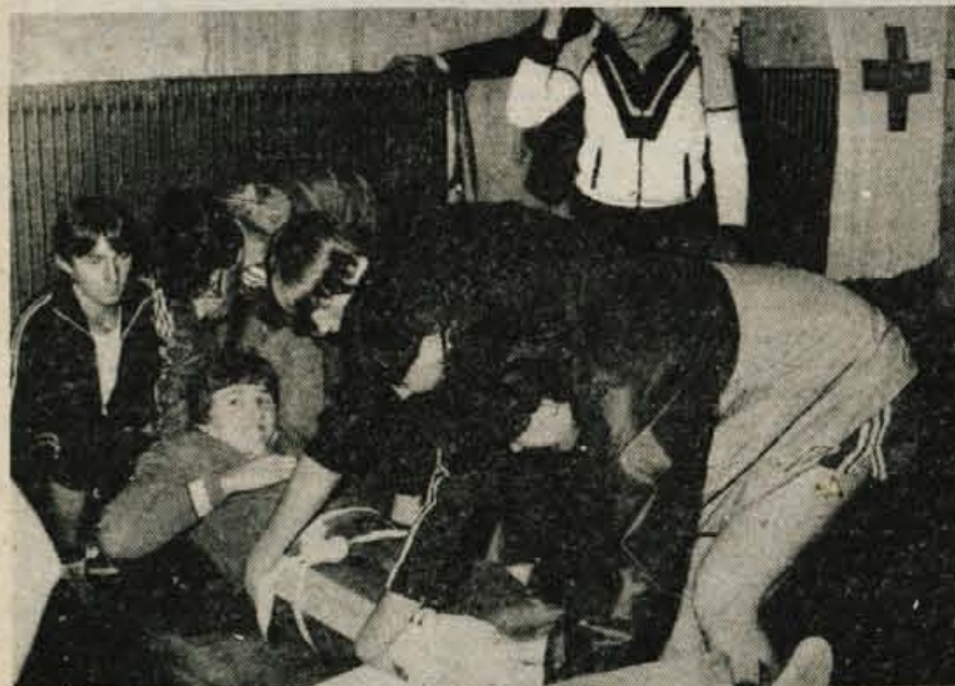
Prvo pomoč je treba nuditi ponesrečencu hitro in pravilno