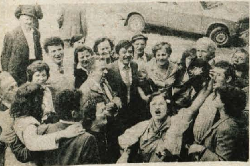
Če smo veseli, dobre volje, potem tudi prešerne pesmi ne manjka