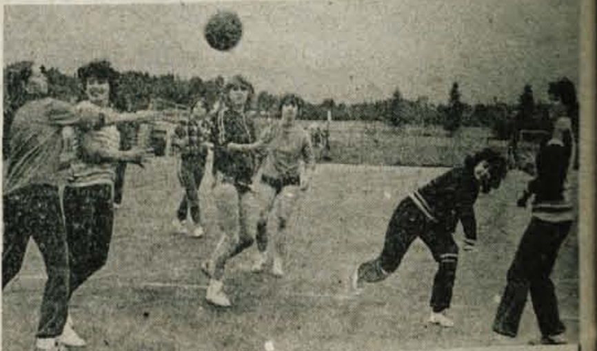
UČENKE IN UČENCI SREDNJE TEKSTILNE IN OBUVNE ŠOLE ZA DAN MLADOSTI — Za dan mladosti je bilo živahno na stadionu Stanka Mlakarja. Ta dan so namreč učenke in učenci srednje tekstilne in obuvne šole iz Kranja imeli mednarodna srečanja v atletiki, rokometu (ženske), košarki in streljanju (moški). Udeležba je presegla vsa pričakovanja, saj je v vseh štirih disciplinah nastopilo nad osemsto tekmovalk in tekmovalcev. Najštevilnejša je bila udeležba pri ženski atletiki, saj jih je nastopilo kar šeststo. To mednarodno tekmovanje srednje tekstilne in obuvne šole so imenovali kar mala olimpijada. Posnetek je z rokometnega srečanja. — (dh)