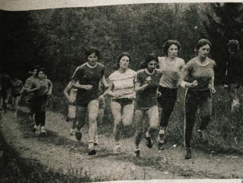
OBČINSKI POMLADANSKI KROS — Na letošnjem občinskem pomladanskem krosu, ki ga je na Ovčanovem travniku organiziral AK Triglav, je nastopilo nad sedemdeset tekačev. Udeležba je bila najboljša v pionirskih konkurencah, medtem ko so bile ostale kategorije zaradi delovne sobote slabše zasedene. (-dh)