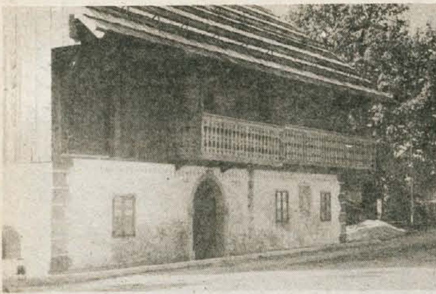
Liznekovo domačijo, kulturni objekt, bodo končno te uredili...