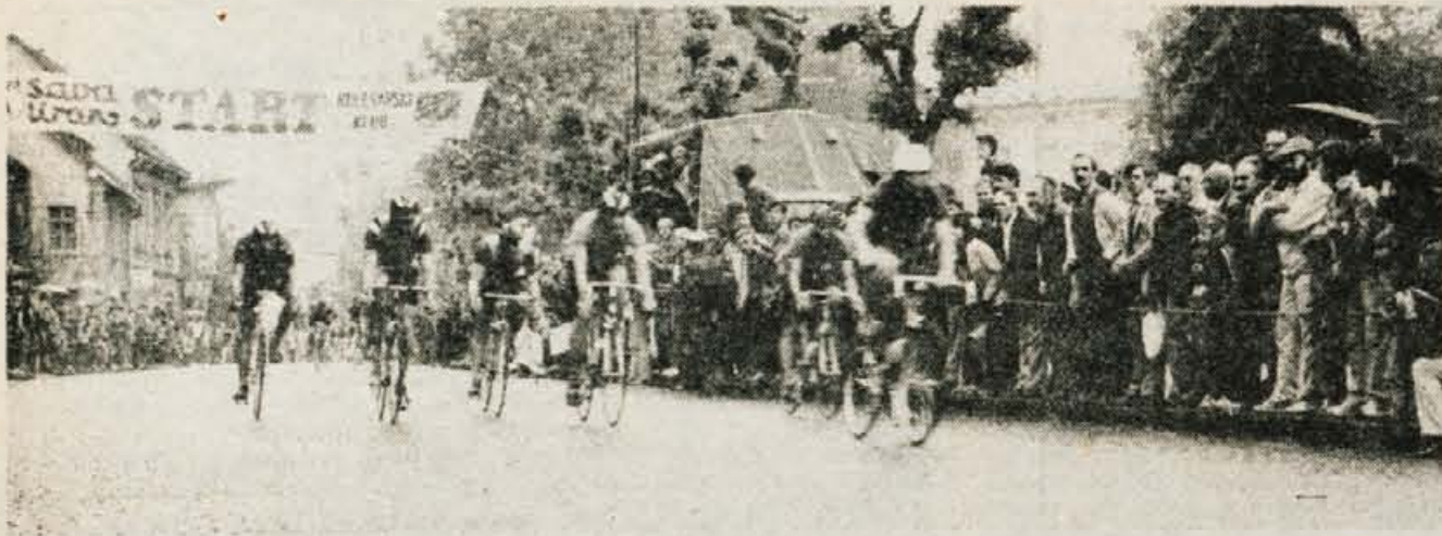
Najhitrejši v cilju nedeljske četrte etape Alpe-Adrie v Kranju.