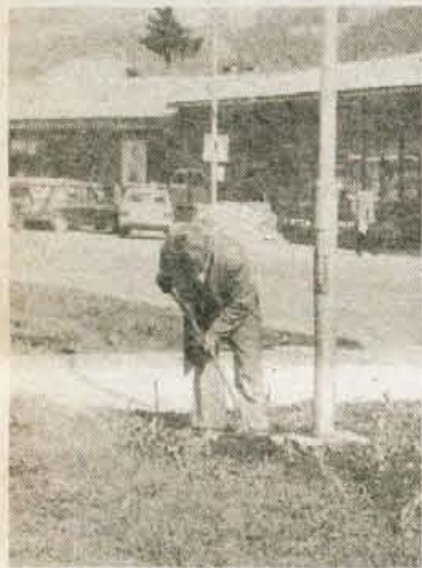
Zelenice je treba urediti...