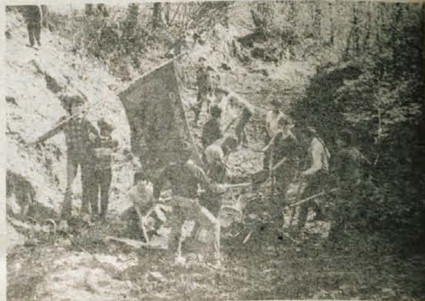
Lancovski aktiv mladine je v soboto, 24. aprila, organiziral prostovoljno delovno akcijo. Mladi so na področju Zgornje Lipnice delali na cesti in pri kanalizaciji. Po opravljenem delu je stekel tudi pogovor in več mladincev se je odločilo, da se vključijo v mladinsko delovno brigado Suha krajina.