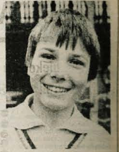
vseh 175 možnih točk in pokal Coca Cole.

Nato so prišla domača republiška tekmovanja, kjer sem postal prvak v slalomu in veleslalomu, samo da sem si veleslalomsko prvo mesto delil z Dodigom. Tako kot vsako leto so se vrstila še tekmovanja za pokal Coca Cole. V štirih slalomih in treh veleslalomih sem bil prvi in tako zbral