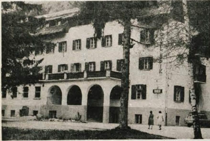
Hotel Špik v Gozd Martuljku je popolnoma dotrajan, zato ga Integral obnavlja.

V Gozd Martuljku obnavljajo Špikov hotel, ki je povsem dotrajan — Veliko denarja za obnovo — Kamp sprejema zimske in letne goste