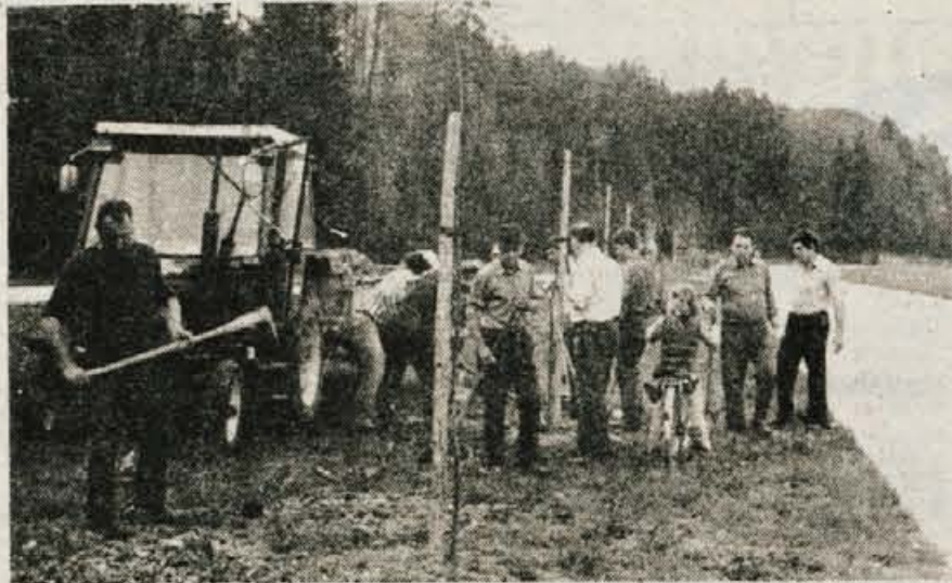
88 dreves v spomin na Tita - Krajanje Nakla, delavci Zivil in Cestnega podjetja ter vojniki in trije popoldanski udarniški četnjaki posadili ob cesti proti vasi Okroglo 88 velikolistnatih lip, ki bodo trajen pomnik na pokojnega predsednika Tita. Sadike za 335 metrov dolg drevored je kupilo trgovsko podjetje Merkur, v akcijah pa je vsakokrat sodelovalo od 45 do 50 krajanov in delavcev iz organizacij krajevne skupnosti. Žal so neznani vandali že nekaj dni po nasaditvi eno od dreves odlomili in s tem pokazali, kakšen je njihov odnos do drevoreda in urejenosti kraja.

Iz Banije, kjer je štafeta mladosti prenočila od sobote na nedeljo so mladinci štafete ponesli iz Korduna v Topusko in Vrginmost, kjer so ji pripravili svečan sprejem. Nato so mladinci in mladinke ponesli štafeto po obronkih Petrove gore. V Rakovici pa so štafeto prevzeli mladi iz Like.