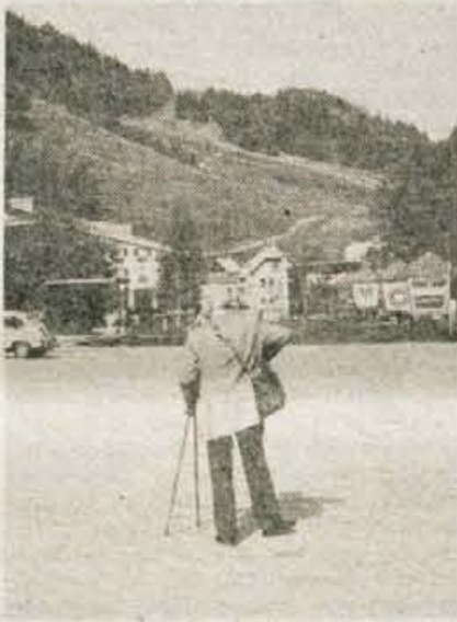
Prijeten je sprehod po Kranjski gori...