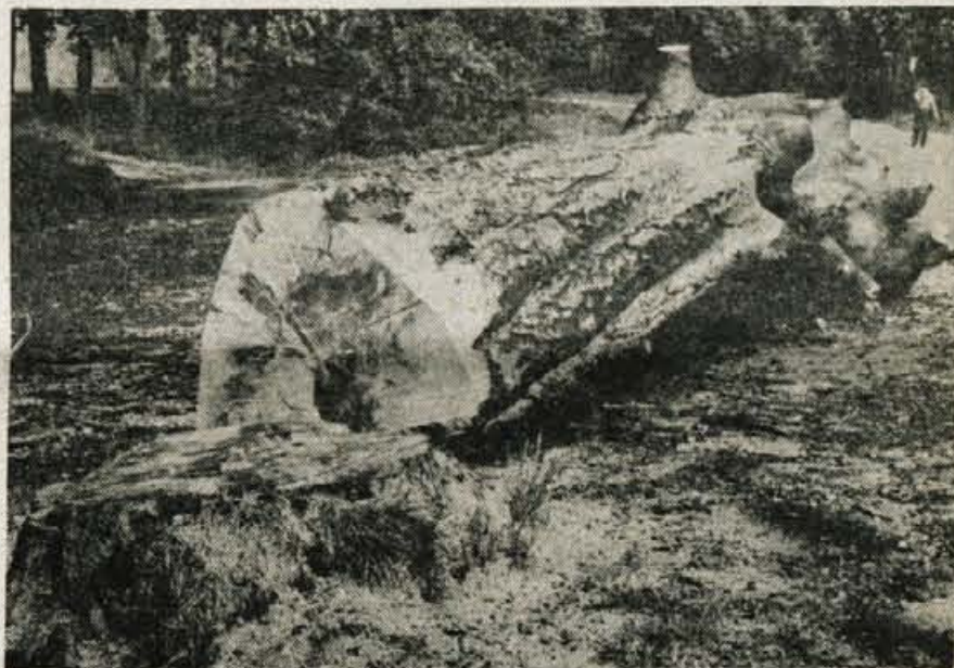
Stoletne bukke ni več — V Poslovno-prireditvenem centru Gorenjski sejem so bili po prvomajskih praznikih osupli. Ko so prišli na delo, so videli, da soletne bukke v Savskem logu ni več. Med prazniki so jo posekali. O dogodku so takoj obvestili postajo milice. Zaradi drevesa, ki je sicer dajalo prijetno senco, so imeli na sejmu težave, ker se je v kotanjah ob deževju nabirala voda. Vendar so pristojni posek prepovedali. Zato je toliko bolj nerazumljivo, da so takšno drevo med prazniki vendarle posekali... (A. Ž.)