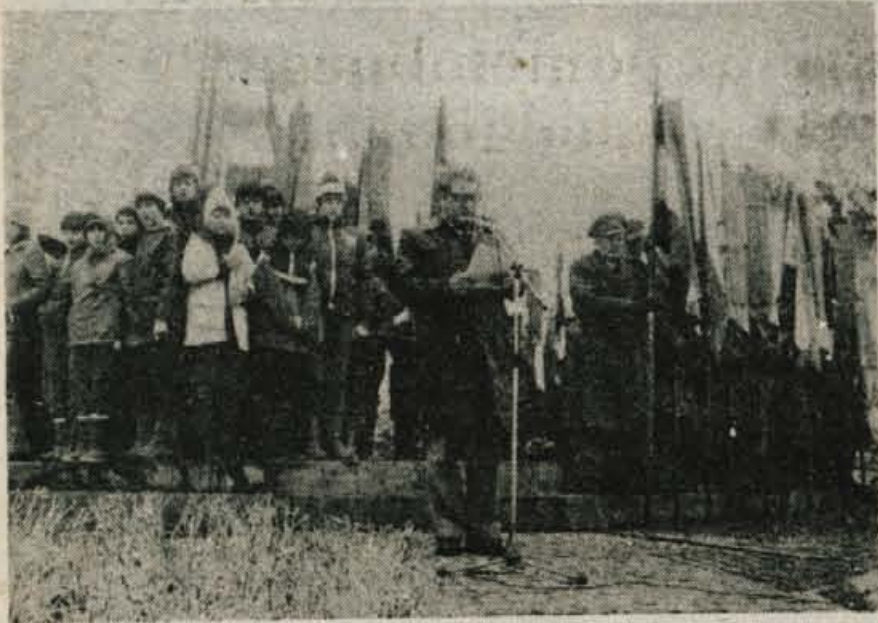
Veličasten zbor na Planici pri Crngrobu