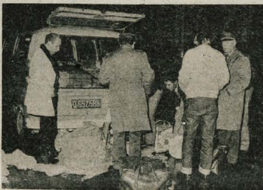
Carinski pregled — Kljub povečanemu prometu je treba opraviti carinski postopek za blago, ki ga potnik prenese čez mejo, razen tega pa še ves administrativno tehnični posel, ki ga nalagajo novi predpisi.