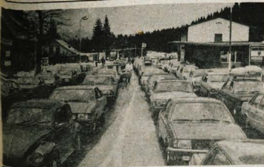
Oblegani mejni prehodi — Običajni gneči ob koncu tedna so se minuli vikend že pridružili tudi potniki, predvsem naši delavci na začasnem delu v tujini, ki prihajajo domov za velikonočne praznike. Več o tem, kako so na povečan promet pripravljene obmejne službe, na 15. strani.

za naslednje srednjeročno obdobje načrtovali stanovanjsko gradnjo na površinah, ki jih zakon ne ščiti.