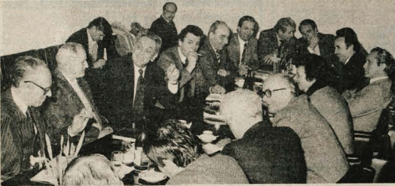
Direktorji kranjskih tekstilnih podjetij so predsednika skupščine SFRJ seznanili s pogoji gospodarjenja; opozorili so predvsem na preveliko administriranje, težave zaradi cen...