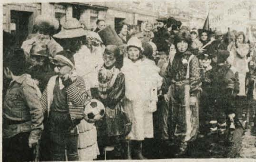
Pust, pust, krivih ust... — Gorenjska je te dni zaplesala v maskarah. Da je še bolj veselo, je nedvomno pripomogel tudi sneg, ki nam ga je zdaj zvrhano nasulo. V soboto je bilo v Kranju v povorki preko petsto maskar. Le škoda, da so tako hitro zaključili svoj obhod po kranjskih ulicah.