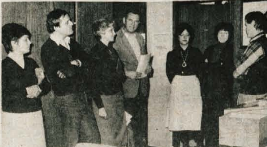
Obisk v uradništvu — Pretekli teden so nas obiskali predstavniki komercialnih in propagandnih služb organizacij združenega dela, s katerimi uspešno sodelujemo. Pogovorili smo se o našem dosedanjem sodelovanju in načrtih za prihodnje. (Jk)

Predlog odloka določa tudi, da morajo službe, ki izdajajo občanom razne dokumente, opravljajo blagajniško poslovanje z občani in dajejo različne informacije, kot so Vodovod, KOGP, Domplan, ZVZG, Elektro, poslovati v ponedeljek dve uri, v sredo pa štiri po 14. uri. Ob tem seveda za vrsto teh služb velja tudi dežurstvo.