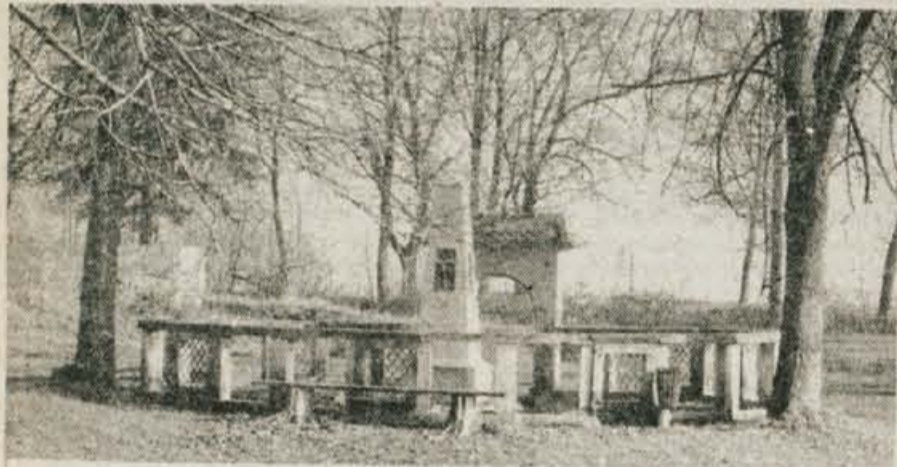
Pozabljen velikan – Tole je spomenik skladatelju Davorinu Jenku. Čeprav ga učenci osnovne šole v Cerkljah, ki nosi njegovo ime, zgledno vzdržujejo, je vseeno malo odmaknjen in pozabljen. Mnogi mislijo, da bi umetnik in svetovljan, kot je bil tvorec prve slovenske himne, zaslužil vidnejše obeležje.