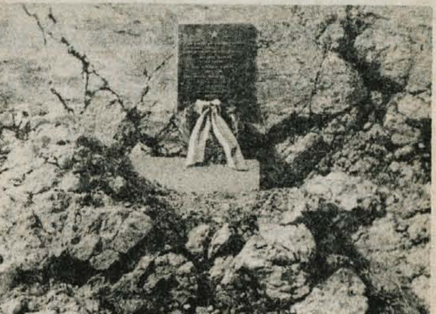
Spominsko obeležje ob cesti na Zatrniku

Ste osamljena, stara od 35 do 45 let, zaživetih hočete novo življenje. Oglasite se pod šifro: Iskrenost 12365