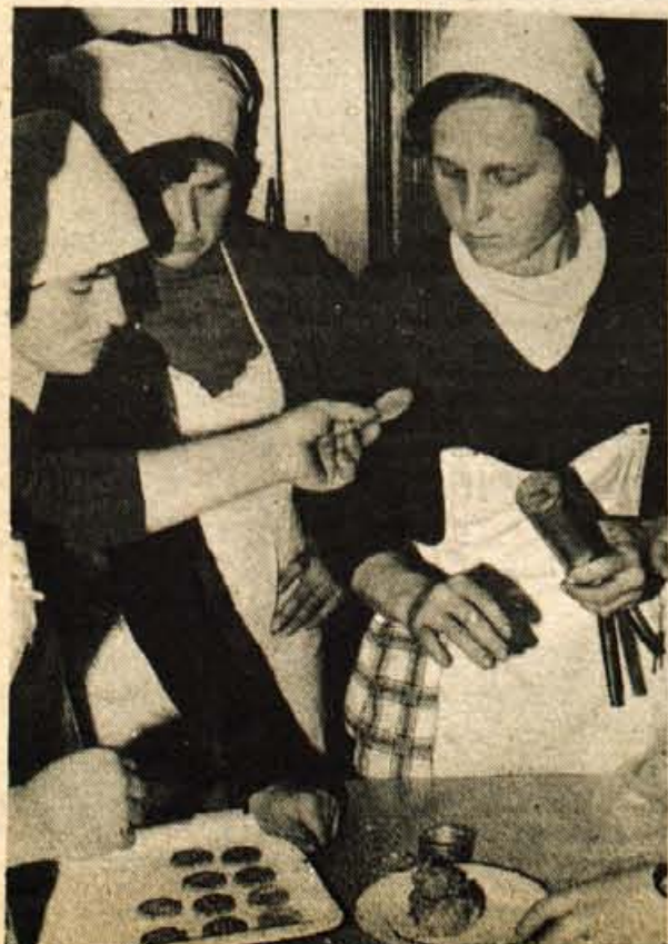
Veliko bolj zanimivo se je učiti skupaj, kakor pa sam.