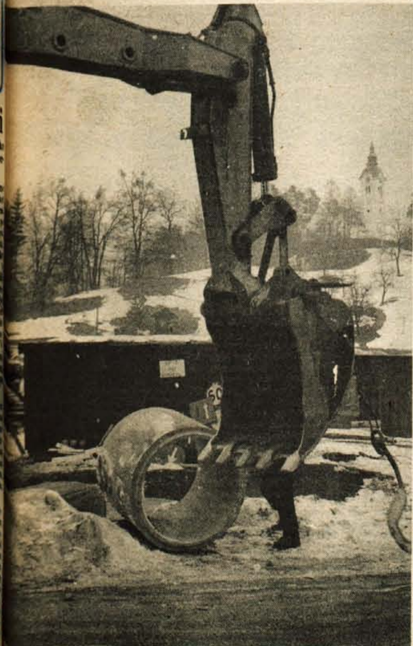
Čeprav je zima, brnijo stroji na gradbišču na Rečici, kjer LIP Bled skupaj z GG Bled gradi mehanizirano skladišče. Skladišče bo ena največjih naložb radoljške občine in velika pridobitev za uso lesno industrijo.

Medobčinski svet SZDL za Gorenjsko je obravnaval tudi problematiko okoli izgradnje nove asfaltne baze in se strinjal s predlogom odbora, da se začasno odloži izgradnja nove baze. MS SZDL se je strinjal z mnenjem, da je obstoj asfaltne baze za Gorenjsko nujen, zato je podprl predlog za začasno izgradnjo nadomestne asfaltne baze na stari lokaciji v Naklem v najmanjšem možnem obsegu (za določen las) s pogojem, da je na tem mestu zagotovljena optimalna varnost za človeka in okolje. MS SZDL poudaril, da to soglasje v nobenem primeru ne pomeni odstopanja od družbenega dogovora o izgradnji nove asfaltne baze; realizacija tega dogovora se le nekoliko odloži. Vzrok za tak sklep je le v pomanjkanju finančnih sredstev za večjo naložbo. I. S.