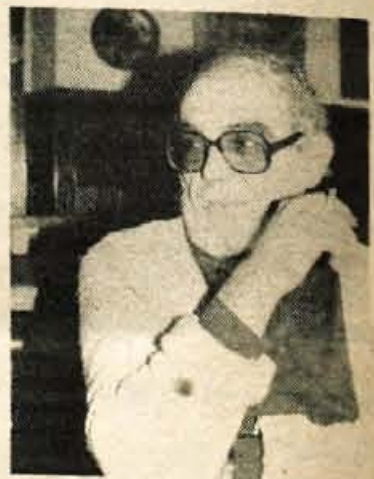
»Keramika, les in slike,« je Gorazdovo umetniško snovanje.

Le tako vsak predmet dobi svoje, pravo, mesto, mesto, ki si mu ga sam dal. Le tako hiša postane dom.