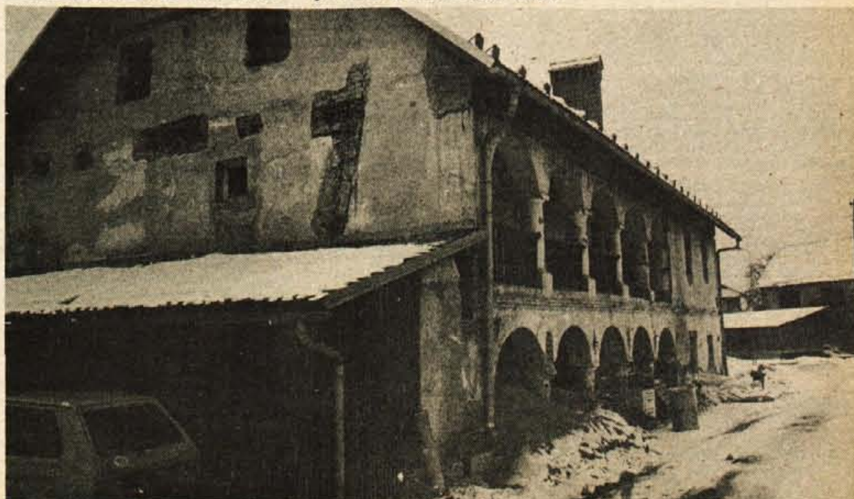
Španova hiša – Za kranjski občinski praznik bo nared prva stavba iz revitalizacijskega programa obnove kulturno zgodovinskih objektov v občini.