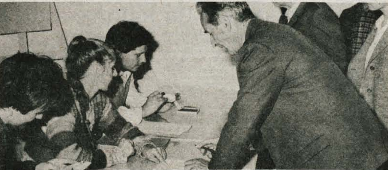
V sredo popoldne ob 17. uri so v polovici slovenskih občin začeli po krajevnih skupnostih razdeljevati bencinske bone. Vsak lastnik avtomobila dobi za 100 litrov bencinskih bonov ter žig v prometno dovoljenje. V občinah so odprli dovolj razdeljevalnih mest, tako da na nobenem ni bilo gneče. Računa se, da bo večina bonov razdeljenih do konca tega tedna, saj so krajevni uradi in druga razdeljevalna mesta odprta ves dan. Bone pa bo za zamudnike mogoče dobiti naslednji teden tudi na sekretariatih za notranje zadeve vsake občine. Na sliki: razdeljevanje bonov v krajevni skupnosti Primskovo.