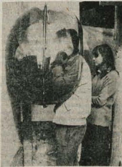
V Ratečah so dobili telefonsko govorilnico in tako je stiska s telefoni saj deloma nekoliko manjša. Vendar pa načrti za Rateče predvidevajo 160 novih telefonskih priključkov.

Rateče — V krajevni skupnosti Rateče so morali temeljito skrbeti letni razvojni plan krajevne skupnosti, saj hudo primanjkuje denarja. Za letos predvidevajo nekaj manjših komunalnih del, ostajajo pa še nerešeni problemi trgovine, pretesne mesnice, pošte, avtobusnega postajališča in primerne zavarovanja kulturnih spomenikov.