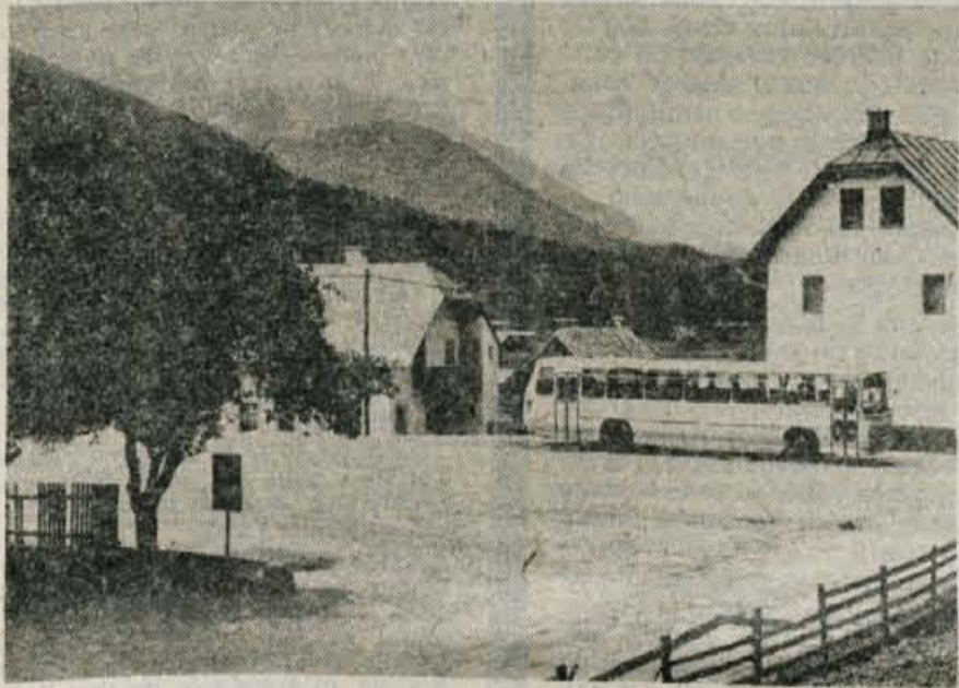
Avtobusno postajališče na zadnji avtobusni postaji v Ratečah je brez strehe, kar povzroča veliko negotovanja.

V bodoče nameravajo urediti vodovod na Zgornji Lipnici, saj do sedaj teh hiš ni moč priti z avtom, postaviti elektrovod v naselju Brda in tako, dokončno urediti dom na Spodnji Lipnici, vaščanom omogočiti, da bodo z izjemnimi lokacijami lahko zgradili hiše, obnoviti in popraviti vodovod na Spodnji Lipnici, po vaseh napeljati telefonsko napeljavno, v krajevni skupnosti urediti otroški vrtec, ter dokončno urediti vprašanje lastništva krajevnega doma.