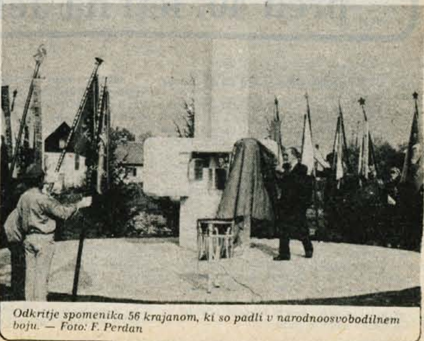
Odkritje spomenika 56 krajanom, ki so padli v narodnoosvobodilnem boju.

Pismene prijave z dokazili o izpolnjevanju pogojev naj kandidati pošljejo v 15 dneh po objavi na naslov: Iskra Telematika, Kranj, Kadrovska služba, Savska loka 4, Kranj.