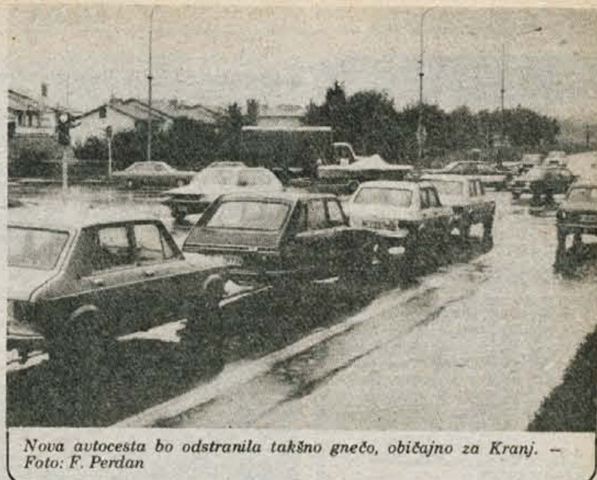
Nova avtocesta bo odstranila takšno gnečo, običajno za Kranj.

Nerazdeljenih ostane še 440.000 dinarjev, zato bodo o razdelitvi teh sredstev še razpravljali. D. S.