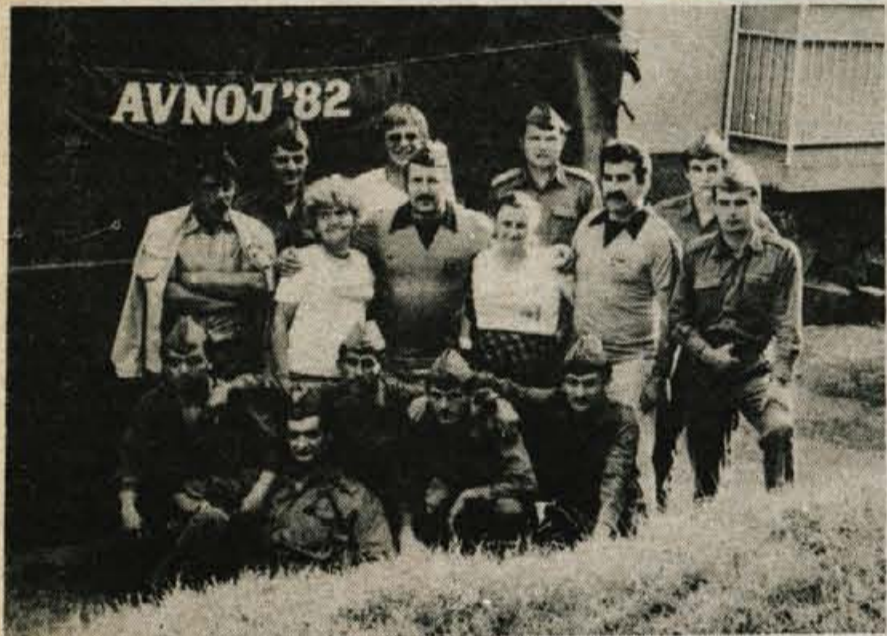
Na avtomobilih je že vse, kar je potrebno za organizacijo in opremo pohodne brigade, kot je ta, ki hodi po poteh delegatov AVNOJA.