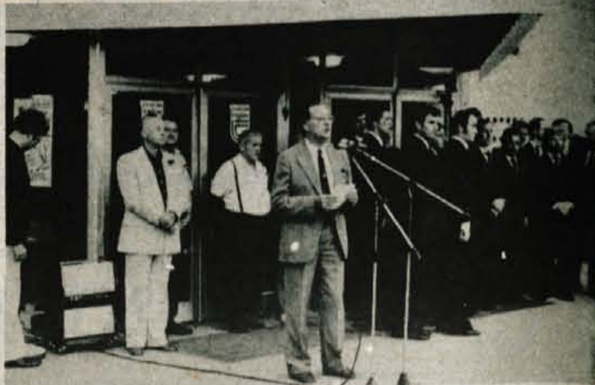
Cerklje — V osnovni šoli v Cerkljah so sinoči zaprli razstavo cvetja in lovstva. Turistično društvo iz Cerkelj je k sodelovanju pritegnilo vrsto delovnih organizacij, ki se ukvarjajo z vrtnarstvom in gojenjem cvetja, sodelovala so tudi nekatera druga društva z Gorenjske. Tudi šolski turistični podmladek je razstavljal, odlično pa so se odrezale gospodarske prireditve, ki so vseh pet dni spremljala razstavo cvetja (svoje trofeje so na njej prikazali tudi lovci in ribiči), velja omeniti zlasti tekmovanja harmonikarjev in slovenski večer pod Jenkovo lipo v Dvorjanih.

Dobre kosce in grabljice vabimo k sodelovanju. Prijave pošljite pisмено najkasneje do 15. julija na naslov Turistično društvo Sovodenj.