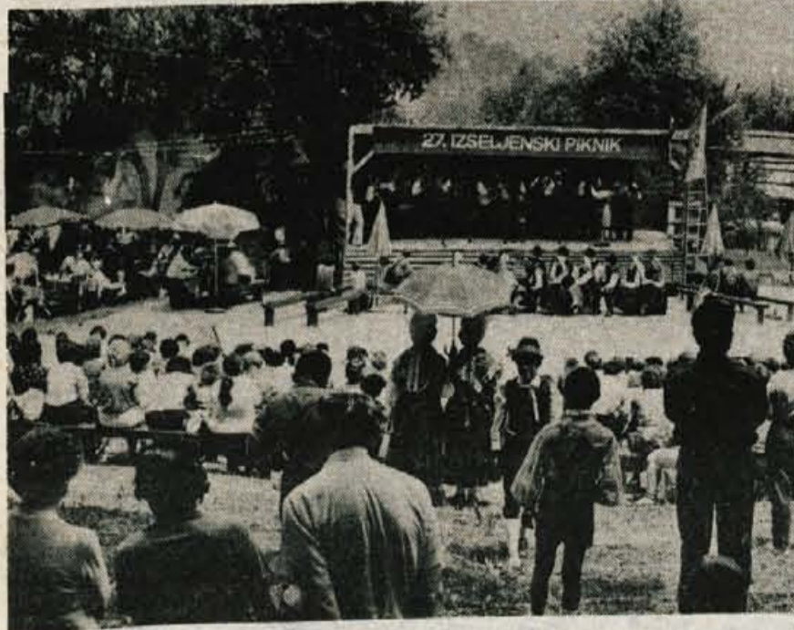
Skofja Loka – Tudi 27. izseljenški piknik je na loški grajski vrt privabil množice naših izseljencev, vse od bližnje Avstrije pa do pacifiške obale in iz Australije. Lepo je bilo še posebno, ker je prišlo z njimi tudi veliko mladih, že tretji rod naših ameriških Slovencev, ki se prav tako imajo za Slovence in hčejo poznati domovino svojih starih staršev. Izredno kvalitetnemu kulturnemu programu je tudi lep sončen dan pridal svoje in bilo je veselo in razigrano.