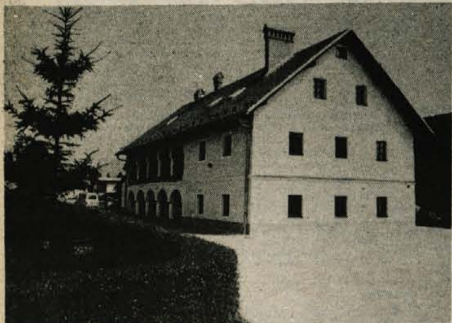
Kokrica — Konec prejšnjega tedna so prvi stanovanjci že dobili ključe v povsem obnovljeni Španovi hiši.

Obnova hiše, ki ni bila ne enostavna ne lahka, je veljala 8,6 milijona din, kar pomeni, da je kvadratni meter tako pridobljene stanovanjske površine veljal 25 tisoč novih din, kar je manj, kot je povprečna cena kvadratnega metra stanovanj v novih blokih na Planini. Kljub velikim težavam, ki so jim imeli izvajalci del, je bila hiša obnovljena mesec dni pred rokom, čeprav je bilo predvideno, da bo prva hiša iz revitalizacijskega programa obnove hiš v kranjski občini odprta za občinski praznik.