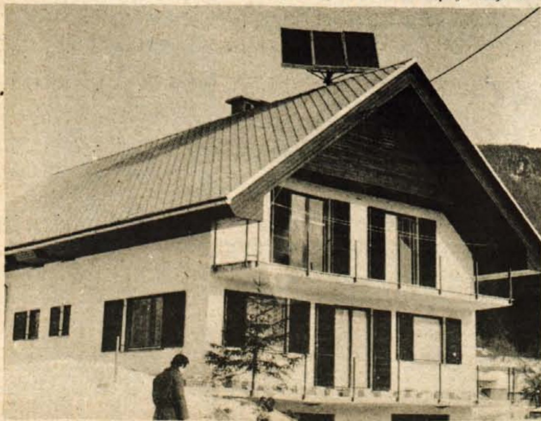
Posebnost Strojvega sončnega zbiralnika je, da se obrača za soncem, zato je njegov izkoristek večji.

Zaradi odprtega sistema je izkoristek kolektorja večji. Povejmo to na primeru. Ko pri zaprtem sistemu ni več sonca, se izključni termostat in preneha delovati črpalka, tekočina iz kolektorja pa ne izteče, temveč se ohladi na zunanjo temperaturo. Prihodnji dan gre torej v izgubo čas, da se spet ogreje na prejšnjo temperaturo. Pri odprtem sistemu pa voda po prenehanju delovanja iz kolektorja izteče. Ta ostane prazen in naslednji dan priteče v kolektor iz vodnega zbiralnika že malce segreta voda.