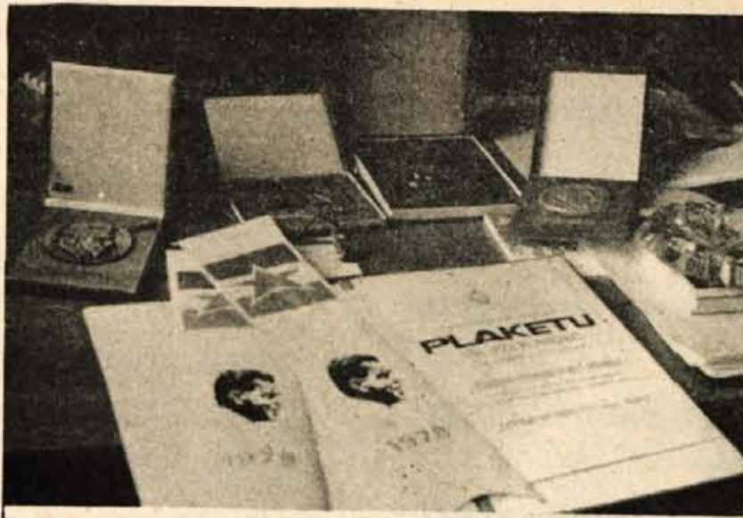
Jesenice - Nedavno je jeseniška mladina pripravila razstavo o mladinskih delovnih akcijah. S fotografijami, tiskano besedo, trakovi akcij, udarniškiimi značkami in drugimi dokazi uspeha brigadirjev...