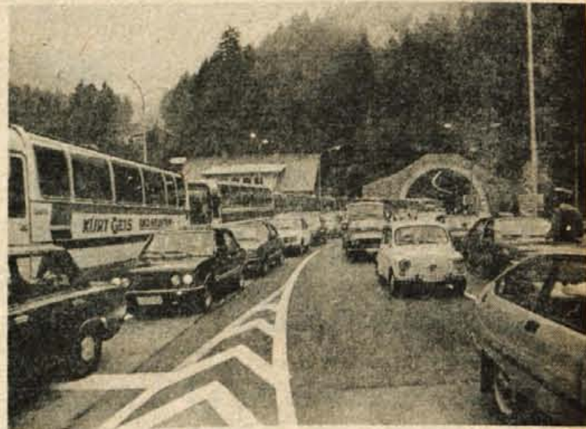
Ob prometnih konicah vstopajo vozila na mejnem prehodu Ljubelj v petih kolonah, ekipe carinikov in obmejnih miličnikov pa so podvojene.

Ob takšnih dneh seveda najbolj zgostijo promet na meji avtobusi naših zdomcev. Za dva, tri dni