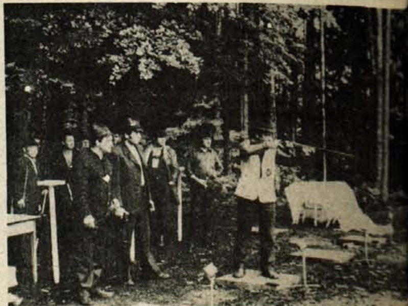
Srečanje lovcev - V lovski koči v Bistrici so se minulo soboto zbrali lovci, člani Lovske družine Udin boršt s člani pobratene Lovske družine iz Rijeke ter z lovci s slovenske Koroske. Srečanje je bilo kljub slabemu vremenu prijetno, saj so se lovci pogovorili o problemih in izkušnjah dela lovskih družin, obenem pa so se pomerili tudi v streljanju na umetne globe.