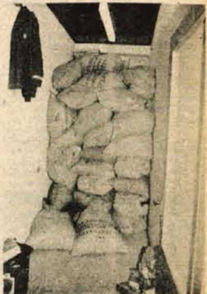
V tem priročnem skladišču je v vrečah okoli 3 tone zaplenjene kave, ki pa se v kratkem seveda znajde na policah trgovin, potem ko jo odkupi-jo veletrgovska podjetja.

posebnega. Nobena posebnost tudi ni, če cariniki splezajo na streho avtobusa in v zračnikih najdejo na desetine kilogramov dišečega zrnja »brez lastnika«. Če bi morda takšno skrivanje kave v avtobusih kdo imel