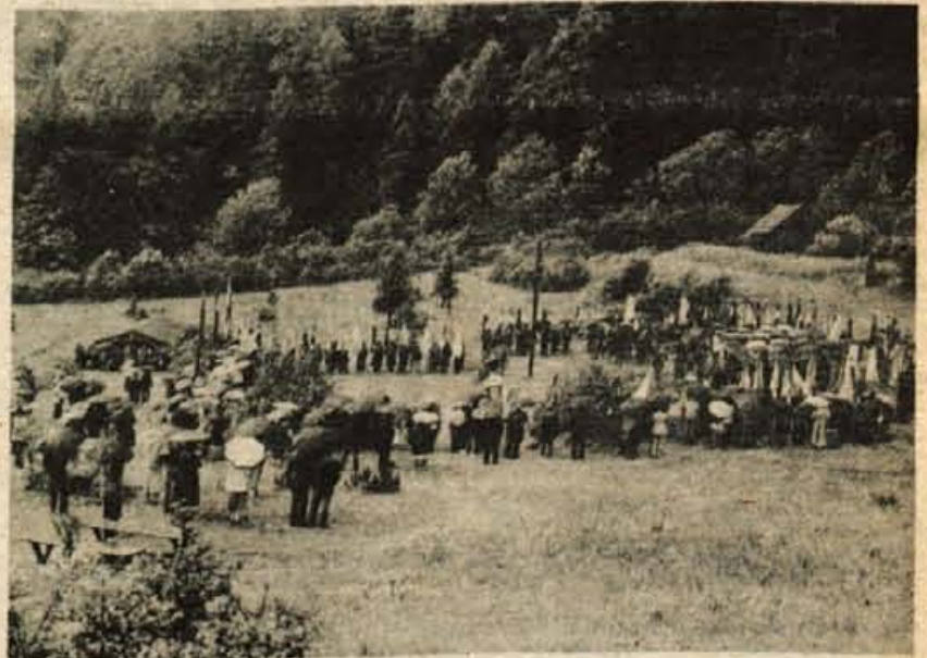
Proslava internirancev, zapornikov in izgnancev na Ljubelju

Sploh je nam ni treba vprašati, komu se je kaj splačalo ... D. Sedej