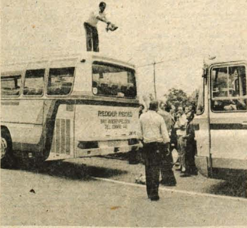
Zaradi velikega povpraševanja po kavi na našem trgu so potniki čez mejo pripravljali skrivati nedovoljene količine dišečega poživila tudi na streho avtobusa.

oddiha med domačimi se vsak konec tedna podajo iz Zah. Nemčije, največ seveda iz Bavarke prek Avstrije domov, ne glede na to, kako daleč imajo domače. Potovanje enkrat na teden domov pa je vabljivo tudi zaradi možnosti, da ob tem prinesejo domačim tudi kavo.