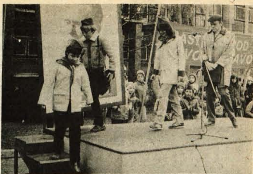
Kranj - Včeraj ob desetih dopoldne je iz Tolmina, Radelj ob Dravi, Kopra, Celja in Kranja že dvajsetič odšla na pot kurirčkova pošta s pozdravi predsedstvu SFRJ in z obljubo, da bodo zvesti vsemu bogastvu idej in urednot, ki nam jih je zapustil Tito. Gorenjska kurirčkova pošta, ki so jo s Trga revolucije pospremili številni pionirji, bo teden dni potovala po kranjski občini, nato pa jo bodo prevzeli Tržičani, od njih Jeseničani, ki jo bodo predali Radovljčanom in ti Škofjeločanom, konec aprila pa jo bodo prevzeli ljubljanski šolarji. Vseh pet poti kurirčkove pošte se bo sklenilo na zboru pionirjev Jugoslavije v Črnomlju. - H. Jelovčan

GLASILO SOCIALISTIČNE ZVEZE DELOVNEGA LJUDSTVA ZA GORENJSKO