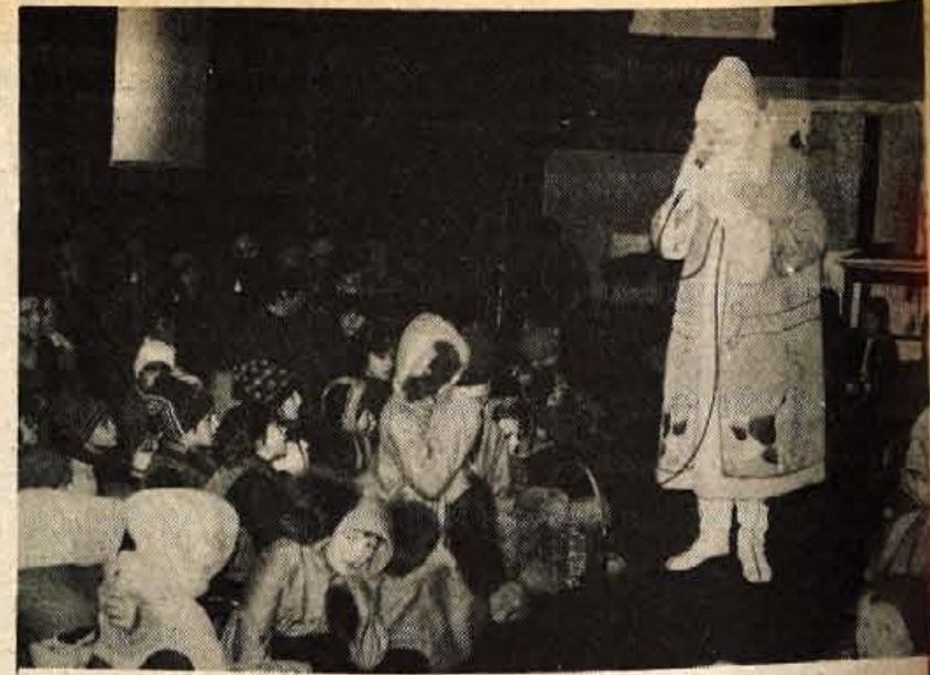
Najmlajših veselje – Na Kranjskem sejmšču so pripravili privlačno novoletno praznovanje za najmlajše. Malčke je obiskoval Dedek Mraz, obilo veselja pa jim je prinesla tudi razstava malih živali.

Medvode – Pod geslom »Kuhaj počasi in z ljubeznijo« so v delovni organizaciji Donit v Medvodah pripravili privlačno kulinarčno razstavo jugoslovanskih narodnih jedi. Med razstavljenimi dobrotami, ki so jih skrbno pripravile kuharske zanesljivakinje, je tudi mnogo takih, ki so že skoraj pozabljene.