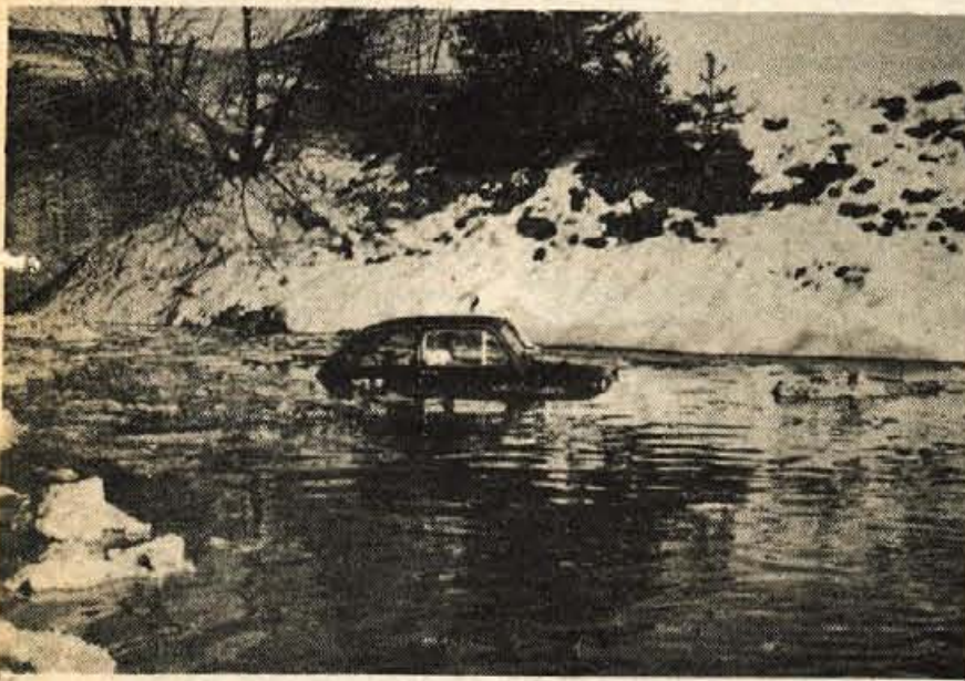
Voda, ki se ob slehernem večjem deževju nabere v podvozu pod glavno gorenjsko cesto v Bistrico, je v začetku leta zavedla tegale »ščikaa«. Skupaj z voznikom sta se dodobra namočila in okopala. Na odcepu iz glavne ceste Naklo-Jesenice pa tudi tokrat nobenega prometnega znaka, ki bi žu tu opozoril voznike na nevarnost in neprevoznost. P. Leban

Razstavljenе živali bodo strokovno ocenili strokovnjaki iz domovine in Avstrije. Med razstavo bodo pripravili tudi sodniški seminar za cenilce malih živali, ki jih v Sloveniji žal ni in so na takih prireditvah docela odvisni od kolegov iz sosednjih republik in Avstrije. Ljubitelji malih živali si bodo lahko na razstavi kupili tudi literaturo, ki jim bo v pomoč pri rejji živali. Razstava bo odprta v petek, soboto in nedeljo od 9. do 19. ure.