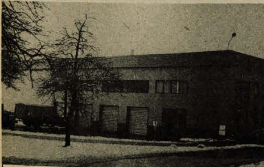
Kamnik – Gradnja regalnega skladišča so v kamniški Eti načrtovali že pred štirimi leti, ko z gradnjo ni bilo problemov in ko tudi investicija še ni dosegla visokih števil. Koncem lanskega leta so skladišče dogradili in se z njim rešili dolgoletnih zadrževanj v gostovanju po neprijetnih tovarniških prostorih. Skladišče ima 7.000 paletnih mest, v njem pa je tudi sodobna pakirnica. – Foto: D. Zlebir