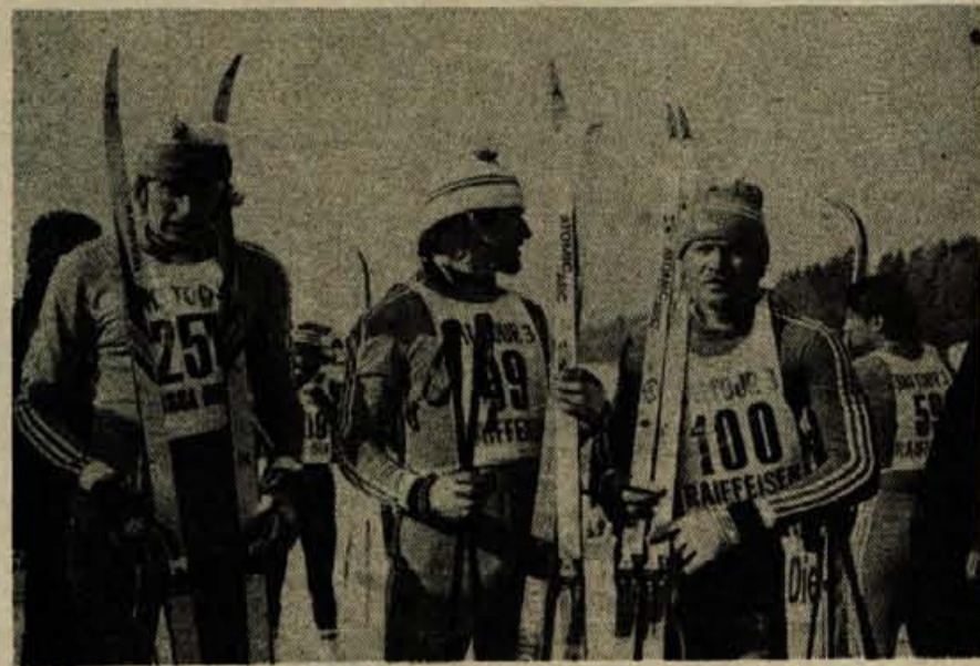
Na letošnjem teku Treh dežel so največ uspeha imeli smučarski tekači Avstrije. Eder (2), Maier (1), Lakner (3) so osvojili tri prva mesta. Takoj za njimi so se do šestega mesta uvrstili trije italijanski reprezentanti

TRBIŽ - Spet se je izkazalo, da je tek Treh dežel, ki ga prirejajo TD Trbiž, obmojno tolovalno društvo Podkloster in TD Kranjska gora, edinstvena množična rekreativna smučarska prireditelja v Evropi. Trideset kilometrov dolga smučniška namreč poteka skozi tri države, čez tri državne meje, skozi tri jezikovna področja, skozi države dveh različnih