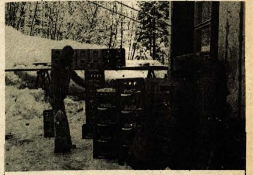
S tovorno žičnico prevažajo na Vogel pijačo in živila, navzdol pa bi žičnica lahko prepeljala tudi odpadke.

Hotel Ski na Voglu bodo morali bolj vzdrževati in poskrbeti za večji red in čistočo. Predvsem osebje bi se moralo tega zavedati, poleg tega pa tudi uprava Alpetoura, saj ji ni v čast, da ima na našem znanem smučišču tako zanemarjen gostinski objekt. D. Kuralt