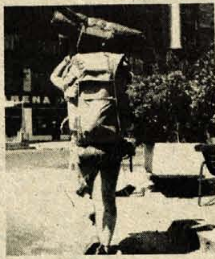
Student naredi za pivo vse, tudi tri nahrbtnike nese

Na konzulatu so bili razpisni z nasveti primernimi za študentski žep: »Lahko greste z letalom iz Casablanca ali nazaj v Evropo in od tam z ladjo!« Vsi načrti so se nam sesuli, a kaj moremo, bomo pač šli nazaj v Evropo in si privoščili nekajtedensko nama-