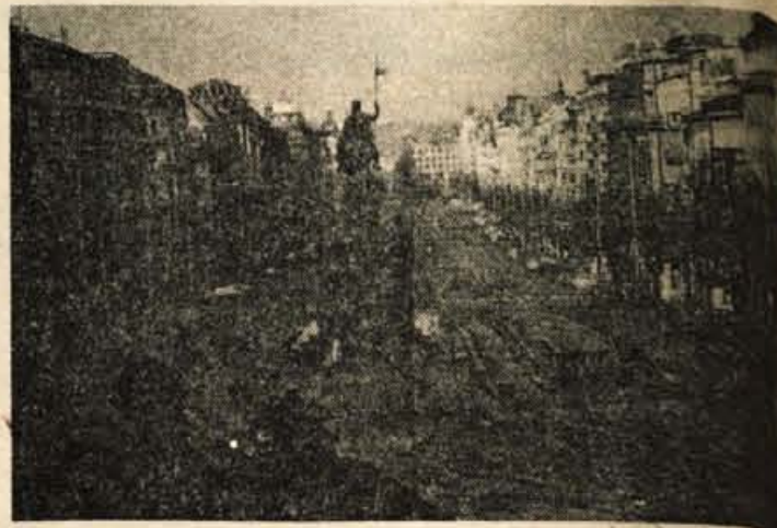
Praga premore izredno veliko kulturno-zgodovinskih znamenitosti.

Kompas v sodelovanju z Jano prireja tridevni izlet v Prago – »zlate prestolnice«, ki ohranja bogato dediščino preteklosti. Izlet bo doživetje. Organizator je poskrbel za pester program, udobno avtobusno in dober hotel. Cena potovanja je samo 3.450 din. Odhod 5. marca, povratek pa 7. marca.