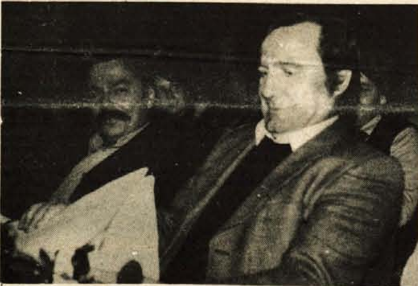
Nagrado Slavka Gruma za najboljšo dramsko besedilo so na Tednu slovenske drame podelili Dragu Jančarju za »Desidenta Arnoža in njegovi«. Grün-Filipićevo priznanje, ki ga za slovensko dramaturgijo podeljujejo vsaka tri leta, pa je letos prejela dramaturška skupina Drame SNG iz Maribora. Na sliki: levo Drago Jančar, desno Tone Partljič, ki je prevzel Grün-Filipićevo priznanje.