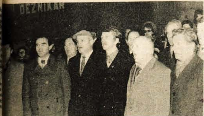
Podoknica pred Prešernovo hišo — Minulo nedeljo, na predvečer slovenskega kulturnega praznika, sta mešani in moški pevski zbor kranjske Iskre pripravila večer podoknic pred Prešernovo hišo v Kranju. S tem so se tudi pevke, ki že nekaj časa pridno vadijo skupaj s pevci, prvič predstavile občinstvu. Vsakoletni nastop Iskrinih pevcev pred Prešernovo hišo je postal tradicionalna in priljubljena prireditelja.