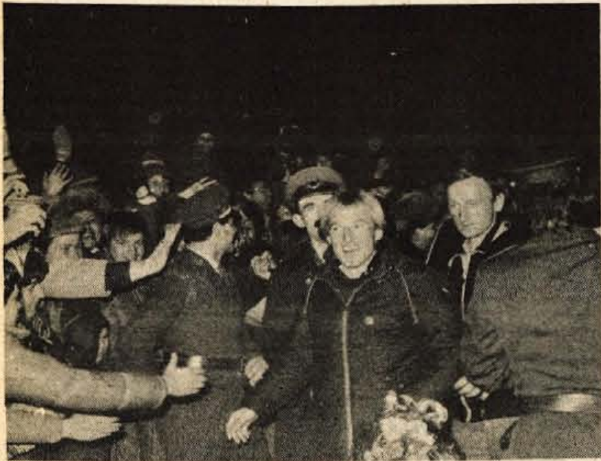
Naši alpski smučarji so sicer pričakovali prisrčen sprejem ob vrnitvi v domovino po velikem uspehu na svetovnem prvenstvu, vendar se takšnega, resnično množičnega ljudskega slavlja niso nadejali