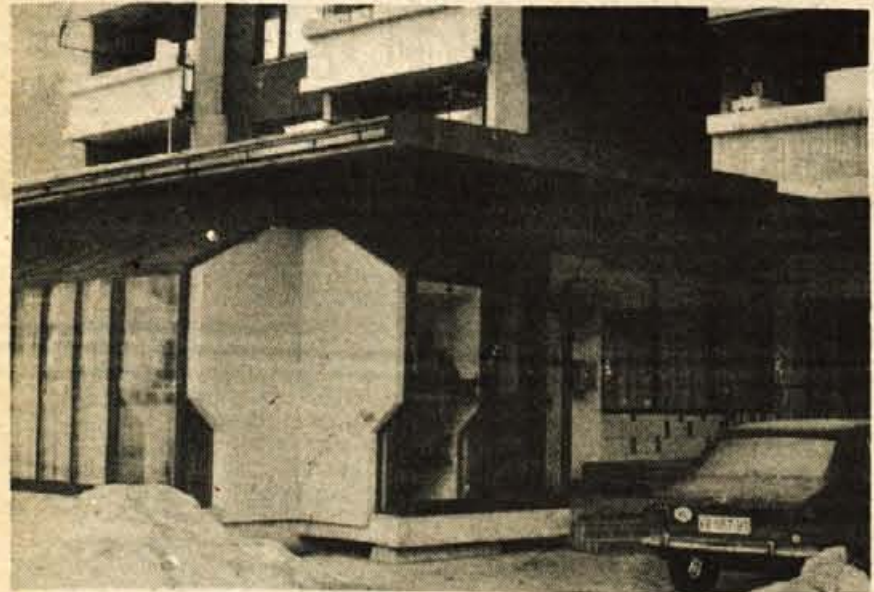
Vzorno čista pošta na Jesenicah.