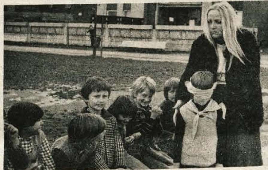
Čiv, čiv, ugani, kdo sem!

Se slovenska naloga; ena stran črk G pa prepis besed iz berila: GLAS