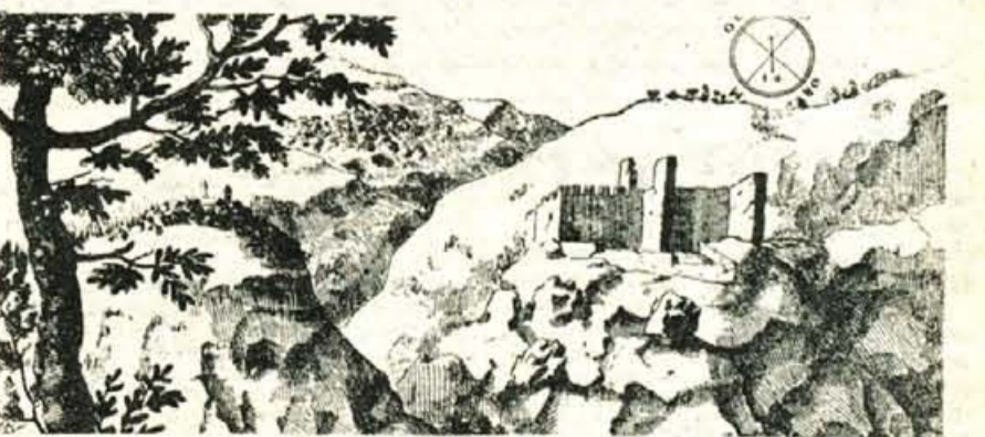
Razvalina gradu Gutenberga nad Bistrico pri Tržiču - take je videl že stari Valuzor (bakrorez v Slavi vojvodine Kranjske, 1689)