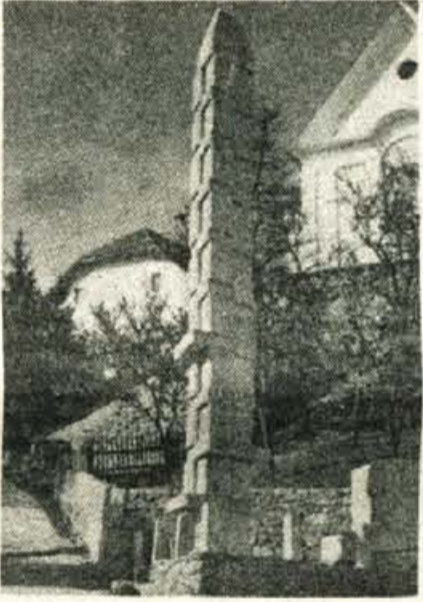
Skupni vaški pomnik NOB v Kovorju.