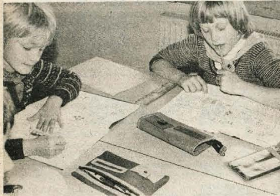
Presnete množice in ta nova matematika!