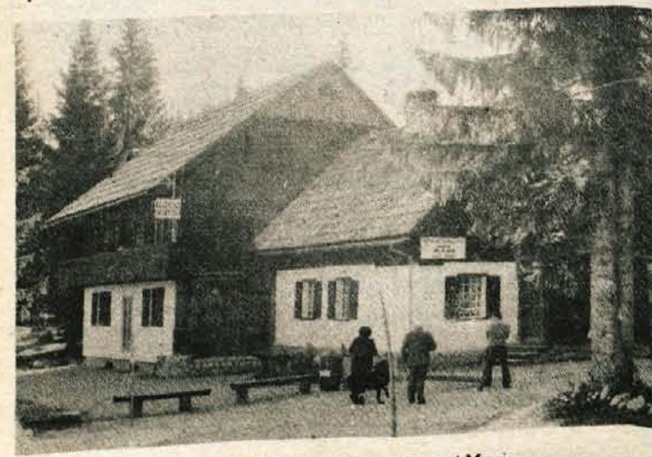
Edino gostišče, ki je na Pokljuki odprto, je penzion pri Mari.

A navkljub vsemu odhajajo iz Pokljuke razočarani. Razočarani nad to, da je Pokljuka še vendar takšna, da je pred leti, z majcenimi, majhnimi pridobitvami. Ze res, da morda bolje, da je nismo našli morda bolje, da je miru željni hoteli in da se miru željni hoteli dobro počutijo, vendar je očitno, da je ostala pozabljena. Ze krasna majava vlečnica, ki vsako leto lje ob hotelu, je zgovoren dokaz, bi bilo lahko drugače ... D. Kuralt