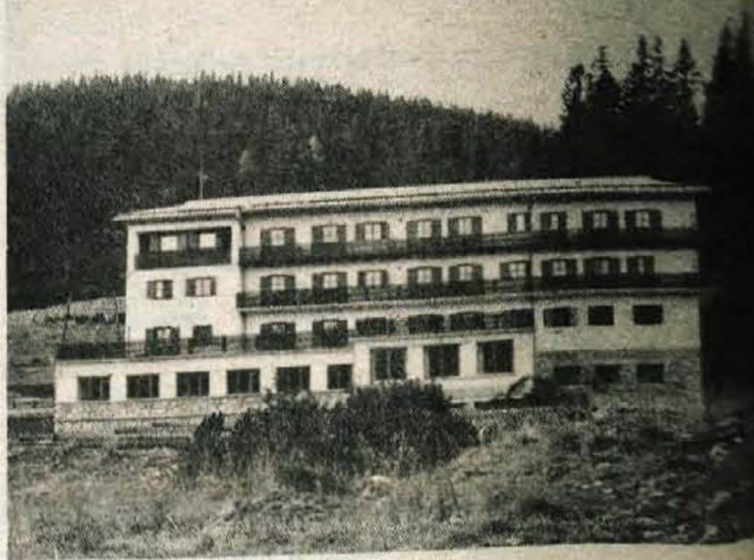
Šport hotel na Pokljuki je zaprt.

Če bi se postavili na bolj realna tla bi rekli, da sredi Pokljuke takšnega osamljenčka, ki ponuja parket pa bazen pa viski v disco klubu, nikakor ni treba. Smučarji, ki prihajajo pozimi, so v »pancerjih«, in jim na parketu spodrsne, poletni gostje pa so starejših let in si želijo stezic, miru in jim je kaj malo mar za bazen s toplo vodo. Če bi hoteli, da na Pokljuko drvijo mlajše družine, bi nujno potrebovali poleg hotela vsaj nekaj konj in hlevov, gugalnice, peskovnike, športna igrišča. Skratka: