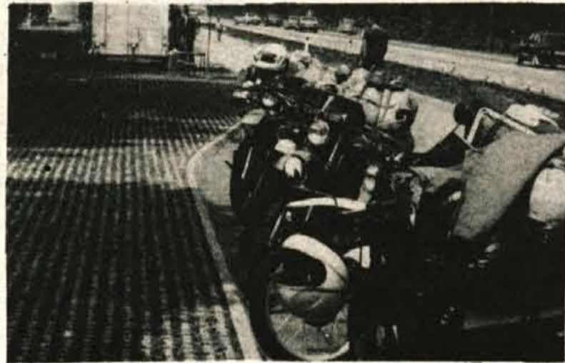
Turisti se vračajo – Kolone motoriziranih turistov se obračajo nazaj, hitijo domov. Na naših cestah je tudi vse manj motoristov. Takole so v Jevrški gmajni hladili motorje pred nadaljevanjem poti.