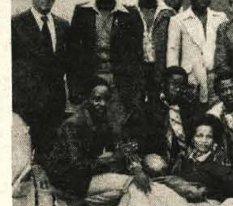
Mojstrana — V četrtek, 3. septembra, je obiskala jeseniško občinsko skupina namibijskih študentov, ki so na šestmesečnem tečaju v mednarodnem centru za razvoj dežel v razvoju v Ljubljani. Studentje iz Namibije so si že ogledali nekatere kraje in mesta v Jugoslaviji. Na jeseniškem obisku so se pogovarjali o celodnevni šoli v osnovni šoli Tone Čufar na Plavžu, obiskali Gorenjska oblačila na Javorniku ter Kranjsko goro in Rateče.

Študentski dom predstavlja drugo fazo gradnje dijaškega doma na Kidričevi cesti 53, kjer v prihodnje nameravajo zgraditi popoln Center usmerjenega izobraževanja. Investitor je zato sklenil samoupravni sporazum z domom učencev Ivo Lola Ribar, po katerem bo slednji prevzel vso upravo tudi nad novo zgrajenim študentskim domom. Leta je za zdaj načrtovan za 140 ležišč. Sobe bodo dvoposteljne, prirejene specifičnim potrebam študentov, opremljene tudi s čajnimi kuhinjami in hladilnimi komorami. V vseh drugih značilnostih pa je študentski dom projektiran tako, da se ob morebitni nezasedenosti in povečanih potrebah srednješolcev spremeni v dijaški dom.