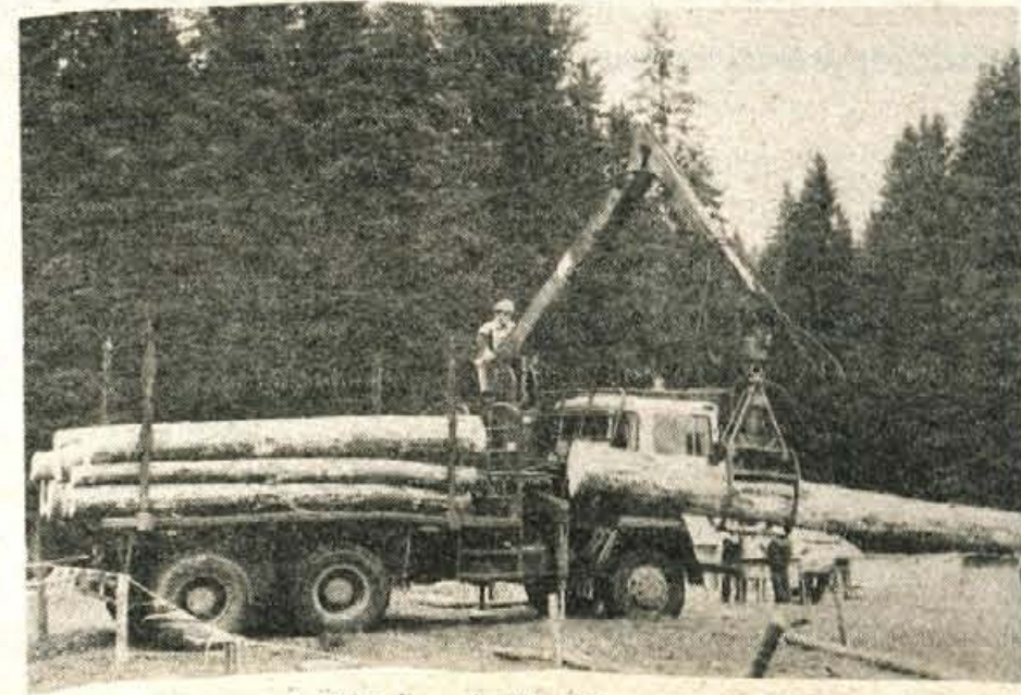
Les je bilo treba naložiti in lepo zložiti...