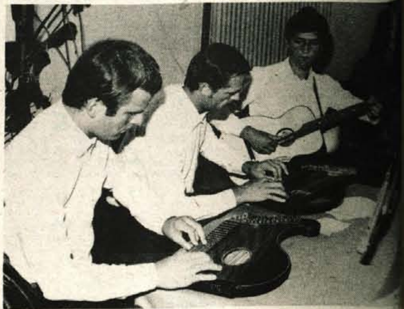
Člani citraške skupine iz Tržiča