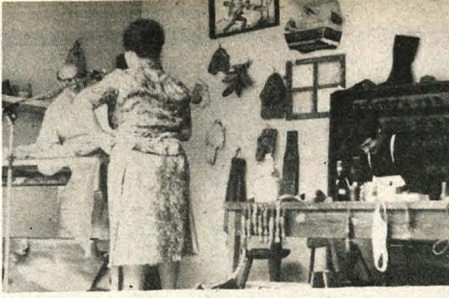
Stara šušarska delavnica je oživila pri paviljonu NOB. Sege, ki so jih vzeli iz zaprašenih bukel, so delavci Peka sami privedli in z njimi navdušili številne gledalce.