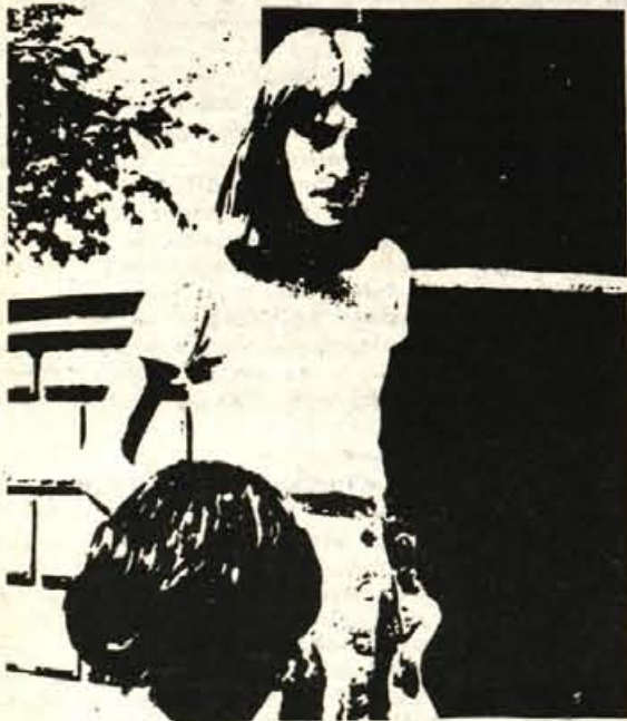
Deklica, ki sovraži

Pisateljica Berta Golob je v knjigi »Sovražim vas« zbrala prgišče pretresljivih črtic, s katerimi razkriva stisko mladih fantov in deklet, ki jih je življenje pahnilo pod streho vzgajališča v Preddvoru.