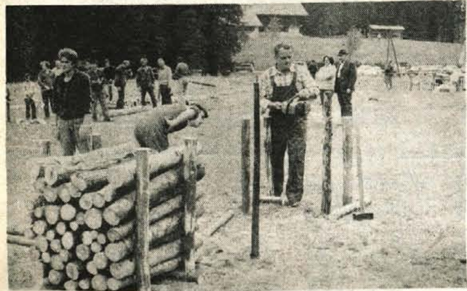
Na tekmovanju gozdarjev je zmagala spretnost in izkušnost...