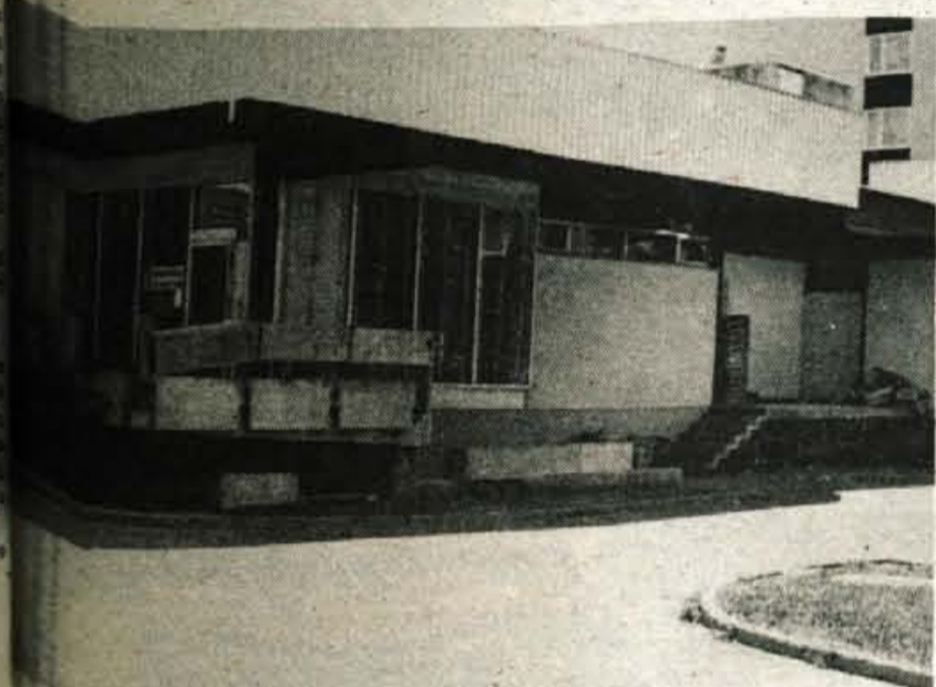
Poslovalnica na lovorikah - Tako bi lahko rekli, ko bi si ogledali Poslovalnega trgovskega centra v krajevni skupnosti Vodovodni naselje. Le-ta je namreč lani veljala za najbolj čisto in urejeno, letos pa zaradi takih smetiščnih svetov morala naslov predati v druge roke. Krajani se tega zavedajo, zato so s KS že nekajkrat opozorili na nevarnost. A tudi grožnja s sanitarno inspekcijo ni nič zalegla. V ozadju stavbe leži na kupe odpadkov, ki jih veter brezskrbno raznaša po okolici.