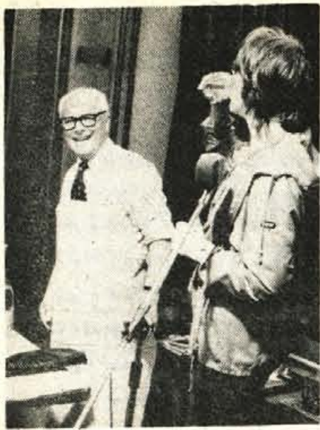
Kozarček, pa cigara, to se za pravega šušarskega pomočnika spodobi.