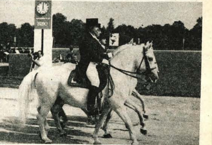
Med posameznimi kasaškimi dirkami so pokazali svoje mojstrstvo skraški biserte, lipčanci iz Lipice.