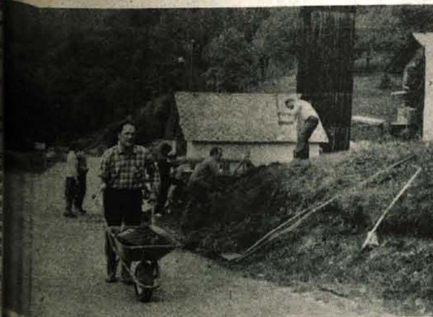
Nekdanji vasi nad Begunjami je bila prva delovna akcija civilnih invalidov.

akcija civilnih invalidov vojne Gorenjske, ki se jo je udeležilo 25 invalidov iz vseh gorenjskih občin. V nekdanji partizanski vasi so