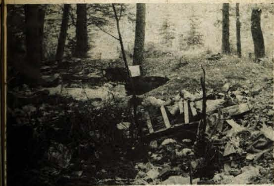
Ve lepo in prav, če pomete vsak pred svojim pragom, toda, dragi Senčurjani, ali ni tole spraga Senčurja?