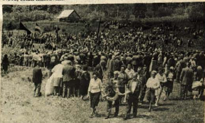
Da bi se nikoli ne pozabilo trpljenje taboriščnikov in da bi se mladina zavedala prave poti, so poudarili govorniki na veličastnem srečanju internirancev z mladino v soboto v Podljubelju.