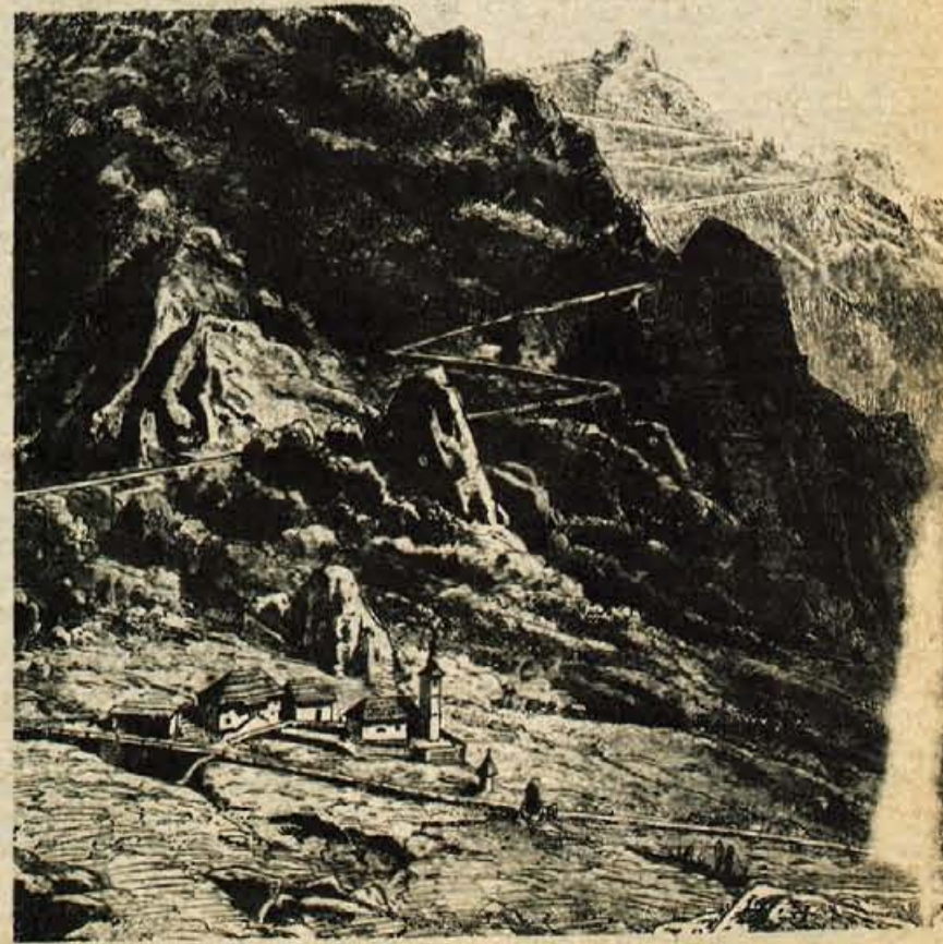
Stara cesta čez Ljubelj po risbi iz srede 19. stoletja.