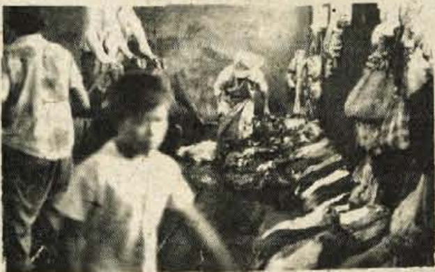
Prizor iz klavnice. Tako kot živino so pobijali tudi Indijance

Noč je bila prekratka. Drugi dan sem vozil pod pobočji in iskal stezo naprej. Kakšna prostranstva! Sem sam na svetu ali kaj, zaboga? Zvečer sem pojedel zadnji kruh, plastično posodo za vodo sem po nesreči razbil že dopoldne. Ponoči se mi sanjajo same traparije. Nekaj o fašistih, zavoženih ljubeznih, uh, grozno! Tretji dan sem že na poti, ko naposed obupam. Za koga naj se pobijam po teh skalah? Vse bom razbil, potem pa crknil brez hrane ob prazni mlakuži, sam, samcat, pozabljen od ljudi, požrt od kakšne slinaste hijene. Marš vse skupaj ... Nazaj!