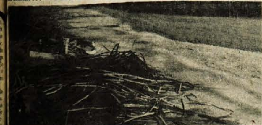
Bobovrek - Podrt most ob jezeru in kupi smeti za cesto in na njej prav tako niso nikakršna turistična privlačnost Bobovka. Tudi okolica je prej zanemarjeno smetišče kot kraj za oddih, saj spremljalec skoraj na vsakem koraku naleti na kose polivinila, konzerve in ostale steklenice.