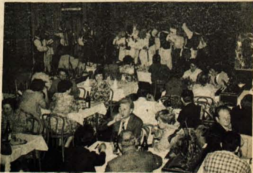
Kooperantje Gorenjske obrtne zadruge so imeli občni zbor v kranjski Creini. Letos jim je v kulturnem delu večera zaplesala folklorna tovarne Sava.