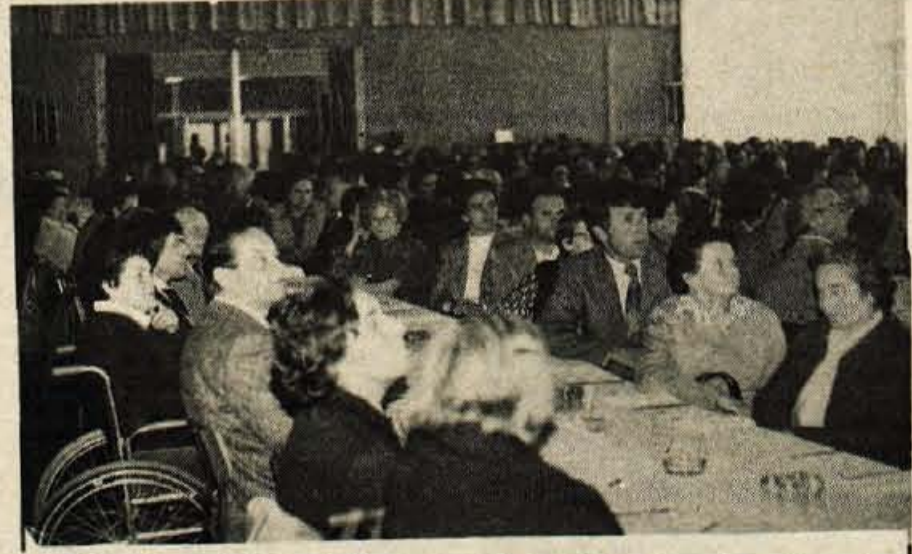
»Popolno sodelovanje in enakost invalidov« je geslo mednarodnega dneva in leta invalidov, ki ju je Društvo invalidov Kranj počastilo s slavnostno akademijo v soboto, 4. aprila, v delavski restavraciji Iskre na Laborah...