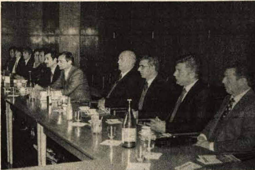
Kranj - V soboto, 4. aprila, je Kranj obiskala delegacija iz prijateljskega italijanskega mesteca Fiumecella, ki že nekaj let s Kranjem vzdržuje stike na kulturnem, športnem in turističnem področju...