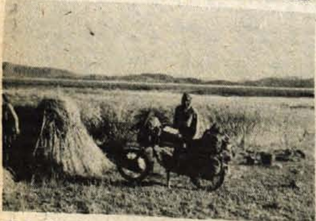
Med prijatelji ob jezeru. Bolj ko so ljudje skromni, bolj so gostoljubni

Ze s hriba zasmrdi po ribah in jezerskih travah. Kamnite ulice so hladne in vetrovne. Železnica, ki me je spremljala vso pot iz Cusca, se konča ob vodi.