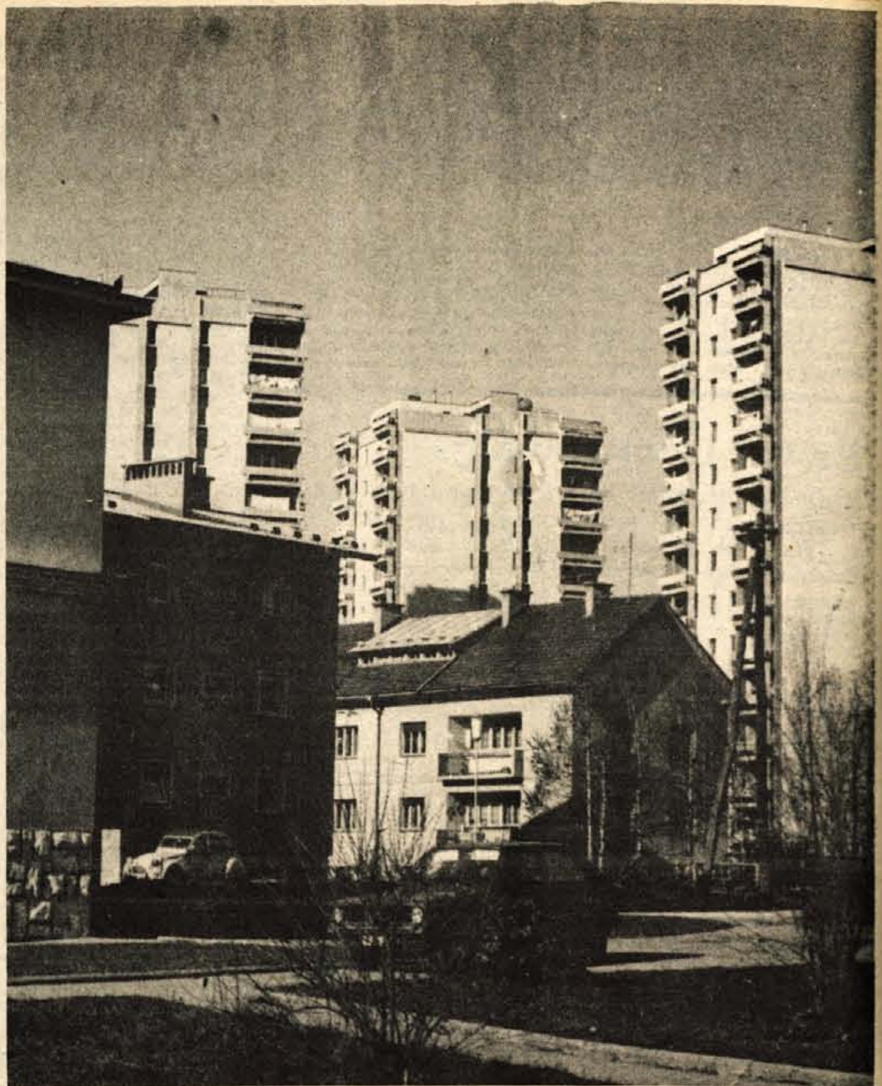
OBČINA ŠKOFJA LOKA PRAZNUJE

Najbrž pa bi jih kazalo iskati v tem, da cene kmetijskih izdelkov niso vezane na ceno repromateriala in se višje cene zanje priznavajo vsaj pol produkcijske dobe prepozno. Nadalje bi moralo biti več spodbude za kmetovanje v hribovitih predelih. Zakaj je to za škofjeloško občino tako velikega pomena, najbrž ni potrebno posebej poudarjati. Sredstva, ki se namenjajo za regresiranje hrane, bi bilo veliko bolj smotno namenjati za pospeševanje kmetijske proizvodnje. Izenačevanje statuta delavca in kmeta poteka prepočasi. Prepočasi poteka tudi izgradnja infrastrukture, predvsem telefonije in cest v kmetijskih, predvsem hribovitih predelih. Ne nazadnje bi morala biti podana zakonska možnost za