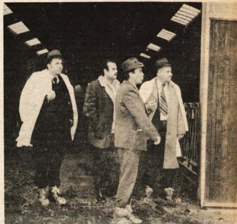
Del kranjske delegacije je obiskal farmo v bližini Sente, na kateri je okrog 600 govedi. Hlev je grajen tako kot naš v Poljčah.