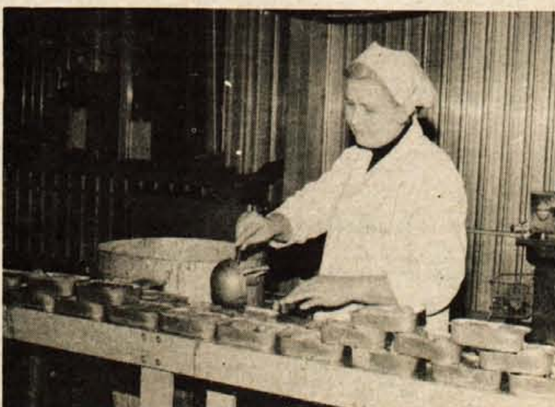
Agroindustrijski kombinat Senta ima tudi temeljno organizacijo za izdelovanje gotovih jedil. Želja proizvajalca je uveljavitev tudi na gorenjskem trgu.