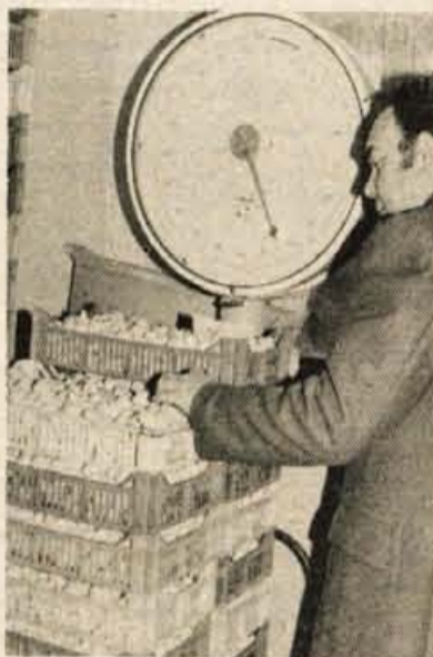
Senta ima obrat za vzgojo gob pečurk. Vedno bolj se uveljavljajo. Eden od pogojev za gojenje gob so konjski odpadki, zato imajo v Senti dva hleva z okrog 300 konji.

Zaradi razdrobljenosti kmetijskih površin, kar velja za zasebni sektor, ki ima v lasti 16 od skupno 26.000 hektarjev površin, za zdaj še skopega združništva oziroma združevanja dela in sredstev v temeljno organizacijo kooperacije in težav, ki so večinoma enake našim, te količine še niso skrajna meja zmogljivosti sentarskega kmetijstva in proizvodnje hrane. 15 starih milijard dinarjev bi na primer potrebovali v občini Senta, da bi zgradili farmo za 40.000 prašičev. Sami tega denarja ne zmorejo. Iščejo sovlaganja med tistimi, ki so dolgoročno zainteresirani za dragoceno prehransko surovino. To velja za prašiče, za koruzo, pšenico, moko, sončnice, sladkor, melaso in druge prehranske ter surovinske izdelke.