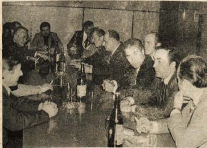
Prisrčno je bilo srečanje s predstavniki sentarske skupščine, družbenopolitičnih organizacij in gospodarstva. Decembrsko v Senti zanesljivo ni bilo zadnje.

članov v pobrateni Senti. Omenjeni obisk je bil pomemben korak pri doseganju skupnega cilja pobrateneja, ki ne sme ostati le pri besedah in formalnih izmenjavah delegacij, ampak se mora vpeti v vsakdanje življenje obeh občin. Zadnji obisk v Senti je tudi opozoril, da sodelovanja ne kaže graditi le na ozkem gospodarskem področju, ampak ga kaže razširiti na turizem ter na področja stanovanjskega gospodarstva, urbanizma, komunale, gradnje skladišč, transporta in na druga področja gospodarskega in družbenega življenja nasploh.