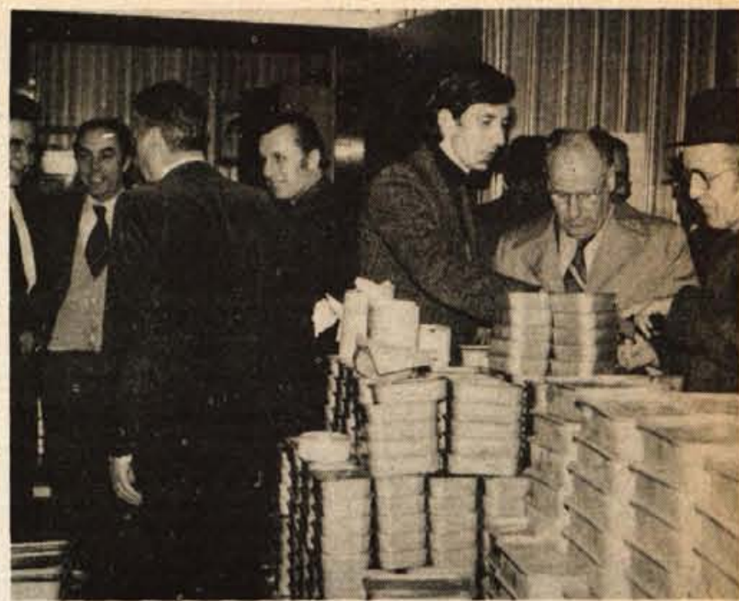
Kranjska delegacija je obiskala najpomembnejše delovne in temeljne organizacije v Senti. Dobrodošla je bila izmenjava izkušenj, kar vzpodbuja medsebojno sodelovanje.