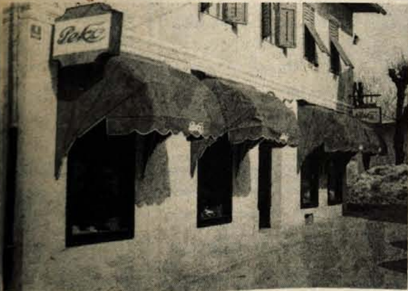
Prodajalna Peka v Radovljici, velika in prostorna, s široko izbiro za vsak okus...