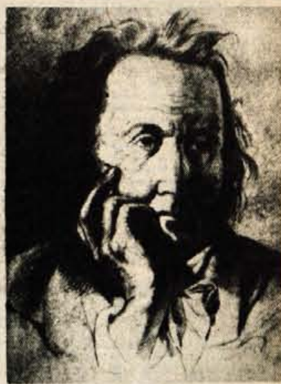
Koželjeva upodobitev ostarelega in zagrenjenega pesnika