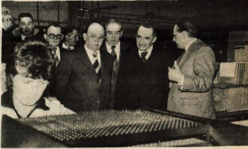
OBISK ČESKOSLOVAŠKE ZUNANJETRGOVINSKE DELEGACIJE - Pretekli teden je obiskala Slovenijo 6-članska delegacija Čekoslovaške, ki jo je vodil minister za zunanjo trgovino Andrej Barak. Delegacija je med drugim sprejel tudi predsednik republiškega izvršnega sveta Janez Zemljarič, med svojim bivanjem v Sloveniji pa je delegacija obiskala tudi kranjsko Iskro, od koder je naš posnetek (jk)