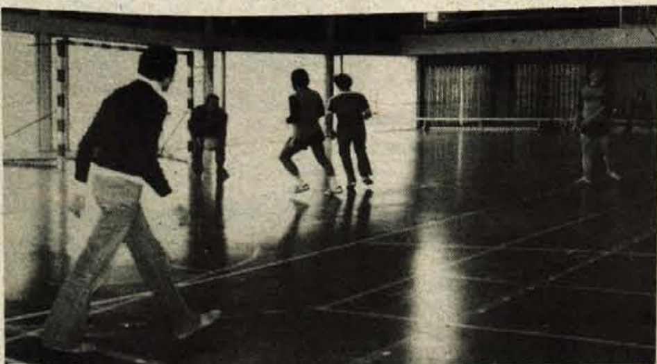
Kar 64 ekip se je prijavilo na II. zimsko prvenstvo Kranja v malem nogometu. Veliko ekip je prišlo celo iz Ljubljane in okolice, tako da je turnir kvaliteten in zelo zanimiv. Igra se v sobotah in nedeljah v novi športni dvorani na Planini, prireditelj pa je ZTKO Kranj. M. Ajdovec

KRANJ – Kranjski šahovski klub bo v četrtek 12. marca v novih prostorih na Prešernovi 11 organizator letošnjega občinskega moštvenega tekmovalništva za pokal maršala Tita. Tekmovalništvo se prične ob 17. uri. Prijave bo organizator sprejemal do 16.45. Članstvo moštvo šteje štiri igralce in dve rezervi, ženske pa imajo dve igralki in eno rezervno. Število moštvev je neomejeno. Organizator pričakuje lepo število moštvev, saj je v naših organizacijah združenega dela in po solah šah tista disciplina, ki jo vsi radi igrajo. -dh