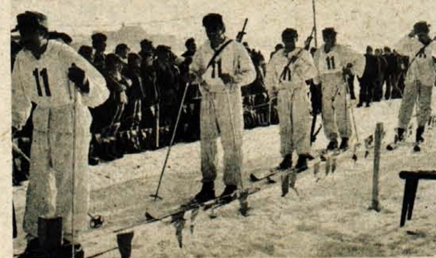
Zmagovita moštva v patrolnih tekih na cilju

Smučarski klub Triglav Koper alpska sekcija organizira pod vodstvom vitezov trgovaškega podjetja KRA - GLOBUS Kranjsko tekmovanje v veleslalomu za POKAL KOKRE-GLOBUS. Tekmovanje bo v nedeljo dne 11. 3. 1973 ob 11. uri na Kravcav. SK Triglav Koper pokrovitelj vabita vse ciljanke in ciljanke letnik 1973, 1973 in mlajše tekmovalce, ki so zainteresirani za tekmovanje in prijavitelj pri bližnji športni sekciji KRA v GLOBUSU ali na izrednem tekmujevanju. Startne številke se bodo dobile uro pred pričetkom tekmujevanja na cilju veleslalomске proge na Koperu.