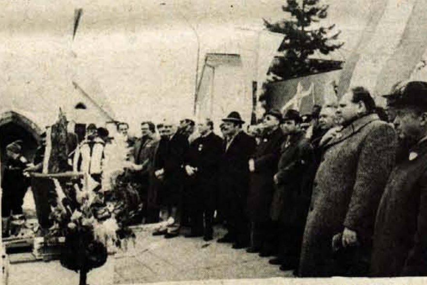
Na slovesni podelitvi priznanj najboljšim na smučarskem teku Treh dežel so se v Trbižu zbrali tudi predstavniki Avstrije, Italije in Slovenije.