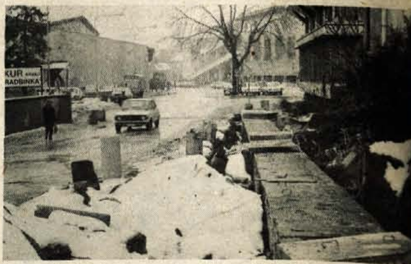
Kranj — Dela na toplovodni napeljavi od SDK na Gregorčičevu so bila pozimi začasno ustavljena, delavci pa so ta del ceste kar so zavarovali — kar s sodi. Nepreviden pešec — otrok ali odrasel utegnil spregledati konec hodnika za pešce in se v potsem vanem jarku poškodovati. — Foto: M. Ajdovec