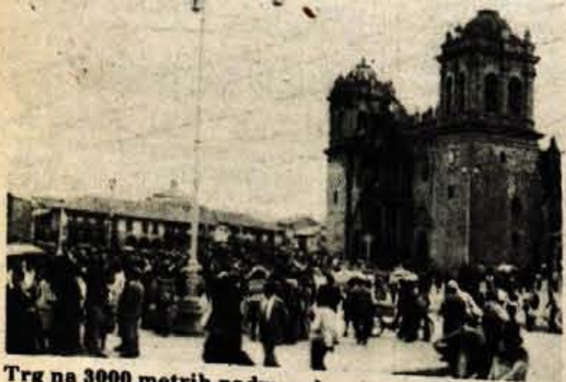
Trg na 3000 metrih nadmorske višine

Ko rahlo zadremam, me vrže pokonci. Silna mora. Ne vem, kje sem. Ne morem se spomniti, kako sem