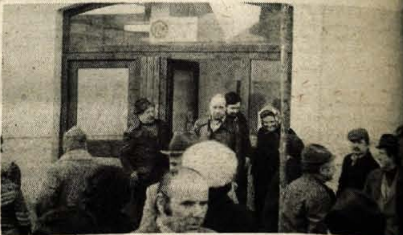
Hrastje — Kmetijskoživilski kombinat Kranj, tozdr Kom. servis, je konec prejšnjega tedna v krajevni skupnosti Hrastje odprl novo samopostrežno trgovino. Nekdanji strojni in mešarska kmetijska zadruga — temeljna zadružna enota Cerklje in na skupnost Hrastje-Voklo oddala KŽK včasno uporabo za Investitor tozdr Komercialni servis je za preureditev stavbe za 2 milijona dinarjev deloma iz lastnih sredstev, deloma s kreditno urejanju nove trgovine, ki ima 98 kvadratnih metrov površine in menjenja oskrbi preivalcev Hrastje, Voklega. Prebačevega in so s prostovoljnimi delom useskozi pomagali tudi krajani.