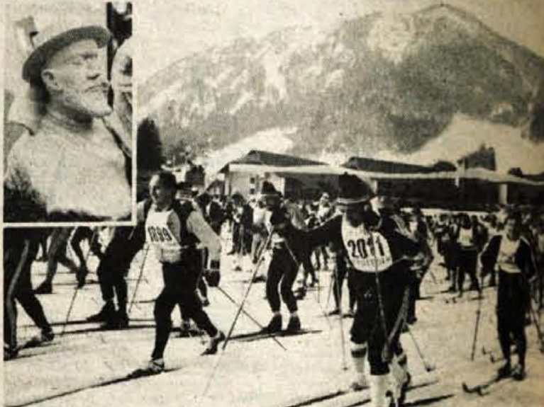
V Kranjski gori je bil start teka Treh dežel. Na trideset kilometrov smučino s ciljem v Selčah se je pognalo nad dvatisoč dvesto tekačev in moški konkurenci. Leseni pokal Kugyja so dobili Kranjskogorčani in imeli med vsemi največ udeležencev.

Dekleta, ki so imela enako progo, so se skoraj enakovredno borile s fanti. Vendar