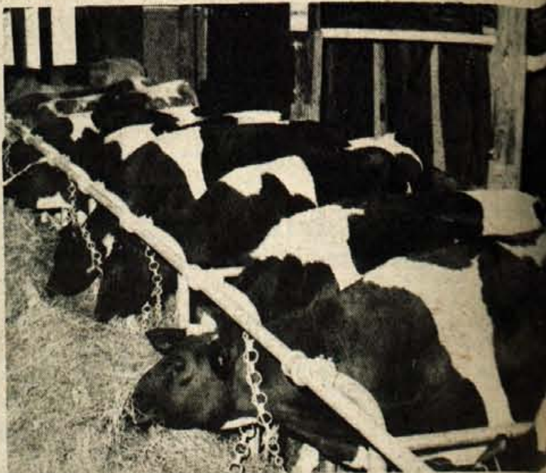
Ustanovitev sklada za izvajanje intervencij v kmetijstvu in porabi hrane pomeni nadaljevanje politike pospeševanja kmetijstva v tržiški občini. Seveda pa bodo z novim načinom zbiranja denarja za pospeševalnih ukrepov lahko še bolj razširili.

Ustanovitev sklada pomeni le nadaljevanje politike pospeševanja kmetijstva v tržiški občini. Že v preteklem srednjeročnem obdobju je skupščina občine namenjala del proračunskega denarja za pospeševanje kmetijstva, predvsem za premiranje nakupa in vzreje plemenske živine, regresiranje obresti, pospeševanje pašništva, sofinanciranje pospeševalne službe in podobne namene. Z novim načinom zbiranja denarja bodo obseg teh ukrepov še bolj razširili.