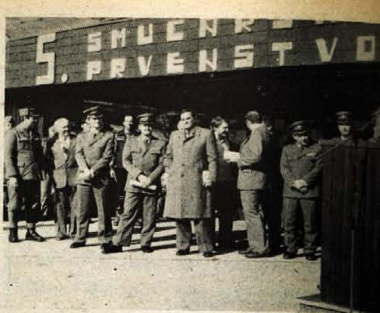
Tudi letošnje prvenstvo je presešlo svoje športne okvire, je sklepno svečanostjo poudaril generalmajor Alojz Hren. (S) – Foto

SVETOVNI POKAL – SKUPNO – 1. Stenmark 260, 2. Ph. Mahre 234, 3. Müller 146, 4. St. Mahre 127, 5. Žirov 123, 6. Križaj 110, 7. Weirather po 115, 8. Podboraki 110, 9. Wenzel 107, 10. Orlainsky 105, 23. Strel 49. VELESALOM – 1. Stenmark 125, 2. Žirov 79, 3. Ph. Mahre 74, 13. Križaj 34, 14. Strel 32, 21. Kuralt 11.