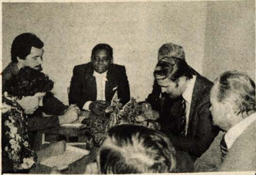
OBISK KUBANSKE DELEGACIJE — Na povabilo zvezne konference SZDL je obiskala Jugoslavijo delegacija kubanske socialistične partije. Med drugim je obiskala tudi Kranj. Bila je v tovarni Sava in se pogovarjala s predstavniki Kmetijskoživilskega kombinata.

Na pobudo kardiološke sekcije pri Slovenskem zdravniškem društvu naj bi v okviru SZDL ustanovili društva za preprečevanje bolezni srca in ožilja. Osnovna naloga društev naj bi bila, ob strokovni pomoči kardiologov ter strokovnjakov drugih področij, seznanjati ljudi, kako preprečevati obolenja: kako zdravo živeti, kaj je zdrava prehrana, kaj je rekreacija in podobno.