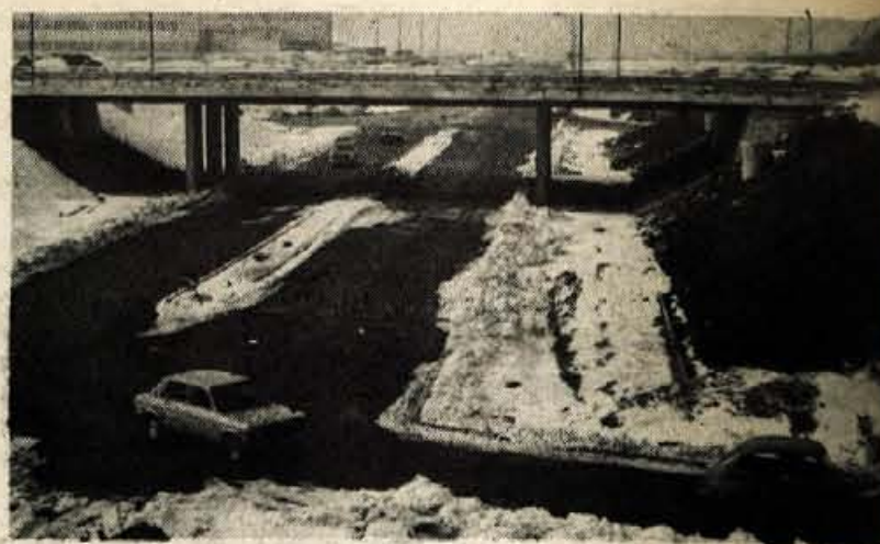
Kranj — Te dni na Laborah že lahko peljemo po novem nadvozu Ljubljani in po novem asfaltu podvoza iz Škofjelohke smeri proti nju. Promet so preusmerili začasno zaradi dotrajanega asfalta na danjem cestišču v smeri iz Sk. Loke proti Ljubljani. Z deli bodo delitelji morali še malce počakati, kajti narava mora najprej svoje; zemlja se mora odtajati za meter globoko, da bodo lahko ljevali z delom. Vendar pa pri Domplanu obljubljajo, da bodo v tem križišču dokončana do konca junija letos.

Kmetje mi predlagajo naj prodam motor. Ko tretji dan opazujem otroke, ki se po klancu spuščajo v doma narejenih vozičkih, me raznese. Dve uri se z ugaslim motorjem po bližnjih vozim čez njihve navzdol proti cesti v grapo, kjer po naključju zagledam vprego, potem motor z vrvo privežem za voz. Po dveh dneh pridem do prve črpalke.