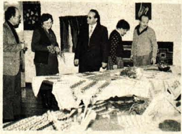
Kranj – Ne samo v krajevnih skupnostih ali v delovnih organizacijah, tokrat so se za pripravo razstave ročnih del opogumile tudi delavke kranjske skupščine. Vrsto lepih pletenin, vezenin, makramejev in drugih zanimivih ročnih del so pokazale. Razstava je bila odprta le kratak čas, samo v petek, ogledal si jo je pa seveda ves občinski moški svet.