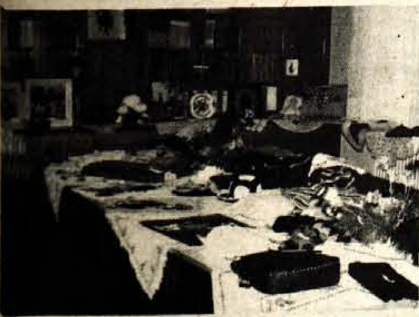
Kranj – V knjižnici kranjske Bolnišnice za porodništvo in ginekologijo so v petek, 6. marca, razstavile svoja ročna dela negovalke, babice, medicinske sestre in druge zaposlene v bolnišnici. Večina pletenin, gobov, tapiserij, otroških igračk in drugega je nastajala v preteklem letu med nočnim dežurstvom. Na predlog mladinske organizacije, da se delo spretnih rok postavi na ogled, so prav za praznik žena pripravile razstavo.