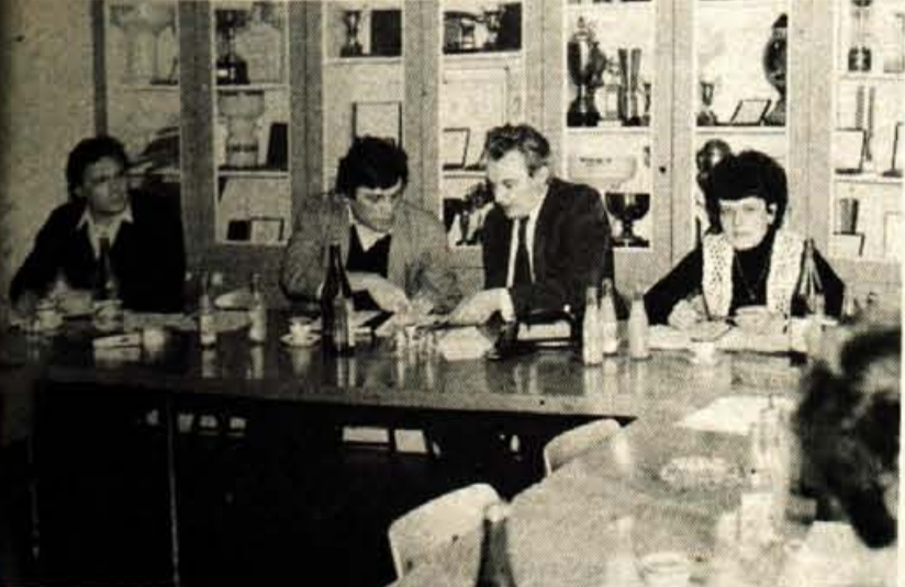
Kranj — Člani koordinacije za politični sistem predsedstva sveta zveze sindikatov Jugoslavije se te dni po vseh republikah in pokrajinskih pogovarjajo o aktualnih vprašanih samoupravljanja delavcev in nalogah zveze sindikatov. Predvsem o zborih delavcev, referendumih, predhodnih razpravah odločanju o delavskem svetu tozda, delovne organizacije, sozda, odločanju o združevanju sredstev, o delu samoupravnih delavskih kontrol, varstvu samoupravnih pravic delavcev in podobnem teče beseda. V sredo so člani koordinacije obiskali Litostraj, kranjsko Savo (na sliki) in jeseniško Železarno.

občini. Zato je izvršni svet skupščine občine, ko je v sredo med drugim razpravljal o družbenem planu, določil tudi rok 7. marec, do katerega naj družbenopolitične organizacije v občini posredujejo pripombe k predlogu družbenega plana. V predlogu družbenega plana so za razliko od osnutka na novo opredeljeni prostorski elementi družbenoekonomskega razvoja občine, sestavni del plana pa je tudi dokumentacijska osnova.