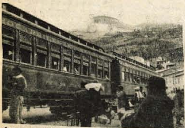
Južnoameriški vlaki so podobni onim z divjega zahoda.

Plaza de Armas se imenuje jedro vsakega starega dela mesta v andski Ameriki, kjer so nekoč španski osvajalci korakali obloženi s šlemi in meči, vsakomur v spoznanje in dokaz, čigava je oblast v deželi. Hiše so obtežene s starinskimi rezljanimi balkoni, skozi katere se da opazovati na ulice ne da bi bil opažen. Vsako leto pokopljejo nekaj ljudi, ko se črvivi zrušijo na marmorne plošče, pripelane iz Španije, ki vodijo do katedrale. Nasproti je tudi kip Bolivarju, avtokratskemu libertadorju izpod kolonialnega jarma.