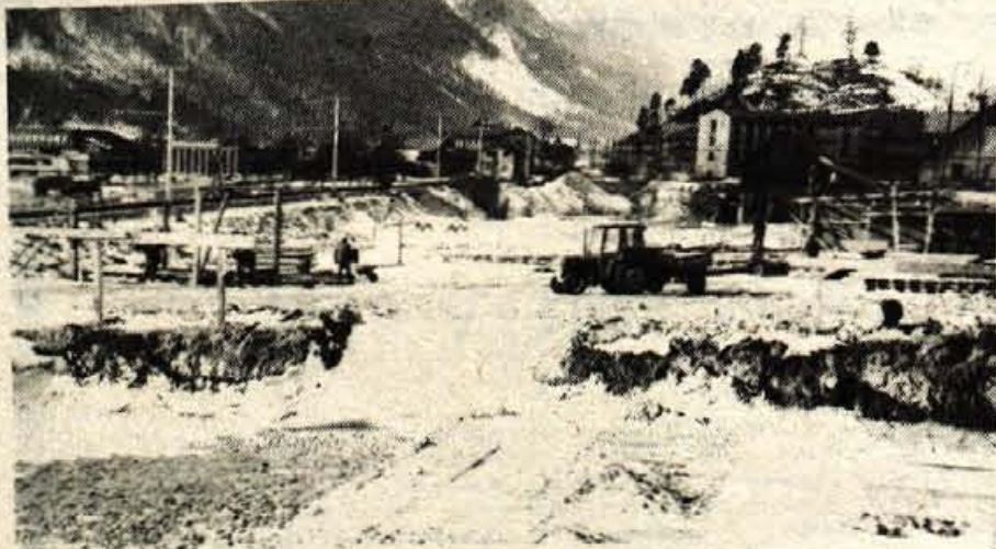
Koroška Bela – Delavci temeljne organizacije GIP Gradis na Jesenicah so pričeli graditi med domom TVD Partizan in železniško progo na Koroški Beli tri stanovanjske stolpice. Dva bodo dogradili predvidoma do konca letošnjega leta, tretjega pa prihodnjo pomlad. V vsakem bloku bo po 26 stanovanj različne velikosti, v glavnem za delavce železarne. (B. B.)