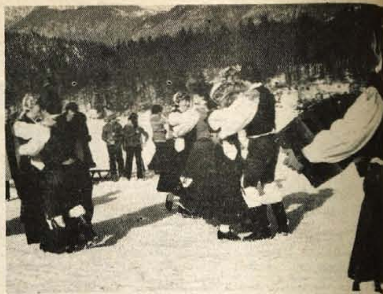
Ples na zasneženem jezeru, odlična hrana in veliko obiskovalcev, to je Gorenjska v teh sončnih dneh.

Vas, prah, psi, revščina gleda iz loncev, naravnost v prazne blatne bajte vidim, ni oken, ni vrat. Zakaj le? Mularija teče za mano, psi trgajo s prtljajnika viseče cunje, brcam, maham... Oh vodnjaku so zbrane žene. Perejo, opravljajo, ko me razločijo, cvileč vržejo vedro ob tla in pobegnejo. Dve z motikami ostaneta.