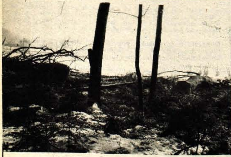
Stara bukev in hrast sta padla – njiva bo več rodila – Parcelne meje, mejna drevesa, ki so metala senco zdaj na njivo enega, zdaj drugega sosedu, so velikokrat bili in so še vir hudih sosedskih sporov, leta in leta trajajočih pravih. Vsak gospodar je po svoje ponosen, trmast in se ne da. Raje pravda...! Tudi zaradi teh dveh dreves, bukev in hrasta na »novini« na Polici pri Naklem je bilo precej hude krvi. Ko pa sta na obeh mejnih posestvih zagospodarili gospodinj, sta odločili, da se obe drevesi, bukev, ki je metala senco na zgornjo njivo in hrast, ki je oviral pridelek na spodnji njivi, da ga je bilo le za seme, posekata. Njivi bosta odslej polni sonca, pri sosedah pa doma prijateljstvo in razumevanje. Da bi bilo povsod tako! – Foto: D. Dolenc