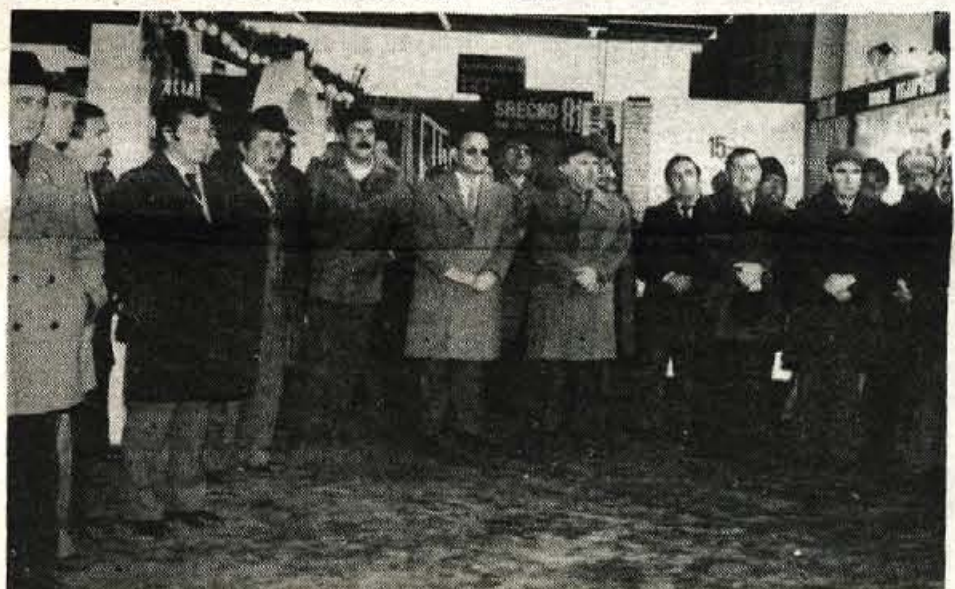
Številni gostje so se udeležili slovesne otvoritve sejma, ki je v prvih dneh dosegel lep obisk. Sedanja sejemski prireditelj bo odprta do 21. decembra

Gorenjski sejem. Delovna organizacija Gorenjski sejem dviguje organizacijsko in vsebinsko raven sejemskih prireditev, pri tem pa ne sme biti osamljena. Družba, predvsem pa združeno delo kranjske občine in Gorenjske, mora pri tem sodelovati in dvigovati kvaliteto kranjskih sejmov.