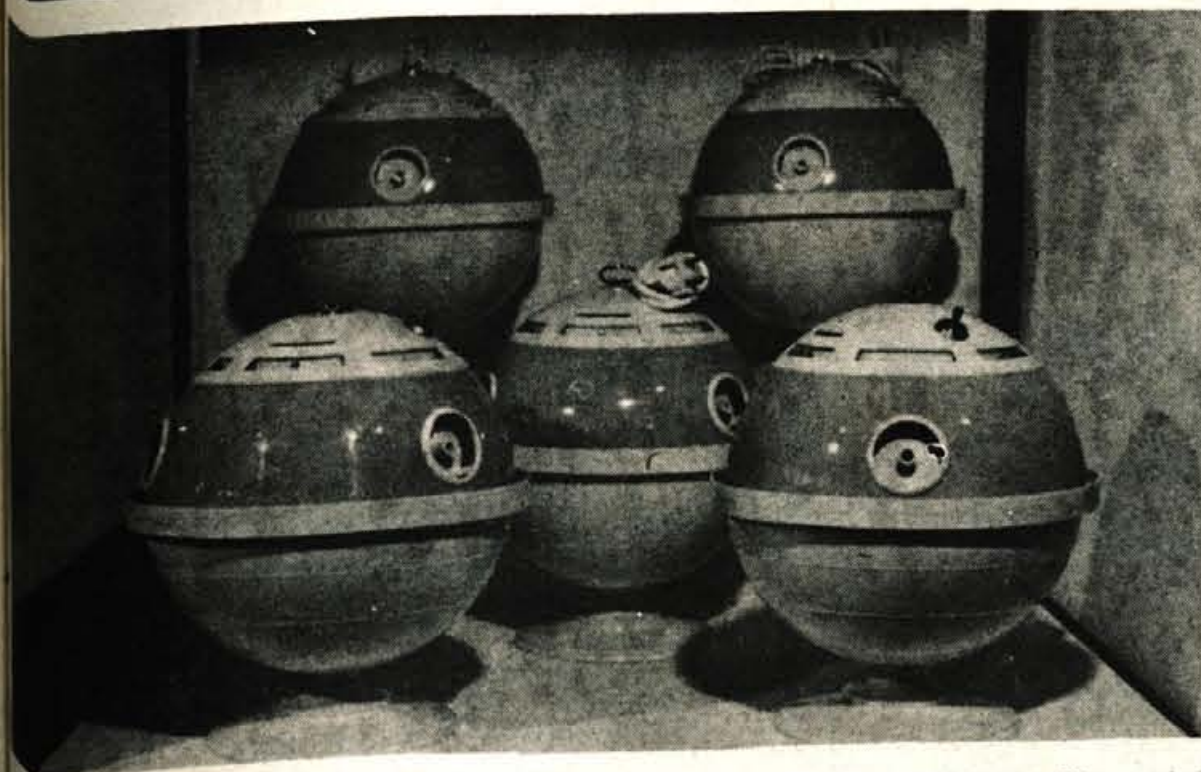
Razprodaja: vlažilcev zraka

Vse dni bo na sejmu naš svetovalec za opremo kuhinjskega prostora, kateremu boste lahko osebno zaupali svoje želje in potrebe ali ga poklicali po telefonu: 28-590