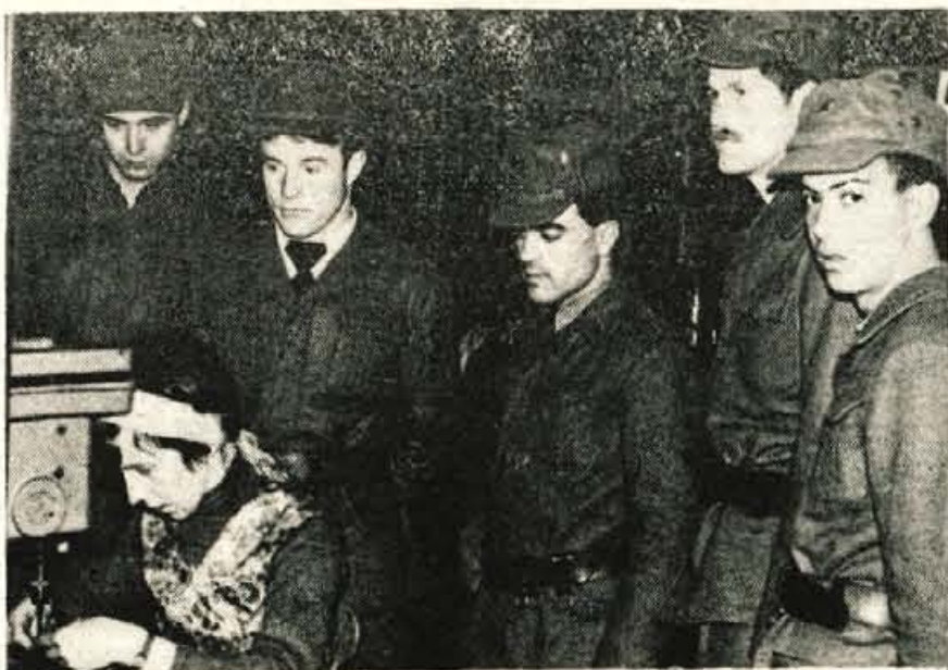
Sodelovanje z mladimi vojaki - Mladi iz osnovne organizacije ZSMS Iskra-mehanizmi Lipnica in vojniki vojašnice Andrej Zvan-Boris so znova dokazali, kako plodno je lahko sodelovanje med mladimi iz delovnih organizacij in mladimi pripadniki JLA. Minulo sredo so vojaki obiskali lipniški kolektiv in se z mladimi pogovarjali predvsem o nadaljnjem sodelovanju med obema osnovnima organizacijama mladih, obravnavali pa tudi probleme. Vojaki so si ogledali proizvodne prostore in se seznanili s programom dela temeljne organizacije. Popoldne so se pomerili v košarki ter si ogledali tudi Kovaški muzej v Kropi.

Medtem ko je tovarna traktorjev v štorski železarni v petih letih prispodarila za 172 milijonov dinarjev izgub, jih je imela v letošnjih prvih devetih mesecih 49 milijonov dinarjev. Glavni vzroki izgub so nenehne dražnje surovin in reprodukcijskega materiala ter zadrževane cene izdelkov. Cene repromateriala in sestavnih delov so se letos povečale od 18 do 83 odstotkov, cene traktorjev pa le za nekaj odstotkov.