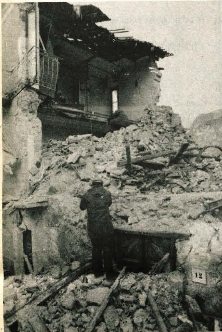
Stare hiše v južnoitalijanskem Calabrittu niso zdržale potresnih sunkov; ni še znano koliko prebivalcev je našlo smrt pod ruševinami.

Le nekaj ur po zaprosilu italijanskih oblasti je Republiški štab za civilno zaščito SR Slovenije poslal v južno Italijo ekipo 18 strokovnjakov geofonistov za odkrivanje preživelih v ruševinah. V ekipi so bili strokovnjaki člani združenega odreda civilne zaščite v Jesenic, Radovljici, Kranju, Ljubljani in Mariboru. V dveh dneh in pol naporenega dela so odkrili v ruševinah še živega 65-letnega starca v povsem porušenem Calabrittu. Sicer pa so se tako naši strokovnjaki kot tudi francoski in švicarski strinjali, da so lahko po tednu dni po potresu pod ruševinami le še mrtvi. Večino prebivalcev tega južnoitalijanskega mesteca je zasulo na ulici.