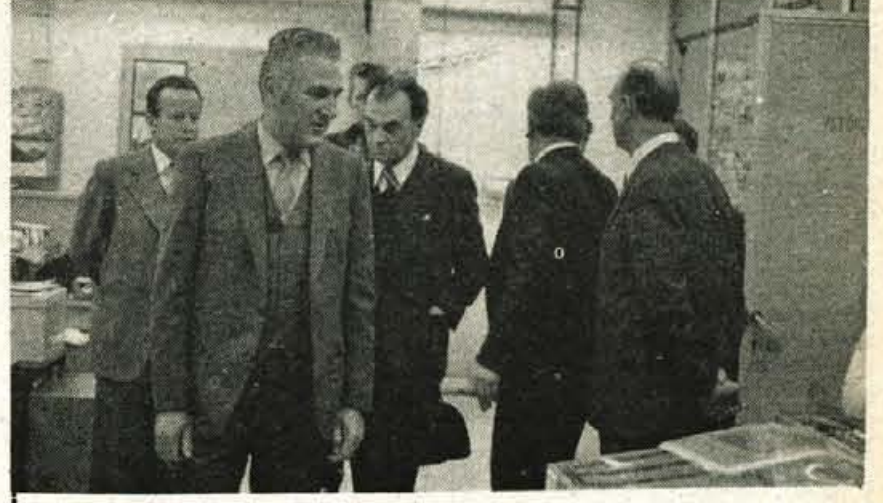
Kranj — 4. in 5. decembra se je na krajšem delovnem dopustu zadrževal na Gorenjskem Aleksander Lilov, član politbiroja in sekretar CK KP Bolgarije. Obiskal je tovarno športnega orodja Elan v Begunjah. Vezenine Bled ter Iskro tozd Telekomunikacije v Kranju. V vseh delovnih organizacijah so ga seznanili s sistemom delavskega samoupravljanja, s proizvodnimi programi in možnostmi sodelovanja med našimi in bolgarskimi tovrstnimi delovnimi organizacijami. Na sliki: na obisku v Iskri.