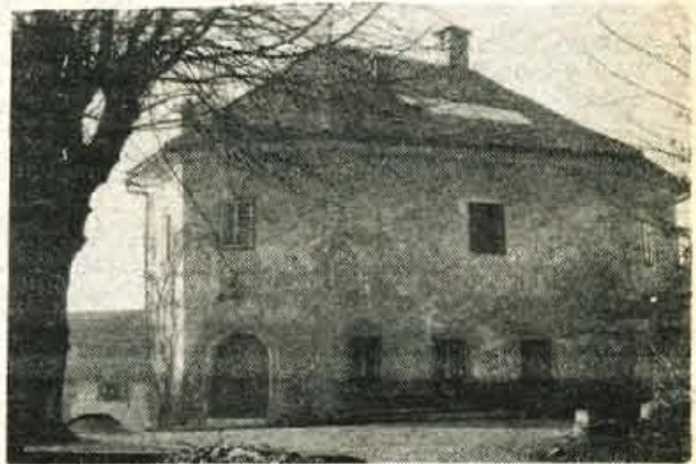
Kljubovalni stolp (Trutzthurn) – sedanji Smoletov gradič na kamniških Zalah.

No, tudi na trdna tla bo treba stopiti. Kajti Kamnik niso le slikoviti pejzaži, slavna zgodovina, številne cerkve in gradovi pa lepe hiše in zaslužni velmože – Kamnik je tudi veliko delovišče, industrijsko središče, ki tisočerm meščanom in okoličanom reže dober vsakdanji kruh.