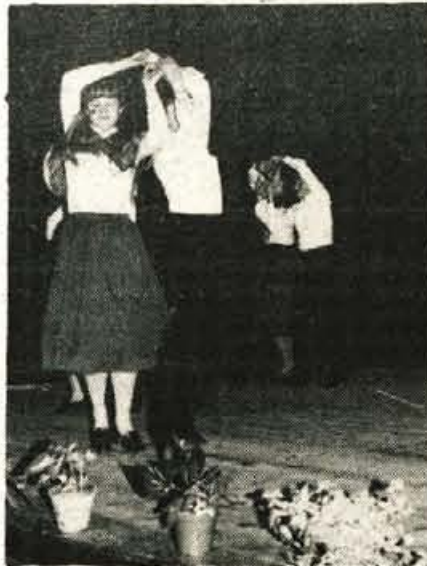
Mladi folkloristi kulturno umetniškega društva krajevne skupnosti Moste.