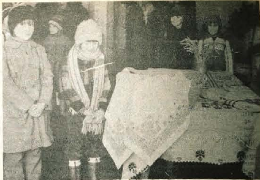
Begunje — Vajeni smo že odličnih razstav ročnih del, ki jih pripravljajo od časa do časa Psihiatrična bolnica v Begunjah. Ta, ki so jo pa pripravili v sklopu letošnjega praznovanja dneva republike, pa menda presega vse dosedanje. V na novo preurejeni večnamenski dvorani bolnice so prikazali čudovite tapisrije, vezene prte, moderne in vedno lepem narodnem vezu, domiselne igrate iz filca, drobne pletenine in še mnogo drugega lepega in zanimivega. V tednu dni so jo obiskale številne skupine z Gorenjske in iz Slovenije ter posamezniki. Prav zaradi izrednega zanimanja bodo razstavo podaljšali še do vključno četrta, 11. decembra. — Foto: D. Dolenc

Konec oktobra je bil že oblikovan program letošnjega praznovanja. Enotno bo, brez obdarovanj otrok. Vsaka prireditev mora biti obvezno združena s srečanjem mladih z Dedkom Mrazom. Po krajevnih skupnostih pripravljajo za najmlajše čajanke, v prireditve pa morajo biti obvezno vključeni vsi predšolski otroci, ne glede, ali so vključeni v vrtnice ali ne. V kranjski občini, tako se že ravna tudi v drugih gorenj-