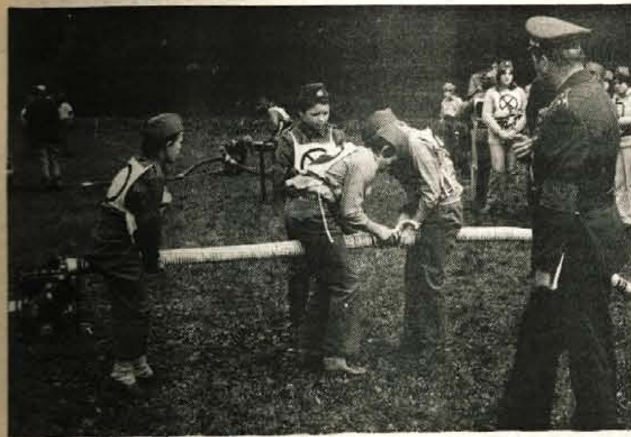
Pionirji so pokazali na tekmovanju v Naklem zadovoljivo znanje - Foto: J. Zaplotnik