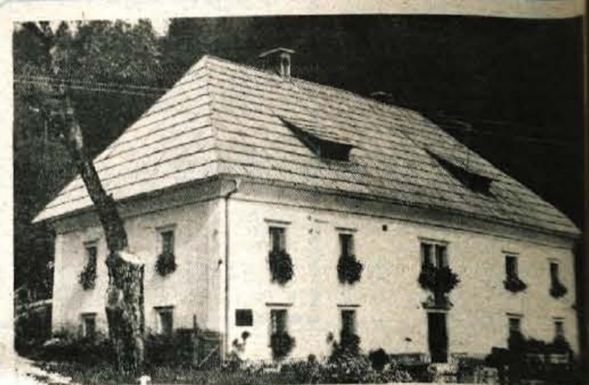
Jeseniška železarna naj bi v Zoisovi graščini uredila muzej, stanovanja pa naj bi se preselili v nov stanovanjski blok, ki ga bodo zgradili v Stari Fužini.

ali krajevni samoprispevek in tako tudi sami pomagali pri izgradnji imernih prostorov. Danes so seje sveta in drugih organov krajevne upnosti in družbenopolitičnih organizacij v sila neprimernem objektu, kjer so morali strop podpreti, v vsaj za silo drži, sestanki s števil-