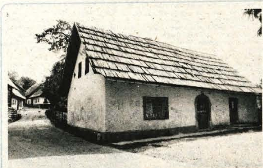
Krajevna skupnost ima prostore v starem, dotrajanem objektu, kjer se je zadrževati že nevarno...

Stara Fužina v Bohinju – Krajevna skupnost Stara Fužina, ki ljučuje poleg Stare Fužine še vas udor, danes šteje okoli 700 prebivalcev. Krajevna skupnost Stara Fužina je med dvajsetimi krajevnimi upnostmi v občini ena redkih, ki ma primernih prostorov za delo ajevne skupnosti in številnih orgazacij in društev, ki v krajevni upnosti aktivno delujejo. Razen ga kot izrazito turistična krajevna skupnost – saj ima največ zabnih turističnih sob v Sloveniji sploh – nima nobene dvorane, er bi bile lahko turistične, kulurne in druge prireditve. Dolga leta so se krajanji trudili in izadevali, da bi vendarle v Stari Fužini postavili vsaj majhen kulturni dom ali kulturno in družbeno edišče, vendar jim ni uspelo. Nandje so se odločili, da bodo razpi-