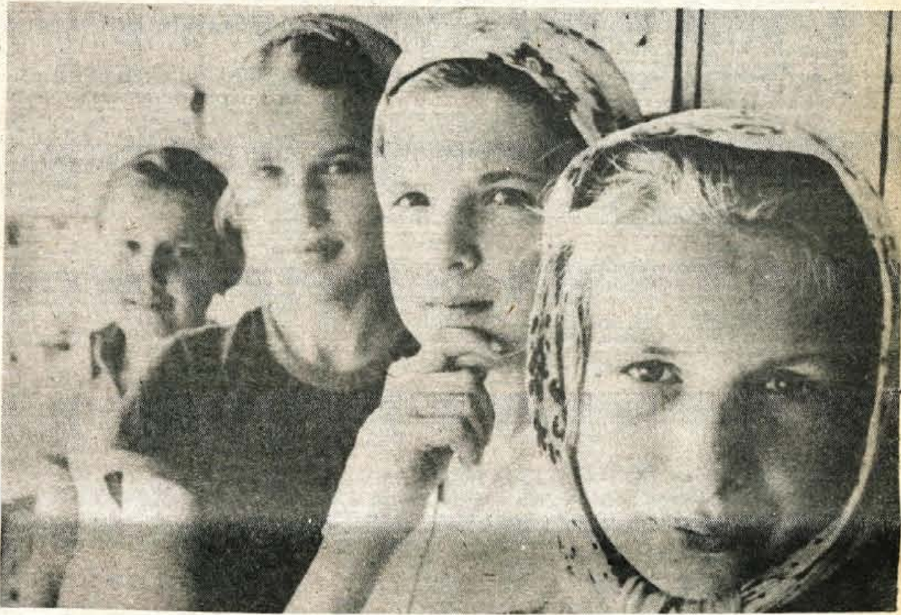
Samo štiri razrede. Bistri pogledi deklic povedo dovolj...

»Ste jo spodbujali k učenju?« »Ma, kako, če pa ne vem, kaj piše v tistih knjigah. Poslala bi jo jaz in moj človek, a takole...« »Kaj? Je posredni možitev?«