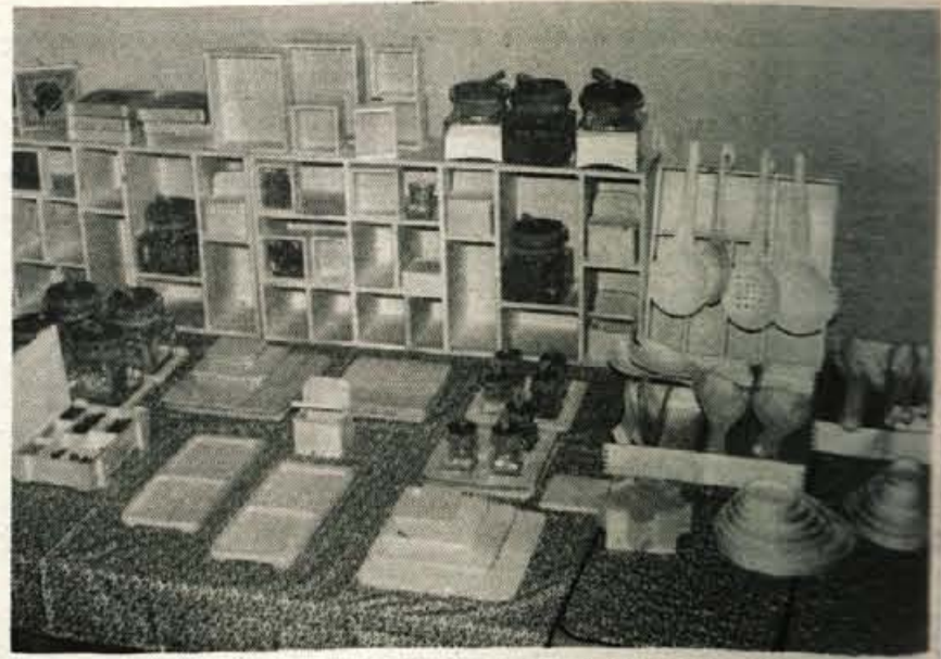
Slovenjgraška razstava je pokazala, da imamo tudi izdelke, ki ljudsko izročilo prelivajo v naš sodobni vsakdan.

Toda sejem vendarle ni bil pravi sejem, kajti kupcev in prodajalcev ni bilo, vsi skupaj smo bili le gledalci. Razstava je pač razstava. Takšna postavitev nas ne bi pač prav nič motila, če se ne bi soočili z morda