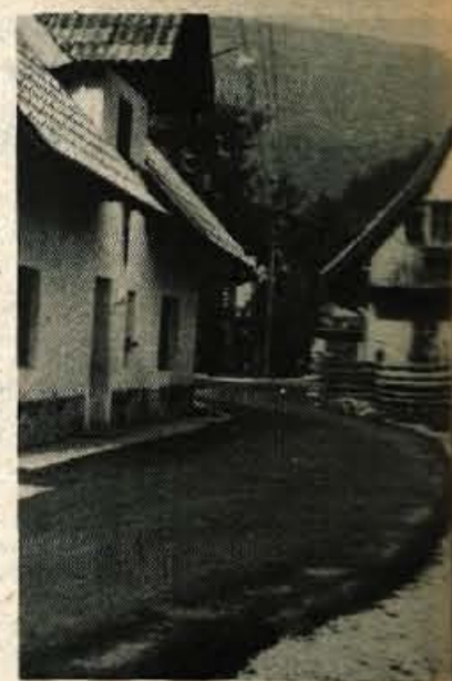
V krajevni skupnosti Stara Fužina so posamezna gospodinjstva prispevala po 4.000 dinarjev za asfalt.

dobiti toplega obroka, saj gostinskih lokalov – razen bifeja pri trgovini – ni. Vas je izredno lepo urejena in vsako leto je viden napredek. Tako so letos krajanji prispevali še za asfalt in so tako ceste domala vse asfaltirane. Asfalta so položili na 2500 kvadratnih metrov površine, posamezna gospodinjstva pa so prispevala od 3.700 do 4.000 dinarjev. Krajanji Stare Fužine so se torej ponovno izkazali in tudi za asfalt namenili del lastnih sredstev. Vas dobiva čisto drugačno podobo, resda tudi deloma iz združenih sredstev občinskih samoupravnih interesnih skupnosti, a vendarle je prostovoljni delež krajanov še vedno visok. Prav tako kot bo visok njihov delež tudi pri družbenem centru, ki naj bi ga začeli graditi že prihodnje leto. Krajevna skupnost seveda ni tudi brez številnih problemov, ki jih namerava postopoma razrešiti v prihodnjih letih. Radi bi dokončno in za vedno zaščitili obalo bohinjskega jezera, ki jo nekateri neodgovorni krajanji še naprej uničujejo tako, da z obrežja jemljejo pesek. Prav tako naj bi uredili vso vas, ne le posamezna območja. Ob spomeniško zaščiteni cerkvi sv. Pavla v Stari Fužini je še vedno veliko navlake, predvsem gradbenega materiala, ki kazi okolico. Lastniki naj bi material odpeljali na druga mesta, kajti pogled s ceste na spomeniško zaščiten objekt ni prav nič privlačen zaradi neodgovornih posameznikov, ki odložijo material kamorkoli se jim že zdi. V Stari Fužini torej ne mirujejo in so stalno aktivni. Že neštetokrat,