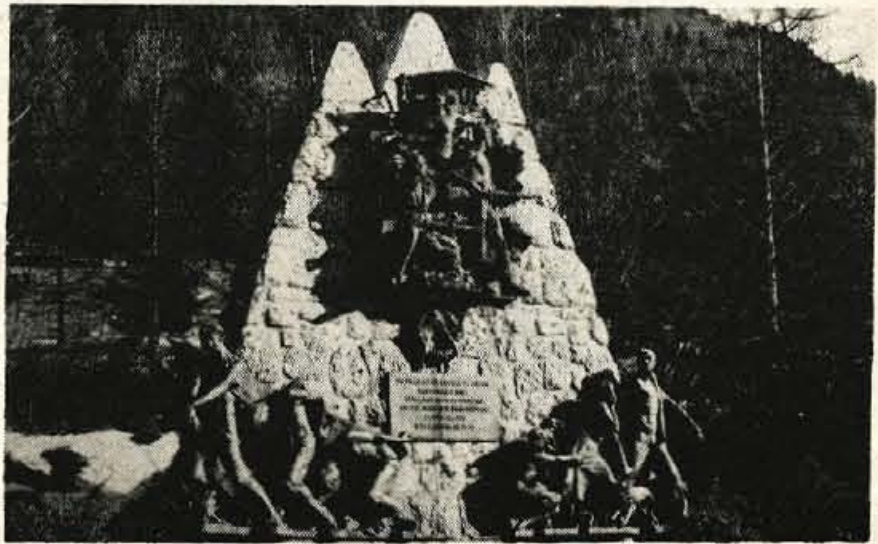
Pomnik NOB na Belem polju pri Hrušici

Po gmajnah, ob cestah, za žicami smo padli v smrt streljani, ubijani, izmučeni hlapci Jerneji in Simni Sirotniki, za čas, za vas in za ljudi, ki jih še ni.