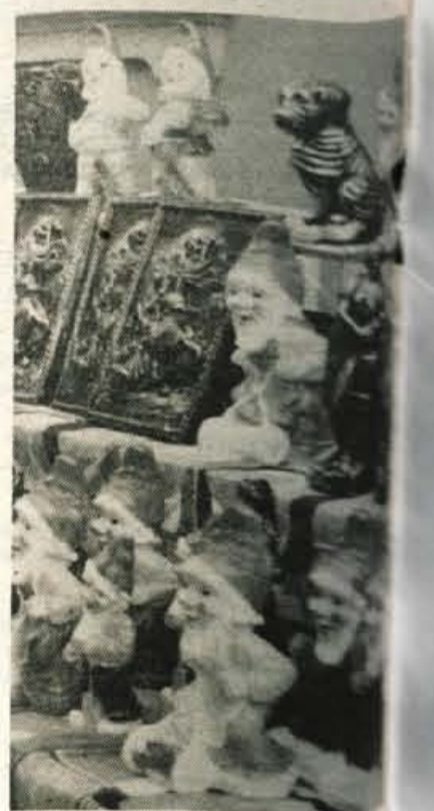
Kaže, da bo neokusno, kičasto, ki nima nič skupnega z ljudskim izročilom in ustvarjalnostjo težko izriniti iz našega vsakdana. Ne polnih tristo metrov od Umetnostnega paviljona se je ponujala po sugodnih or-nah.

kov suhe robe smo našli na polnih stojnicah pred paviljonom. Ne da. Ne rečemo da vse, saj so bile razstavljeni izdelki prave dragocenosti in redki predmeti, toda nekaj bi izdelovalci lahko postavili. Tako smo odhajali iz Slovenj Gradca praznih rok in neizpolnjeni bila želja, da bi kupili majhno darilo za domače, da bi doma pokazali, da je pri nas moč kupiti lepega.