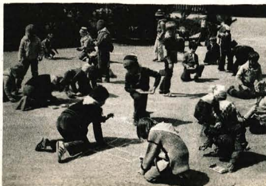
Za naše otroke res naredimo dovolj?

Njen priimek in ime napišite na dopisnico ter jo do 27. oktobra pošljite na naslov: CP Glas Kranj, 64000 Kranj, Moše Pijadeja 1 - nagradna uganka.