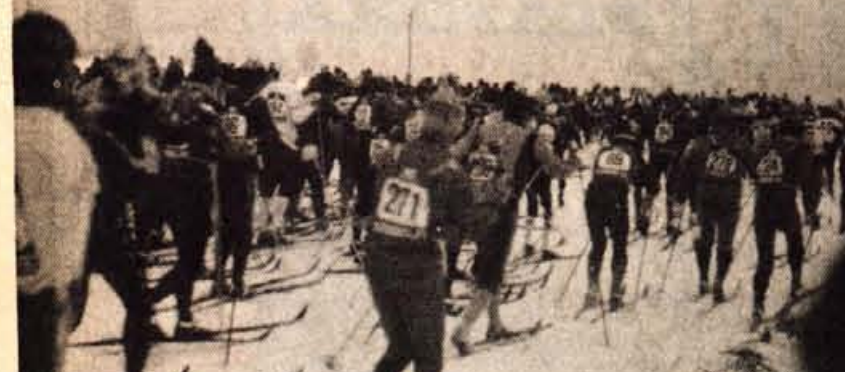
Na odlično organiziranem prvem tekaškem maratonu v Cerkljah je nastopilo nad petsto smučarskih tekačev.

JENESICE - V lanskem decembru in prvi polovici letošnjega januarja je bila na Jesenicah in v Kranju medobčinska liga ekipnega prvenstva Gorenjske v kegljanju na asfaltu. Nastopalo je osem moških ekip in dve ženski. Med moškimi: Triglav, Ljubelj, Kranska gora, Kravec, Jesenice, Sava, Bled in Simon Jenko, med ženskimi pa Kravec in Jesenice.