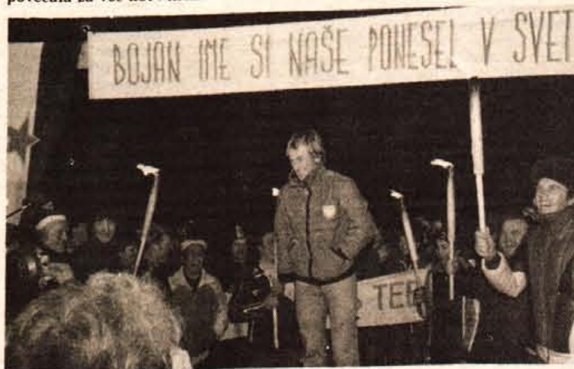
KRAJANI ZVIRČ IN TRŽIČANI POZDRAVILI SVOJEGA JUNAKA – Po uspehu v Wengnu in Chamonixu, ko je naš najuspešnejši alpski smučar Bojan Križaj osvojil v slalomu prvo in drugo mesto, je Križaj spet doma. Kot že mnogokrat doslej so ga spet pričakali zvesti ljubitelji smučanja na domu v Zvirčah. Krajanje Zvirč in Tržičani so mu kljub pozni uri pripravili pristrčno dobrodošlico. (dh)