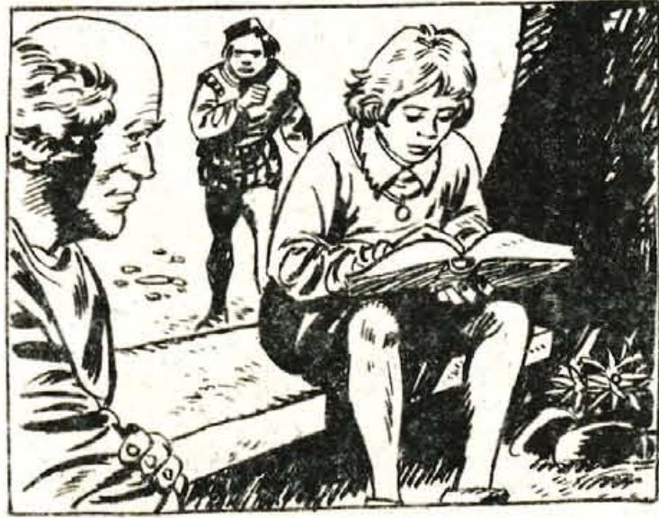
32. Petru ne bi bilo težko spraviti dečka s sveta, a si ni upal tega storiti, ker je dobro vedel, da bi se mu po takem dejanju bilo bati brata in vse poštene sosesčine, ki ne bi trpela moralca med seboj. Skrival pa ga tudi ne bi mogel, kajti menih Bernard je bil skoraj vedno pri dečku. Tudi služničad in sosedni plemiči so malega Kozjaka ljubili in pričakovali je bilo, da bi se vzdignil zoper tistega, ki bi kozjaškemu dediču le požugal s hudim namenom...