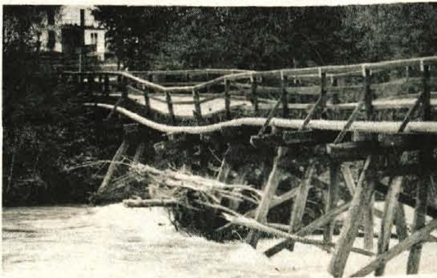
Na območju radovljjske občine je voda hudo poškodovala več lesenih mostov na Savi, tako v Globokem in v Otočah. Med nosilne stebre mostov se je nabiralo vejevje in drug odpadni les, tako, da je bil most v Otočah precej v nevarnosti. Da ne bi bila škoda še večja, so pomagali pripadniki štaba civilne zaščite, delavci Iskre v Otočah in gasilci.

Zdaj bo posebna komisija natančno ugotovila škodo, ki je nastala zaradi hudega deževja. Samoupravna interesna komunalna skupnost bo morala poskrbeti za čimprejšnje popravilo lesenih mostov na Savi, inšpekcijska služba pa bo nadzorovala obalna in hudourniška področja. D. Sedej