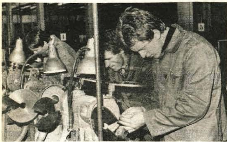
Srečanje ni imelo tekmovalnega značaja, pa kljub temu je športni duh za dobre dve uri prevzel kovinarje, ki so merili spretnosti v iskrški Orodjarini.