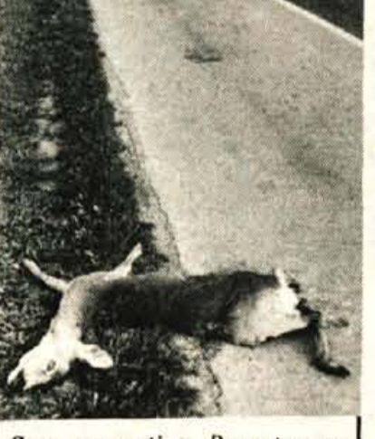
Srna na cesti - Prometna gorenjska magistrala terja tudi takšne žrtve - v torek je obležala ob cesti na Črnicu mlada srnica.