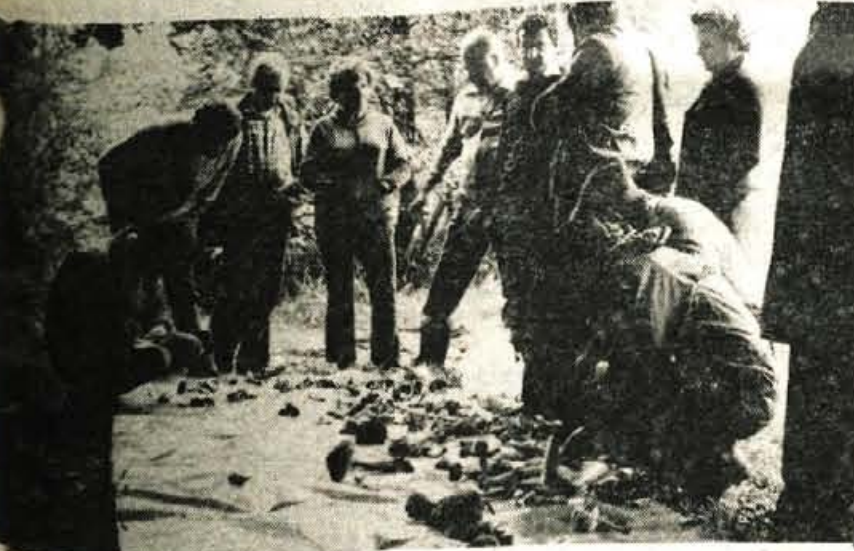
V naših gozdovih raste ogromno najrazličnejših vrst gob. Veliko je še neznan. Samo koprenk je čez 400 vrst, pravijo gobarji. Zato je potrebna pri determinaciji velika natančnost. Najlažje jih je prepoznati, na pri determinaciji velika natančnost. Najlažje jih je prepoznati, če vas če je več gobarjev skupaj. Takrat se tudi največ lahko naučijo. Če vas zanima: kranjski gobarji se dobivajo vsak ponedeljek, ob 18. uri, v njihovih prostorih v Tomšičevi ulici 19 v Kranju. Jubilejna deseta gobarjska razstava pa bo tudi na letošnjem jesenskem Gorenjskem sejmu, ki ga bodo odprli v petek, 17. oktobra. — D. D.

Delavci in delavci zabrezniške Planike so po obhodu Titove grobnice na Dedinju obiskali še nekatere druge zanimivosti našega glavnega mesta. Med drugim so si ogledali muzeje 25. maj, grob neznanega junaka na Avali in Kalemegdan. J. Rabič