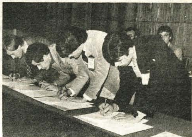
Predstavniki občinskih konferenc ZSMS so na šestem srečanju v Kranju podpisali dogovor o sodelovanju mladih iz prijateljskih mest. Dogovor obvezuje mlade za vrsto skupnih manifestacij.