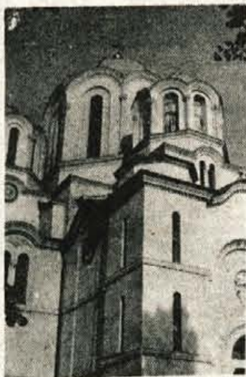
Oplenac z grobnico srbskih kraljev je pogost cilj slovenskih izletnikov, ki so bili ali se odpravljajo v Srbijo.

VAM BOMO PREDSTAVILI ALLEGHE IN PASSO TONALE.