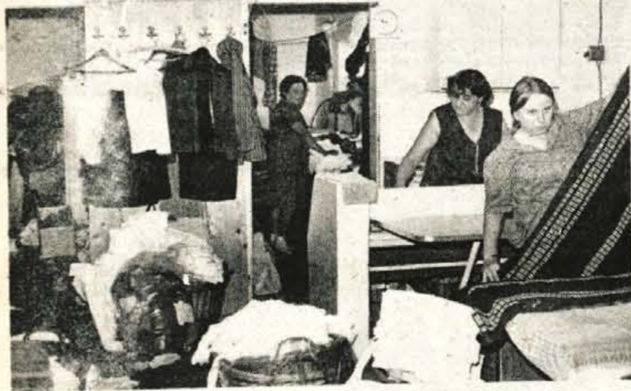
Pralnica straziške Usluga spominja prej na skladišče kot na pralnico. Pa vendar iz rok teh peric in likalnic prevzemajo stranke vzorno oprano, zlikano in tudi poškito perilo. Delo je dobro opravljeno, toda v kakšnih razmerah in za kakšno ceno...