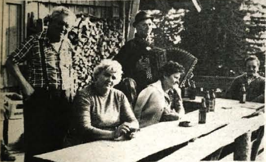
Veselo je bilo to poletje pri Ribnikarjevi Nadi in Francetu na Tegoški planini pod Kofcami. Vsak dan je bil doživetje . . .

V Jasno Poljano jo je Petruška primahal proti večeru, za kak obisk vsekakor prepozno. Zato je prenočil na senu pri bližnjem kmetu Tarasu Vukanovu. Zjutraj je šel h graščini in sedel pod »lipo siromakov«. Tam so že od rane zore posedali možaki in berači, da bi slišali tolažilno besedo in dobili pomoč od čudaškega grofa.