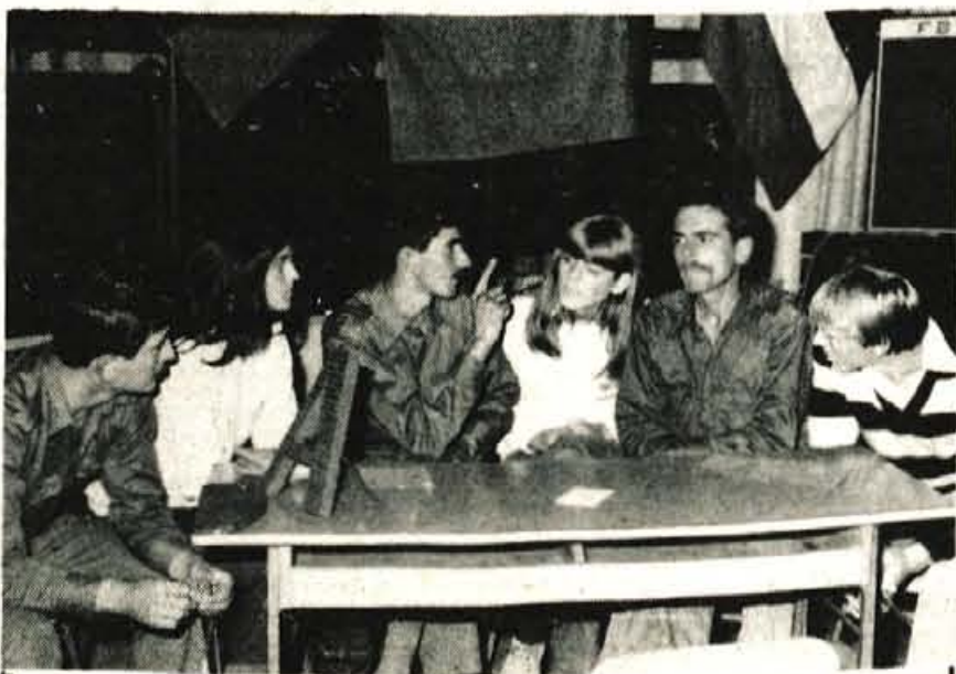
V soboto je bilo v osnovni šoli Peter Kavčič v Skofji Loki občinsko kviz tekmovanje »Mladost v pesmi, besedi in spretnosti«. Zmagala je A ekipa, v kateri so bili vojak garnizije Jožeta Gregorčiča in učenci gimnazije Borisa Zihlerla.

Sistemska rešitev je torej potrebna, vendar precej vprašljiva. Programi interesnih skupnosti za slednje srednjeročno obdobje precej ambiciozni, kot je znano, se vselej začnejo klestiti pri bah. Zato bo ob zeleniškem domu potrebno razčleniti nujnost vlaganja denarja za obnavljanje planinskih domov. In kot se domneva Kompassa na Ljubelju odločilo prevzemu doma na Zelenici v upravljanje, tako se delavci v Tržičem združenem delu odločijo, da bodo prepustili domove naslednjemu razpadanju. Resnična škoda bila, če bi rešitev obeh problemov običala v zraku.