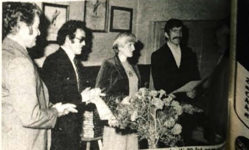
V leški Tovarni Verig so minuli petek slovesno praznovali 30 let samostojnega upravljanja in prvim članom prvega delavskega sveta podelili priznanja.