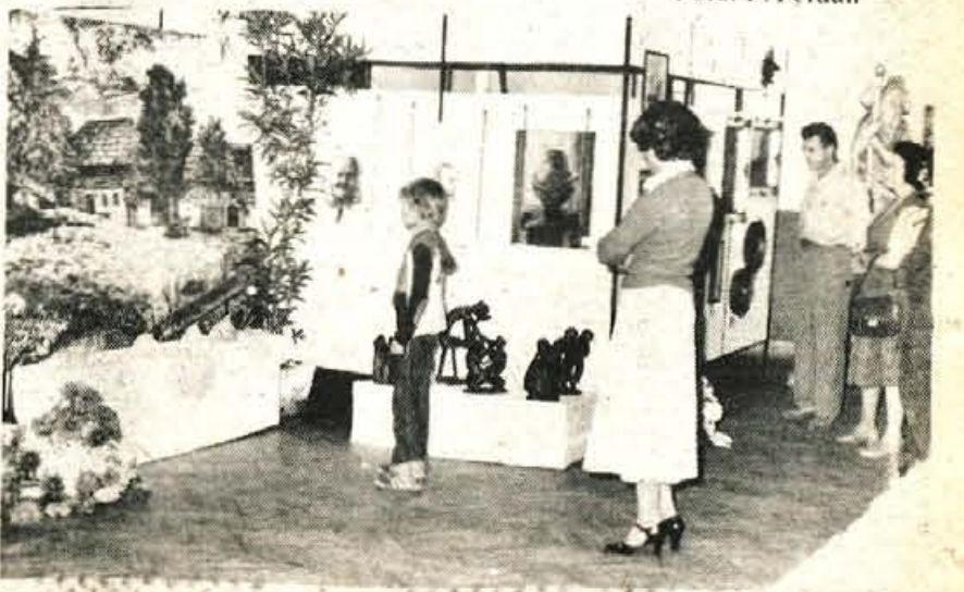
Razstava ročnih del je med krajanji vzbudila veliko zanimanja.