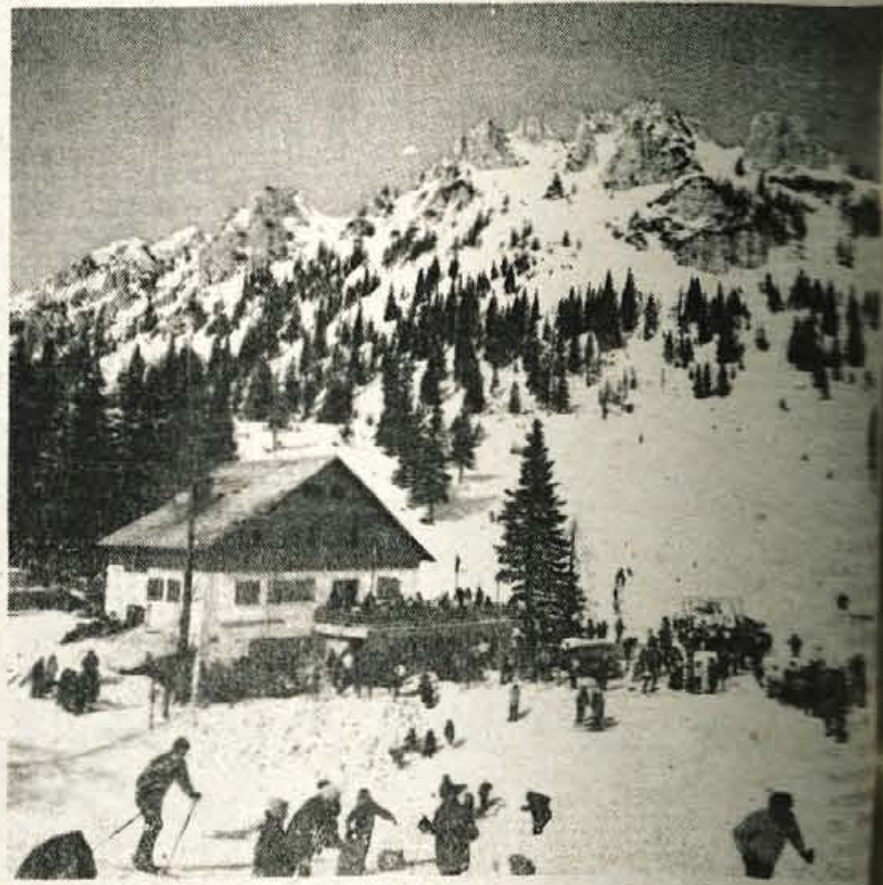
Planinski dom na Zelenici