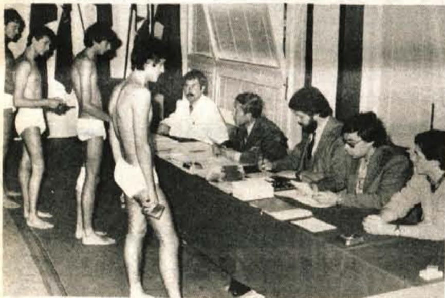
Med delom naborne komisije v Kranju