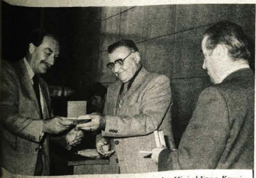
Kranj — V petek, 26. septembra, so bile na skupščini občine v Kranju razdeljene zlate plakete in brošure »Porezen 35«. Okrog petdeset borcev Gorenjskega vojnega področja, ki so preživeli Porezen, jim je dobilo, dobile so jih pa tudi organizacije in posamezniki, ki so sodelovali pri številnih spominskih pohodih na Porezen; med organizacijami je tudi Skupščina občine Kranj, občinska organizacija ZZB Kranj, Domicilni odbor Prešernove brigade, Ljubljanska banka, poslovna enota Kranj, časopis Glas, Uprava javne varnosti Kranj, Občinski sindikalni svet Kranj in Planinsko društvo Kranj.

GLASILO SOCIALISTIČNE ZVEZE DELOVNEGA LJUDSTVA ZA GORENJSKO