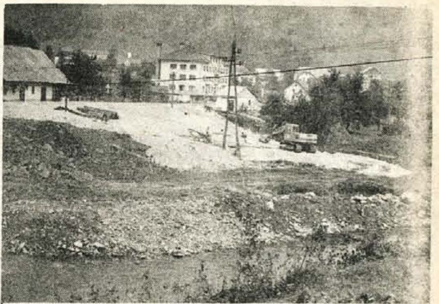
Na Trebiji cesta čez most zavije proti Žirem. Prav ta most pa predstavlja vedno večjo oviro zlasti za tovorni promet. Večji tovornjaki in kontejnerji morajo voziti do Žirov prek Logatca in Rovt, kar je veliko dalj in pa seveda dražje. Zato se žirovske delovne organizacije že več let prizadevajo za gradnjo novega mostu na Trebiji. Pred nekaj dnevi so se dela začela in prihodnje leto bo omenjena ovira odpravljena.