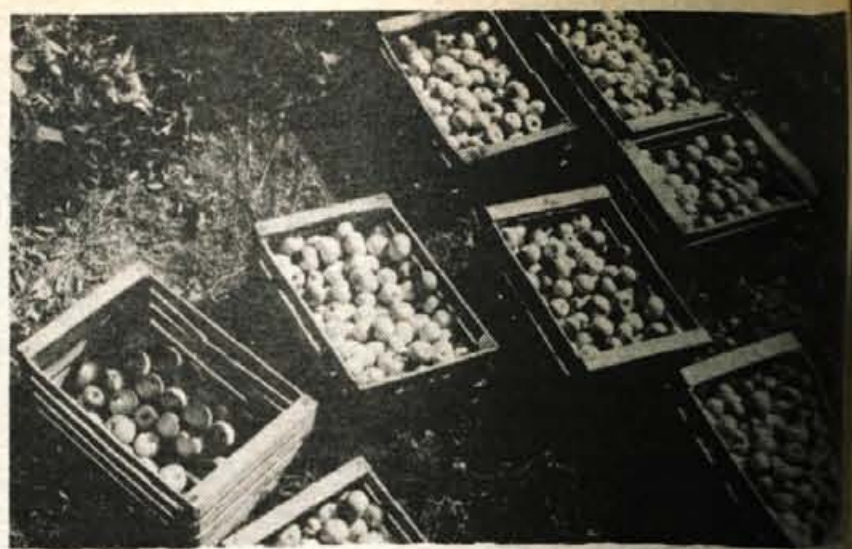
Konec prejšnjega tedna so v nasadu Resje pri Podvinu že začeli z jesenske sorte jabolok, kasneje v oktobru pa so na vrsti zimske sorte.