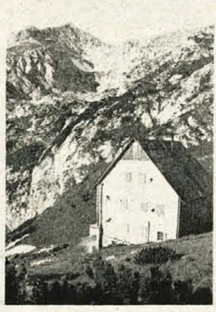
Cojzovo kočo na Kokrškem sedlu - v ozadju Grintavec - že drugo leto oskrbujejo s prenovljeno tovorno žičnico.

Kamniško planinsko društvo je bilo ustanovljeno leta 1893, torej na začetku naše planinske organizacije. Danes ima 1.400 članov. Pred šestimi leti se je znašlo pred skorajda nemogočo nalogo. Obe koči in stari leseni vzpenjači sta klicali po pre-