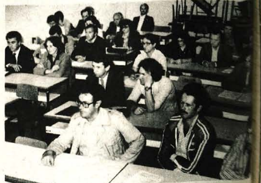
Kranj — V sredo so gorenjski inženirji organizacije dela ustanovili svoje društvo. Prvega občnega zbora se je udeležilo blizu trideset inženirjev, ki so izvolili organe društva, sprejeli samoupravne akcije in program dela. Med drugim so se dogovorili, da bodo društvo organizacijsko in številčno krepili, prirejali izobraževalne akcije in strokovne ekskurzije ter prek zveze inženirjev organizacije dela sodelovali s centrom za funkcionalno izobraževanje in svetovanje pri Visoki šoli za organizacijo dela in z založbo Moderna organizacija.