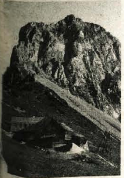
Kamniška koča na Kamniškem sedlu - v ozadju strma stena Planjave - je letos dobila prizidek, do nje pa je stekla nova tovorna žičnica.

Prav po planinsko, bi lahko dejali, brez velikega hrupa in slavlja, so kamniški planinci v začetku septembra odprli prizidek h Kamniški koči in dokončali prenovbo tovarne žičnice na Kamniško sedlo. Kamniško kočo na 1884 metrih, v prostorni zasedbi grebena med Brano in Planjavo, so zgradili leta 1906. Odtlej je bila večkrat popravljena, zvečana. Zadnja prizadevanja za posodobitev Kamniške koče segajo v leto 1974. ko