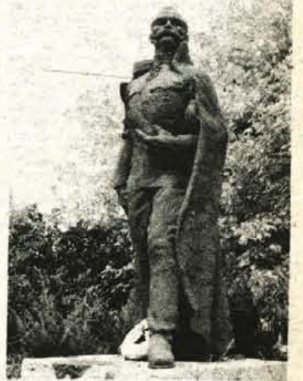
Spomenik generalu Rudolfu Maistru v Kamniku

Svojemu rojaku je Kamnik že pred leti postavil spomenik. Sicer ne prav lep, niti močilen ne — četudi je postava bro-