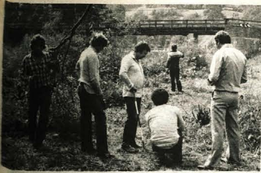
V začetku tedna so se začela pripravljala dela pri gradnji novega mostu na Trebju. Poleg ozke ceste med Fužinami in Selom je ta most ena največjih zaprek pri prometu za žiri. Konežnerski promet morajo preusmerjati prek Logatca in Rovi, kar prinaša žirovskemu gospodarstvu večje stroške.