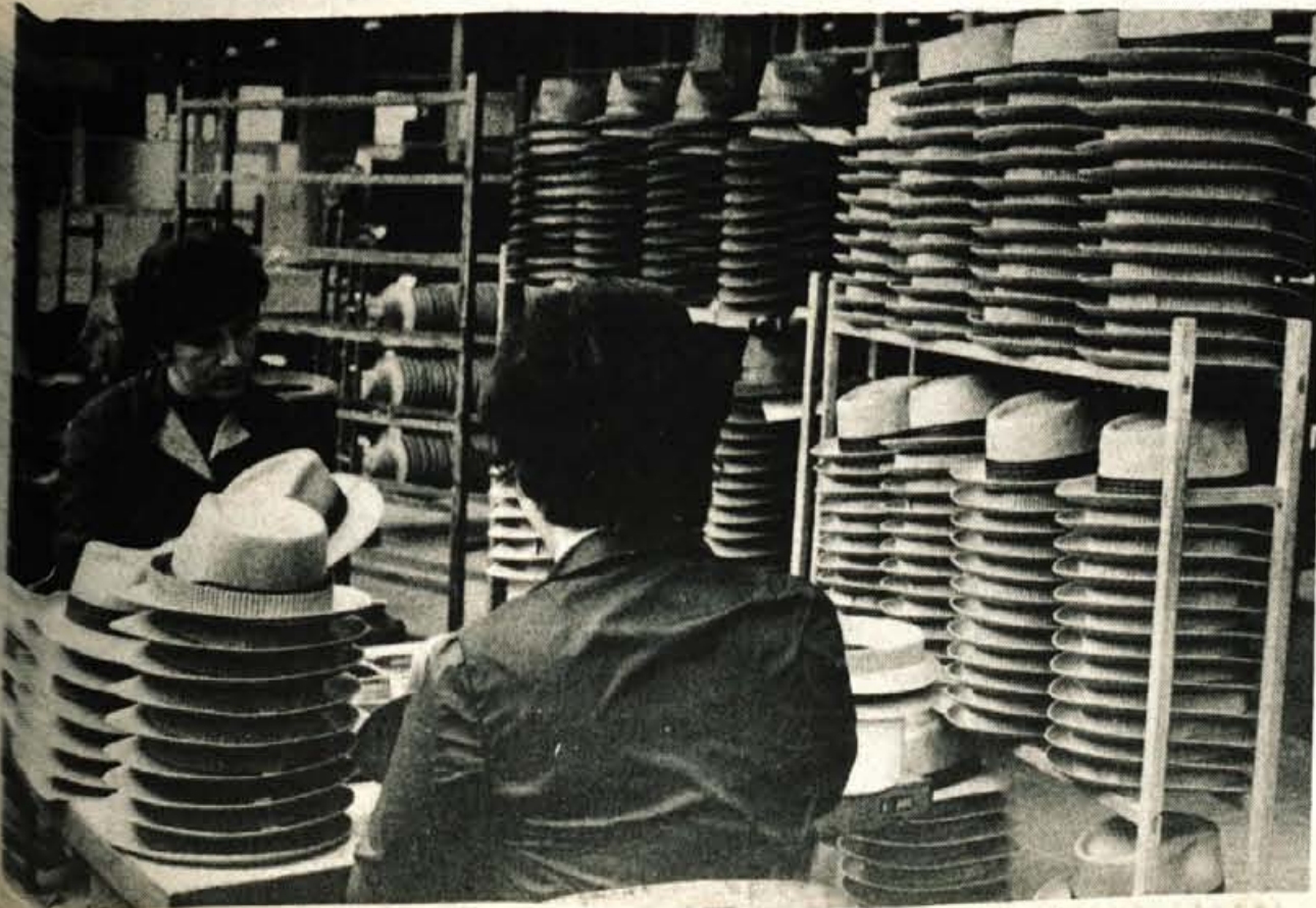
Saj je dosegel izredne izvozne rezultate.