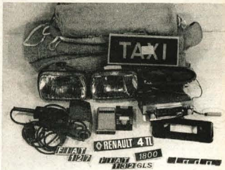
Zbirka rezervnih delov – Na UJV Kranj hranijo še vrsto predmetov zaseženih pri fantih, ki so do srede avgusta v Kranju in okolici praznili avtomobile; UJV uabi lastnike predmetov (več avtomobilskih radijskih aparatov, prevleke, žarometi, itd.) da jih, če jih prepoznajo, pridejo prevzet.