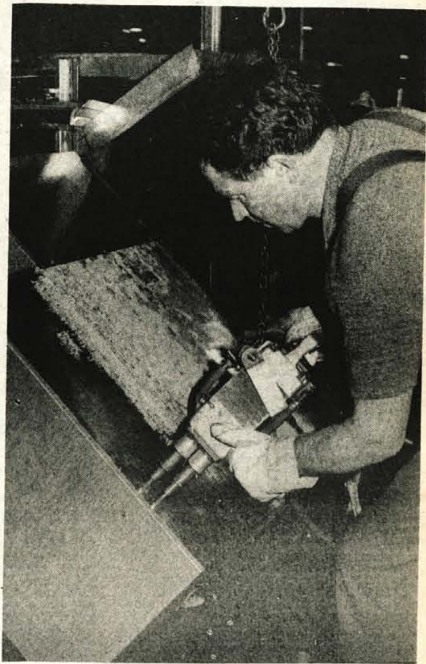
V LTH so bili v prvem polletju pri obsegu proizvodnje nekoliko pod planom. Vzrok je v zastoji proizvodnje zaradi selitve v nove proizvodne prostore.