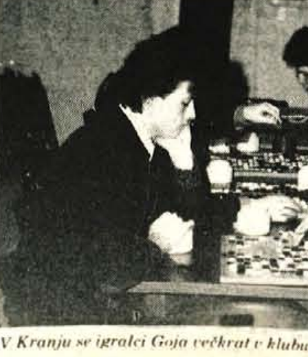
V Kranju se igralci Goja večkrat v klubu pomerijo v prijateljskih srečanjih.