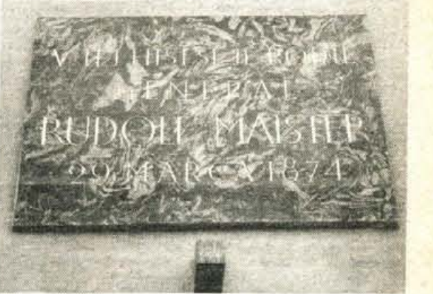
Rojstna hiša generala Rudolfa Maistra v Kamniku. Levo, nad portalom je vzdignjena pročelje spominska plošča.

Kot sem zapisal nekaj neprijetnih pripomb glede na postavitev in kiparsko upodobitev Maistrovega spomenika v Kamniku, se z zadovoljstvom vselej ozrem na zares lepo spominsko ploščo iz črnega lisastega marmorja z vklesanim lakoničnim napisom v čisti klasični pisavi. Naj slika potrdi te besede!