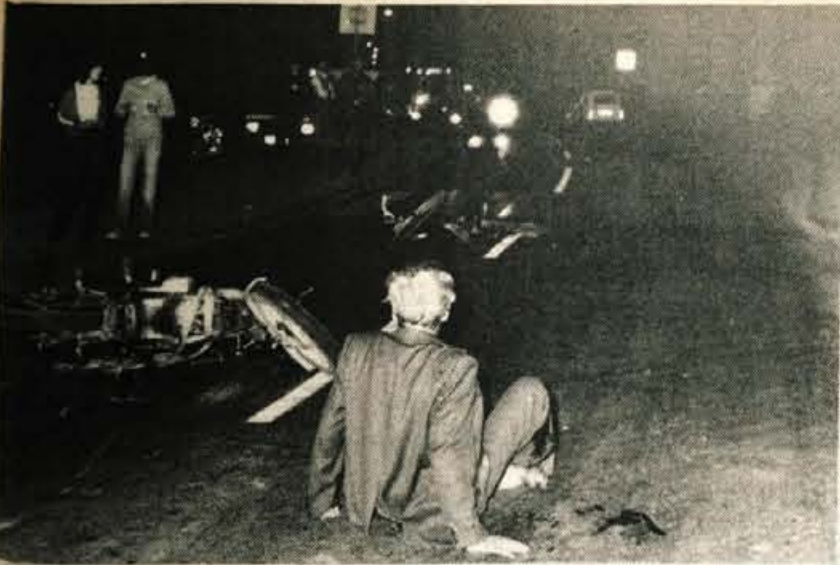
Kranj – Na Oldhamski cesti je v nedeljo motorist trčil v kolesarja, tako da je ta padel in so ga huje ranjenega prepeljali v bolnišnico.