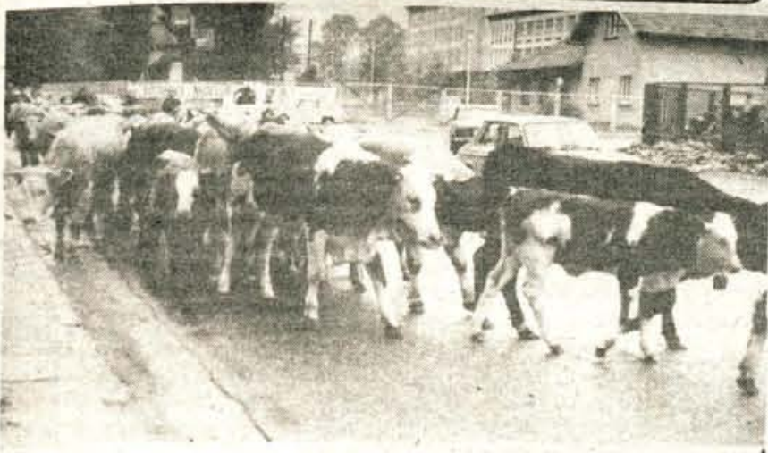
S planinske pašne: Sredi septembra se za vsako leto manjše planinske pašnike konča sezona. Krave, ki so poleti mulile planinsko travo, bodo čez zimo v toplih dolinskih hlevih. Konec prejšnjega tedna so z nekaterih planin nad Tržičem tudi že segnali krave v dolino do domačih hlevov v Kovorju in okoliških vaseh.