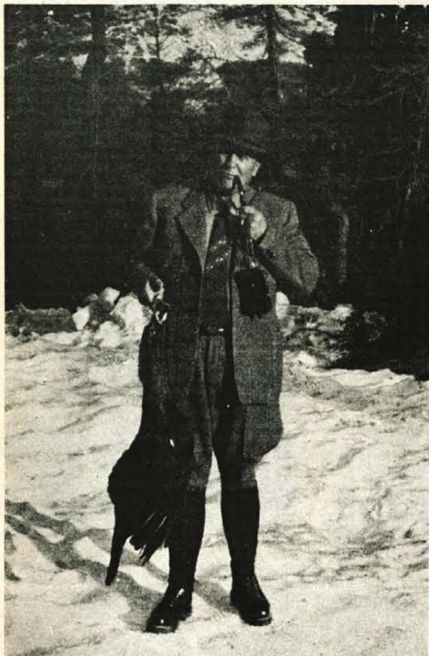
Maršal Tito z divjim petelinom, uplenjenim na Pokljuki I. 1961

so poklicali prav njega? Tudi revirni lovec, s katerim sta razglabljala o tem, ni vedel pravega odgovora. In potem — kot da se ni zgodilo nič. Ko je na upravi poročal o opravljeni nalogi in pomagal, da so na specialki natančno vrisali rastišča, so ga čisto preprosto poslali domov, v njegov revir. In pustili so ga pri miru vse do predčerašnjim.