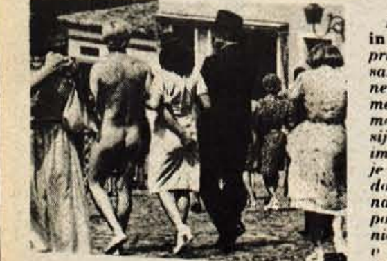
Komedija Dona Flor in njena dva moža prihaja iz Brazilije. Že sama zgodba je precej nenavadna...