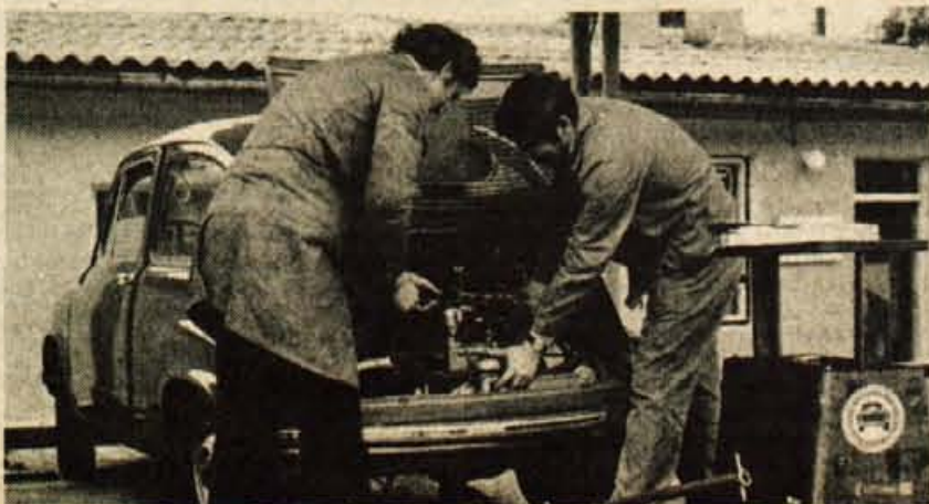
VGRADNJA IR MOTORJA — V vseh pooblaščenih Zastavinih servisih opravijo zamenjavo v enem dnevu

Naša razmišljanja o IR motorjih naj zaključimo z ugotovitvijo, da si bomo z nakupom teh motorjev prihranili predvsem denar in čas ter da se bomo lahko z našim železnim konjičkom še dolgo vozili.