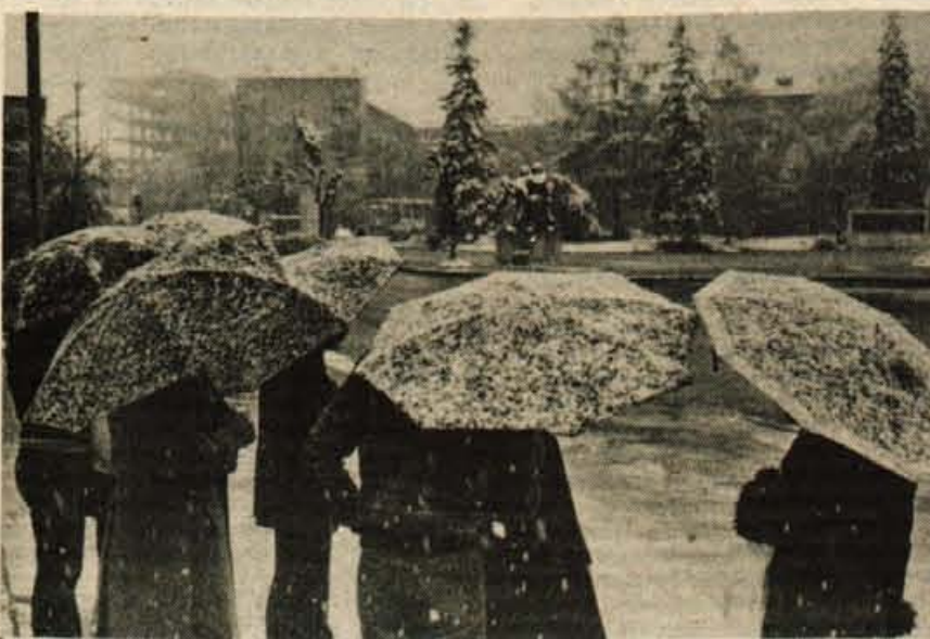
Za soncem sneg - Nedeljski sneg je po toliko dneh lepega sončnega vremena pošteno presenetil: treba je bilo spet obuti že pospravljene škornje in v marsikateri peči je ogenj zaradi hladu bolj veselo zagorel. Sadjarji so s skrbjo pregledovali sadovnjake in otresali s ponekod že razcvetelega drevja moker sneg.

Na avtobusih, ki bodo peljali študente v koncentracijska taborišča Dachau in Mauthausen, je še nekaj prostih mest. Odhod za Dachau bo 26. aprila, za Mauthausen pa 9. maja, oba izleta sta brezplačna. Cena izleta je 2.590 dinarjev, za Mauthausen in 3.350 dinarjev. Prijavite se lahko pri agencijah Alpetoura.