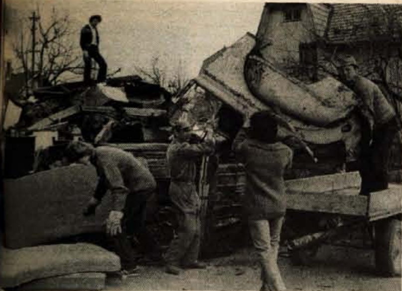
Očiščevanje okolja - Konec prejšnjega tedna skoraj ni bilo odpadkov ali večjega kraja, kjer se ne bi zagnali v čiščenje odpadkov, s katerimi smo si onečedili okolico. Mladi in stari so lotili tudi manjših odlagališč odpadkov. Opravili so celo odslužene stare avtomobile, ki so jih lastniki pozabili kje na najbolj neprimernem kraju, čistili so odloke in bližnjo okolico hiš. V Kranju pa se je mladina in odrasli v sodelovanju z ribiči in Turističnim društvom lotili čiščenja bregov Save, Kokre in Rupovščice; okoli 200 sodelujočih je očistilo navlako na obrežjih teh voda v bližini mesta, če pa bi hoteli očistiti prav vse, pa bi bilo treba seveda izvesti akcije še ponavljati. Na sliki: očiščevalna akcija v Kranju in čiščenje bregov Save v Kranju.