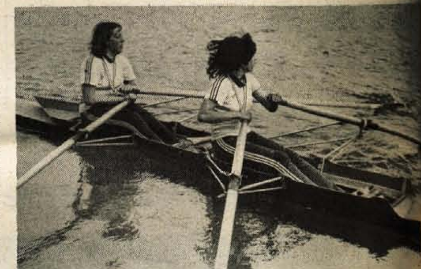
Med mladinkami sta v dvojnem dvojcu slavili veslačice VK Arupinum iz Rovinja.