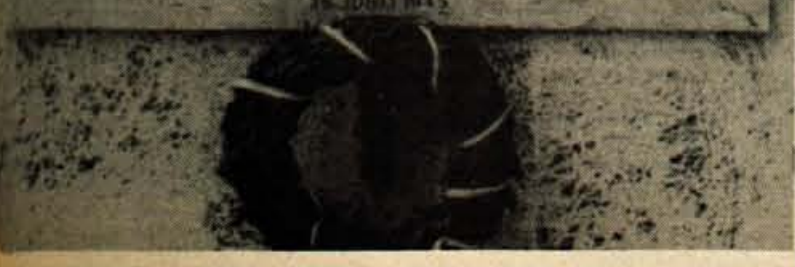
...inska plošča dijakom, ki so padli v NOB.

ZVEŠTO SE SPOMINJAMO DVAINŠTIRIDESETH TОВАРИШЕВ BIVŠIH DIJAKOV TEKSTILNE ŠOLE V KRANJU ISO DALI SVOJA ŽIVLJENJA ZA NAŠO SVOBODO Z LASTNO KRVJO SO ZATKALI TRDNO OSNOVO ZA SREČO DOMOVINE NAJ IM VETER IN PTICE POJO NAD GROBOVI PESEM GLOBOKE IN VDA NE ZAHVALE!