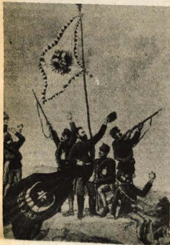
Zastave so bile sila pomembne. Avstrijski vojaki snemajo turško zastavo na gradu v Jajcu in obešajo cesarsko zastavo s črnim dvoglavim orlom.

Naravno bogata Bosna in Hercegovina je bila pred sto leti drobiž v kupčijah velesil