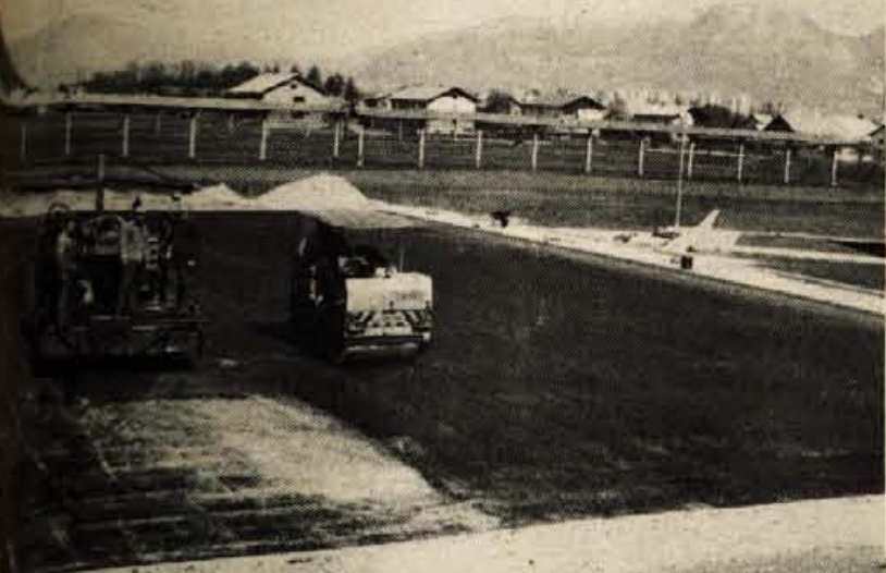
Krajani Orehka in Drulovke pri Kranju , ki so jeseni pričeli z udarnim delom na novem rokometnem igrišču za orehovsko osnovno šolo, so se dni končali z največjimi deli. Pretekli četrtek je igrišče dobilo še zadnjo prevleko in tako ga šolarji in krajani, ki so že težko pričakovali svoje rokometno igrišče, že lahko uporabljajo. Zdaj bo treba le posejati travo na obeh tribunah, postaviti mrežo, da ne bo žoga odletela predaleč na polje in seveda igrišče tudi označiti. Poleg rokometnega igrišča bodo uredili tudi atletsko stezo in dokončali jamo za odloke v daljino. Če bo denar, bodo kupili še sanitarni kontejner... Pravi zaradi udarniškega dela jim je uspelo narediti toliko, saj je bilo pripravljenega denarja le za golo rokometno igrišče. Velika pridobitev je igrišče za kraj, saj sta bili obe naselji praktično brez vsakega igrišča. Ko bodo tu dela končana, se bodo lotili ureditve nogometnega igrišča, ki ga načrtujejo nekje spodaj ob strugi Save.