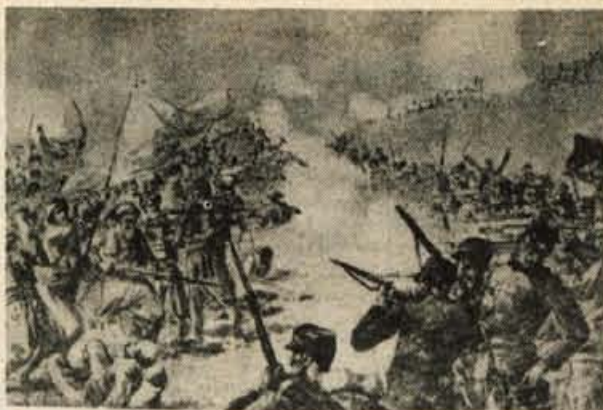
Boj pri Banjaluki. V tistih časih so si še stale nasproti dolge vrste vojakov brez vsakega posebnega kritja.

»Saj,« je menil Joža, »mali narodi so samo drobiž v kupčijah velikih. Nič ne pomaga, močnejši ima oblast.«