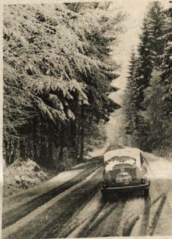
Bela ovira na cestah - Čeprav so zaradi nedeljskega sneženja morali na nekaterih cestah plugi zorati nekaj centimetrov debelo odejo, pa nasploh promet ni bil zelo oviran, če odštejemo seveda nekaj snežne plundre. Mejne prehode so pluzili že ponoči in v zgodnjih jutranjih urah.

Takšna ugodnejša varnost na gorenjskih cestah ima prav gotovo več vzrokov, med katerimi pa imajo vremenski pogoji prav gotovo večjo težo: suhe ceste, dobra vidljivost v teh mesecih so prav gotovo dokaj idealni vremenski pogoji na cestah, katerih več odsekov je bilo lani obnovenih, kar, ob sedanji gostoti prometa veliko prispeva k večji var-