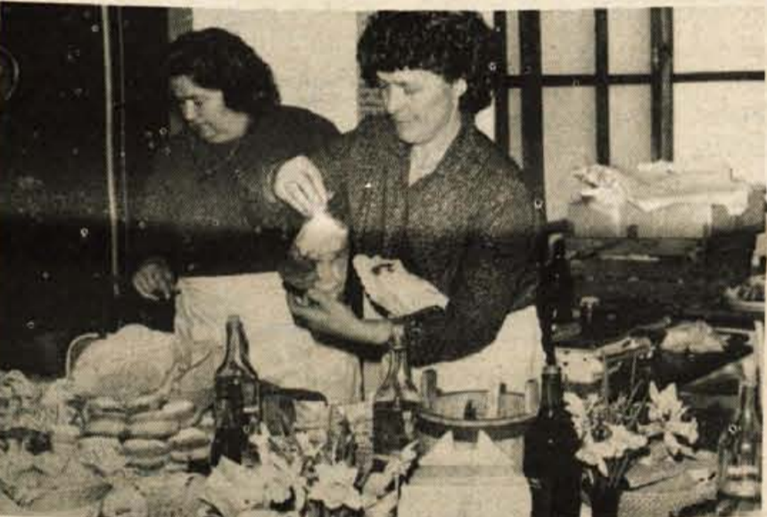
Tole pa še za domov. – Foto: D. D.

Pa še to: V Škofji Loki že zbirajo recepte in žene so nam obljubile, da bo tudi Glas dobil en izvod teh domačih, preskušanih receptov, tako da jih bomo lahko objavljali na naši ženski strani. Upamo, da bomo kmalu lahko postregli z njimi vsem gorenjskim gospodinjam. D. Dolenc