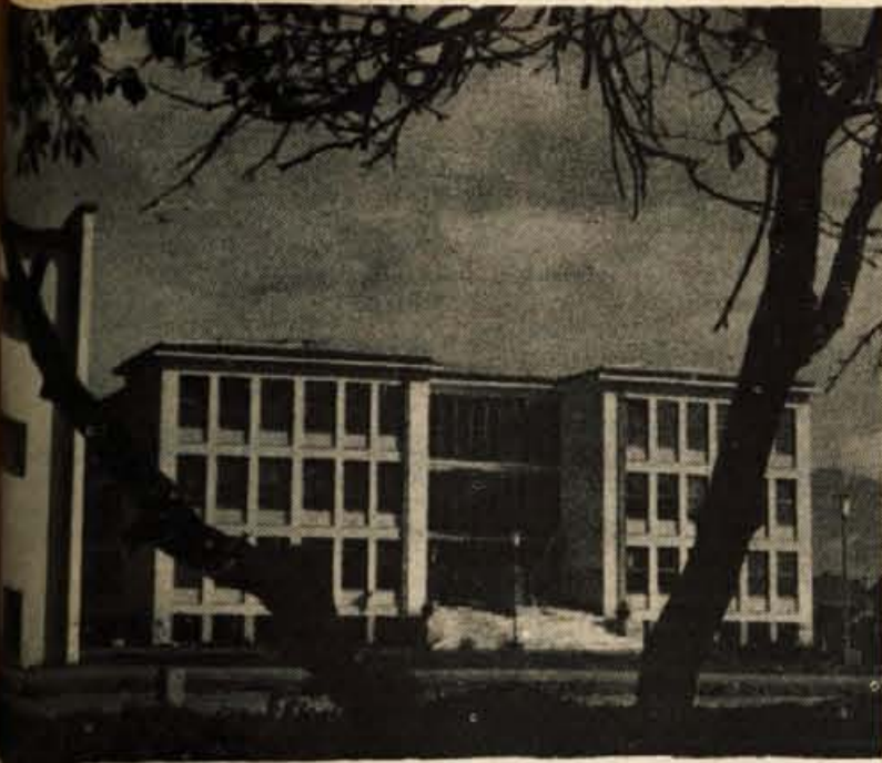
...poslojje na Primskovem, zgrajeno po osvoboditvi.