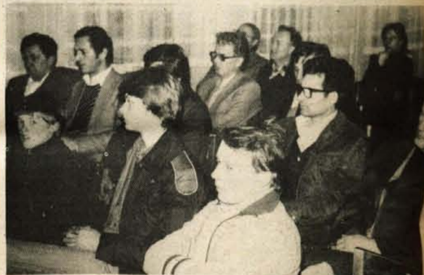
Jesenice – Člani radiokluba Železar na Jesenicah, ki so se pred nedavnimi sestali na letni skupščini, so zelo delavni. Od ustanovitve kluba lansko pomlad dalje so se opremili z radijsko postajo, usposobili so več članov za delo z njo, udeležili so se raznih tekmovanj in sodelovali v akciji Nič nas ne sme presenetiti. Tudi letos bodo nadaljevali z usposabljanjem članstva v raznih tečajih, s šolami bodo sodelovali pri organizaciji dela radiokrožkov z okviru tehnične vzgoje, sodelovali pa bodo tudi na raznih tekmovanjih radiomaterjev. Prizadevali si bodo tudi za ustrezno ureditev prostorov kluba v kulturnem domu na Javorniku in za vključevanje predsem mladih članov. Na sliki: del udeležencev letne skupščine kluba. – B. B.