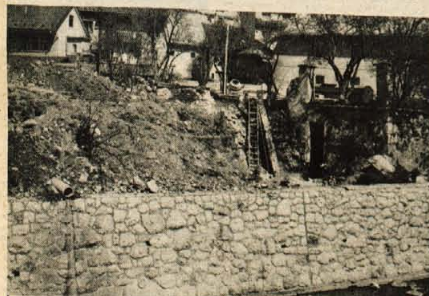
Javno stranišče — Pod parkiriščem za stavbo skupščine občine Tržič urejajo delavci domačega komunalnega podjetja prvo javno stranišče. Odprli ga bodo najverjetneje sredi poletja.