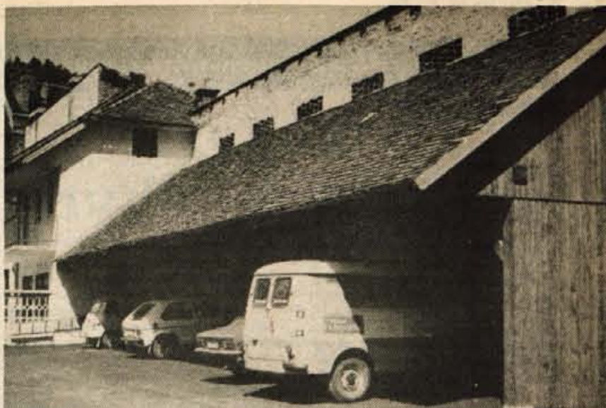
Nova tržnica v Trzinu – Prodajalci sadja in zelenjave, ki jih običajno najdemo na stojnicah, se bodo predvidoma s prvim majem izpod arkad pri občinski stavbi preselili ob rob novega parkirišča. Leseno nastrežje je že postavljeno in iznajdljivi vozniki so ga brž izkoristili. (H. J.)

Prav zato je tudi pomembno, da bi papirna industrija dobila v predelavo 200 ton starega papirja, kolikor tehtajo lanske telefonske imenike. Dve tretjini od 130.000 telefonskih imenikov so lani kupile delovne organizacije, upravni organi in razne skupnosti, ostali del pa občani. Izkupek od akcije vračanja starih imenikov gre izključno v humanitarne namene, to je na žiro račun Rdečega križa, tako kot že doslej v podobnih akcijah zbiranja papirja. Ne glede na uspeh letošnje akcije vračanja starih telefonskih imenikov, katerih teža dosega poldrugi kilogram, pa že prihodnje leto PTT predvideva spremembo. Smo, namreč ena redkih dežel, kjer PTT naročnikom imenike še prodaja; drugo leto naj bi imenike dobili vsi telefonski naročniki, cena pa bi bila vračunana v naročnino. Ob prejemu novega telefonskega imenika bi tudi oddali starega in s tem pomembno povečali količino papirja potrebnega za predelavo v industriji.