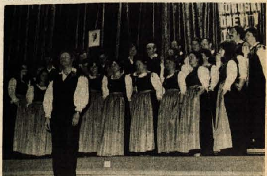
Koroško pesem je predstavil mešani pevski zbor Jakob Petelin Gallus iz Celovca. Ubrano so zazvenele Kernjakove pesmi, tudi nam tako domače.

V petek in soboto so se v Kranju mudili tudi predstavniki občinskih konferenc ZSM iz pobratenih mest. Dogovorili so se o poteku tradicionalnega srečanja oktobra v Kranju, o pripravah na bratsko delovno brigado, podpisali so še dogovor o medobčinskem sodelovanju mladih iz pobratenih mest.