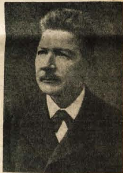
Naravoslovec Ferdo Seidl, 1856 do 1942

Zasluznega moža je dohitela smrt v času okupacije, 1. decembra 1942 v Novem mestu, ko je zakoračil že v 87. leto.