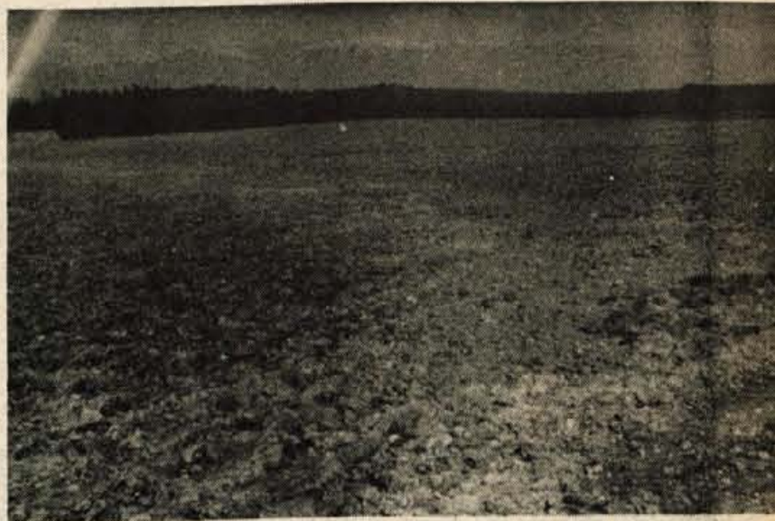
PREORANA POT – Delavci domžalske Agroemone, tozđ Govedoreja, so v Hrašah pri Smledniku preorali občinski poti št. 702 in 705 ter s tem onemogočili dostop lastnikom parcel in krajanom do stanovanjske hiše. Krajanji so na zboru postavili zahtevo, da poti vzpostavijo v prejšnje stanje, kar so jim predstavniki Agroemone obljubili. Sprašujejo pa se, kako je moglo priti do tega in kdo bo plačal nastalo škodo, saj bo za nasutje obeh poti potrebno kar precej materiala. –fr