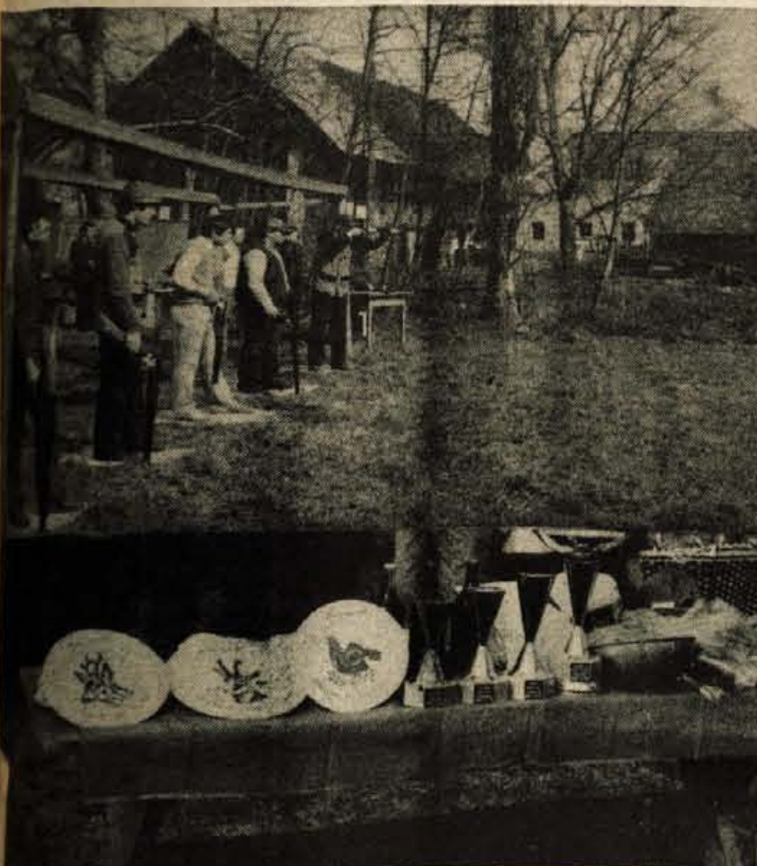
Kvor – Predzadnji dan sejma je bilo v Kovorju organizirano lovsko tekmovanje v louski kombinaciji, kjer je nastopilo 143 tekmovalcev in ekip iz vseh krajev Slovenije. Prvo mesto je zasedla LD Pugled, drugo LD Rečica, tretje LD Boštanj, četrto LD Udin Boršt, peto mesto si pa delita SD Cerklje in Jošt.