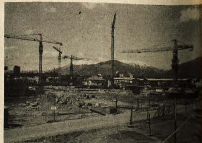
Gradnja stanovanj na Planini: Na Planini v Kranju je gradnja nove soseske v polnem zamahu. Nova stanovanja gradita Gradis in Gradbinec. Dela potekajo po planu. Gradis bo do konca leta zgradil 85 stanovanj in do konca januarja 1981 še 64 stanovanj. Gradbinec bo do decembra letos dokončal 154 in do konca marca 1981 še 64 stanovanj. Poleg stanovanj, ki bodo dokončana letos oziroma v prvih mesecih prihodnjega leta, gradi Gradbinec še dva stanovanjska bloka, ki bosta predvidoma dograjena do jeseni 1981.

Ob tem velja poudariti, da je bil do konca 1979. leta srednjeročni plan gradnje stanovanj v kranjski občini uresničen z dobrimi 78 odstotki, kar daje upanje, da bo srednjeročni plan stanovanjske gradnje uresničen. S tem dosežkom se bo kranjska občina uvrstila v sam vrh novo zgrajenih stanovanj na prebivalca in bo tudi ena redkih občin v Jugoslaviji, ki bo srednjeročni plan stanovanjske gradnje izpolnila. (lb)