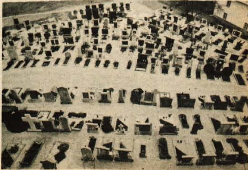
Pogled na pokopališče v Zgornjih Stranjah.

Druga sličica kaže pogled z obzidja cerkve v Zgornjih Stranjah na vaško pokopališče – kot bi zrl nanj z velike višine, skoro z letala! Skrbna urejenost in snažnost sta očitni odliki tega vrta pokojnikov.