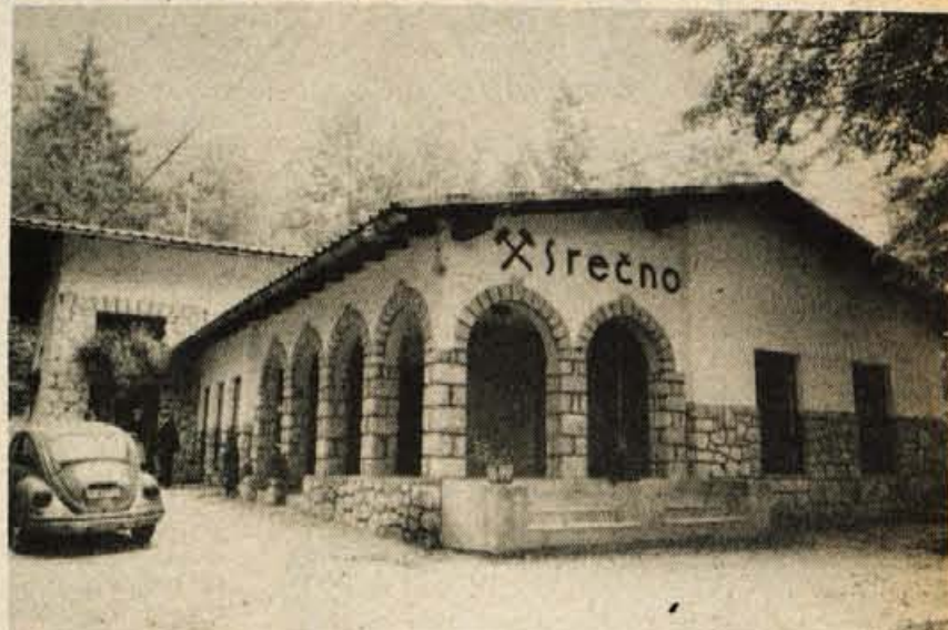
Kulturni – hkrati tudi Rudarski – dom na Vegradu nad Stahovico.