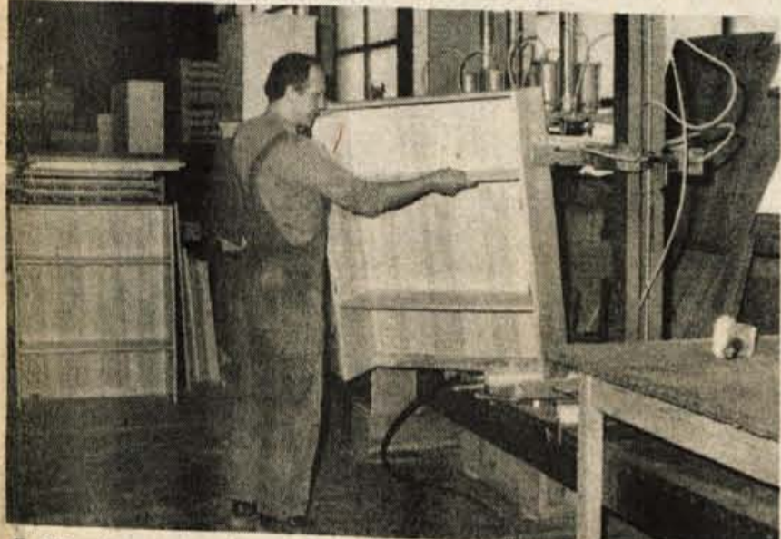
Z Zlitovim masivnim pohištvom si opremljajo stanovanja največ tujci

Letos računajo, da bodo izvoz povečali za tretjino. Dosegel naj bi vrednost 340 milijonov dinarjev. Tako visok skok bodo lahko uresničili z večjo zmogljivostjo proizvodnje, ki jo bo omogočilo skrbenje programov — izvažali bodo le še dva tipa omar — in s tem višjo produktivnost.