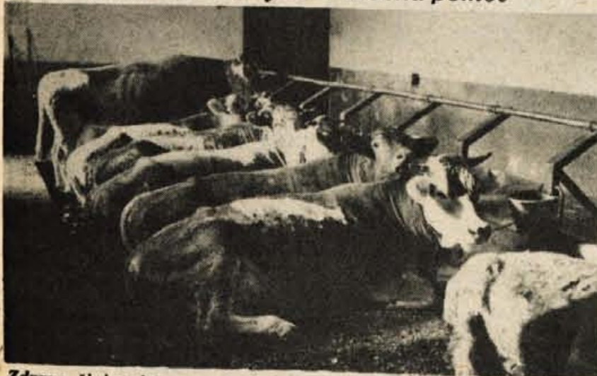
Zdravo živino in varnost živinorejca bo zagotovilo le zavarovanje vse živine v hlevu.

Naravne nesreče zadnjih let spodbudile večje zavarovanje posevkov — Na Gorenjskem zavarovane le 30 odstotkov živine, pa še ta je »podzavarovana« — Nujna družbena pomoč