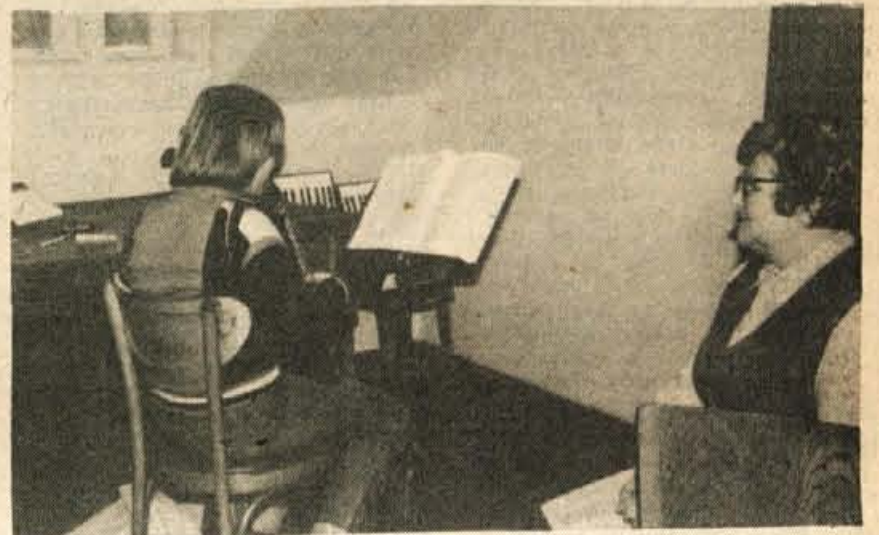
Pri pouku harmonike