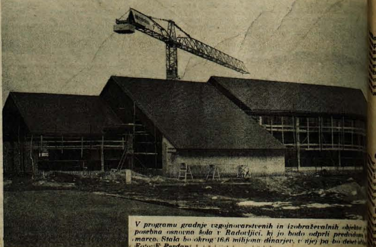
V programu gradnje vzgojno-varstvenih in izobraževalnih objektov posebna osnovna šola v Radovljici, ki jo bodo odprli predvidoma marca. Stala bo okrog 16,6 milijona dinarjev, v njej pa bo deset učilnic.

Ker so bili aneksi in samoupravni sporazumi v zruženem delu sprejeti z več kot dvema tretjinama glasov, odlok o določitvi prispevnih stopenj velja samo za tiste za vezance, ki jih niso sprejeli. Prispevne stopnje za financiranje programov izobraževalne skupnosti Slovenije, skupnosti pokojninskega in invalidskega zavarovanja Slovenije, skupnosti starostnega zavarovanja kmetov in raziskovalne skupnosti Slovenije pa bo za nepodpisnike določila republiška skupščina.