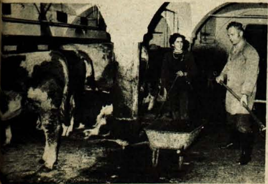
Na škofjeloškem področju najbolje uspeva svetloisasta pasma