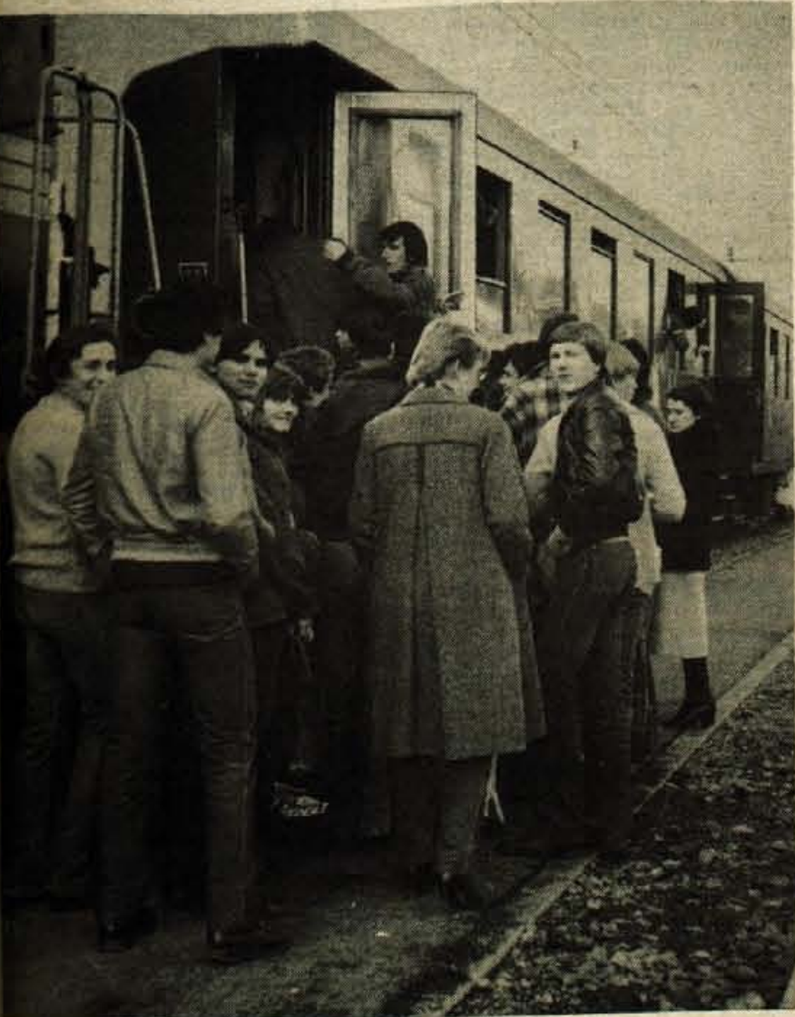
GORENJCJI OBISKALI RAZSTAVO O EDVARDU KARDELJU – Gorenjci smo se množično udeležili razstave o življenju in delu Edvarda Kardelja, ki so jo pripravili v Ljubljani v spomin na 70. obletnico njegovega rojstva. V petek so odšli v Ljubljano z vlakom in autobusom Kranjčani in Trzinčani. Vključno s solsko mladino jih je bilo nad 3000. Včeraj in danes pa so organizirali obisk razstave Jeseničani, Skofjeločani in Radovljani. Na fotografiji: odhod vlaka z udeleženci iz Kranja (jk)