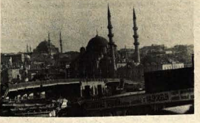
ISTANBUL s prek šeststo zašiljenimi minareti. V sredini pontonski most GALATA , ki povezuje oba bregova ZLATEGA ROGA . Nemirno se ziblje, avtomobili in pešci mirno polzijo mimo. Zjutraj ga razlomijo in dvignejo, da lahko tovarne ladje zaplujejo v notranjost ZLATEGA ROGA .