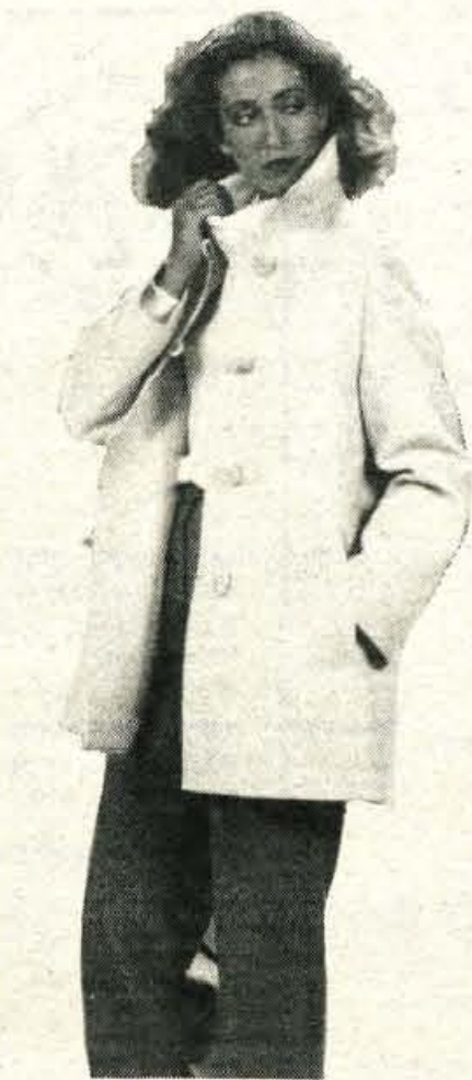
Imate radi hlače? Potem je jarna vaš večni spremljevalec in prav letošnja zima in pomlad jih imata radi. Zvončaste, mehko spuščene so, iz kvalitetnega volnenega blaga. In zakaj ne enkrat v beli barvi. Lepa je, modna in mladostna.