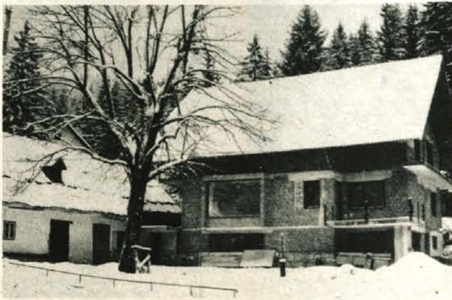
Gradnja doma je velika želja Jezerskanov. Dolgo že čakajo na zazidalni načrt. Upajo, da ga bodo letos dobili

Sami smo pripravljani veliko prispevati k razreševanju družbenopolitična skupnost pa naj obravnava naše probleme resneje, saj dolgoletno opozarjanje nanje ni brezvoljno tarnanje odhajanje ljudi v dolino za zaslužkom in boljšim življenjem je doseglo že kritično mejo. Jezersko pa je prav tako dalo svojosti veliko svojega naravnega bogastva in obilo pridnih zato naj se vsaj del tega hitreje vrača v kraj ob meji, je sedaj izročilo Jezerskanov