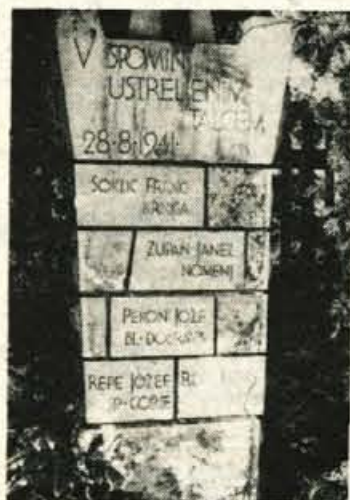
Pomnik ustreljenim talcem nad Spodnjimi Gorjami

Te datume sem navedel zato, ker je prav, da vemo, kdaj in kje so padle prve nedolžne žrtve (kar talci, ki se ne morejo braniti, gotovo so) barbarskega okupatorja.