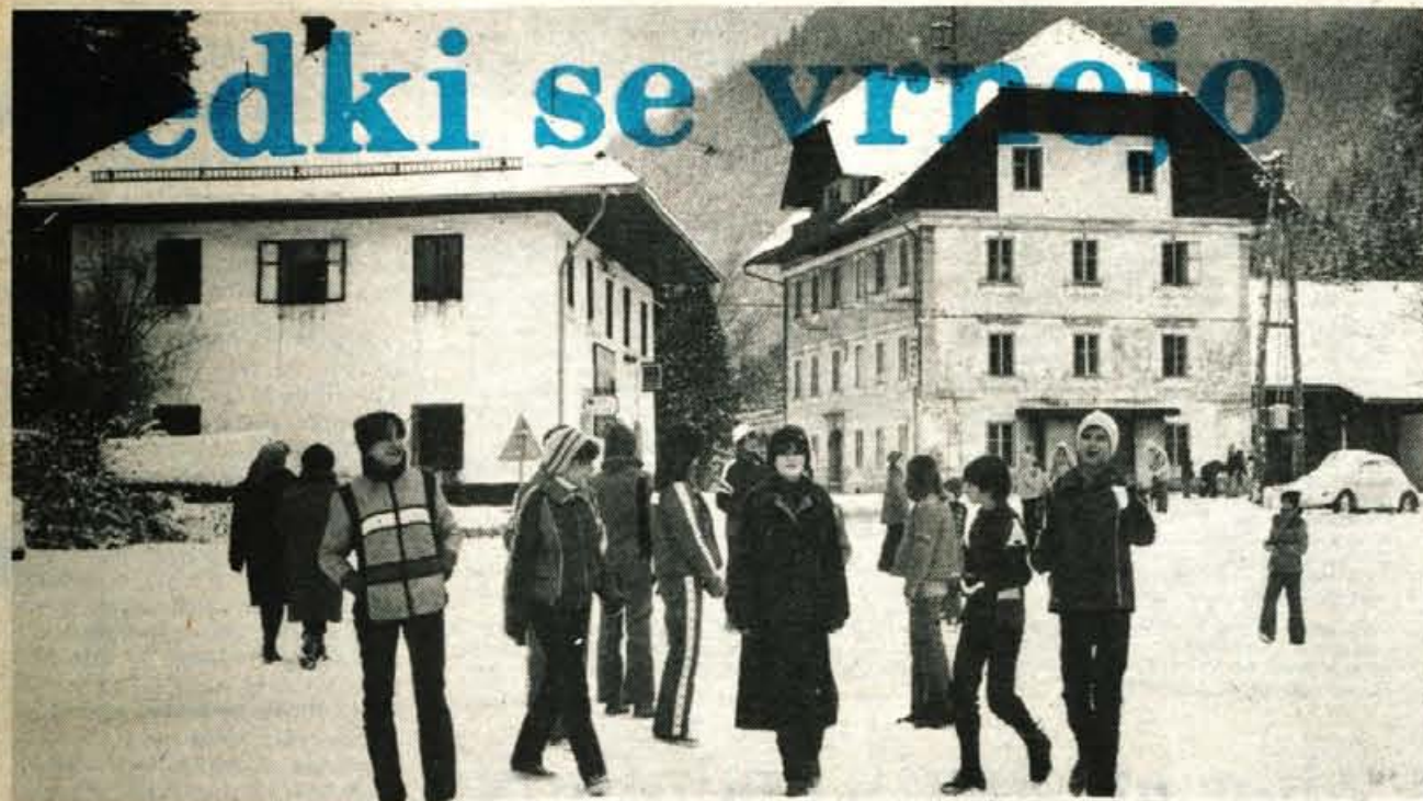
Središče Jezerskega s hotelom Kazina, najstarejšim gostinskim in turističnim objektom v kraju