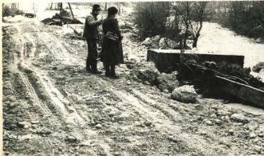
Poškodovano obrežje in cesta od Slapa proti Dolini

Po gorenjskih občinah so se hitro in učinkovito organizirali ter ukrepali ob zadnjih poplavah in zemeljskih plazovih — Izjemna vloga civilne zaščite, gasilcev, delovnih organizacij, milice in solidarnosti ljudi — Škoda sicer še ni ocenjena, vendar bo zanesljivo velika — Ceste, še posebno na Jezerskem in v škofjeloški občini, in leseni mostovi najhujše poškodovani