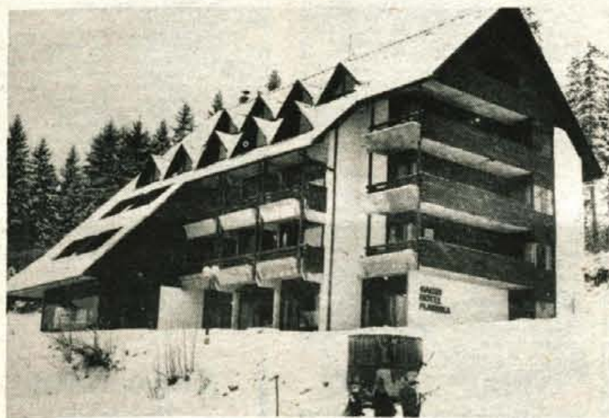
Nov hotel Planinka, najnovejša pridobitev Jezerskega

Zelja je pokriti bazen. Pomemben vzpodbujevalec turizma bi bil, obenem pa dopolnitev turistične infrastrukture. Čeprav jezerski turisti večinoma niso ljubitelji hrupa, pa vseeno pogrešajo aktivnosti, ki bi jim krajšale čas. Jezersko ima izredno naravo, možnosti za zimsko in letno rekreacijo, Češko kočico in Ledine, vendar vedno bolj spoznava, da je to še premalo.