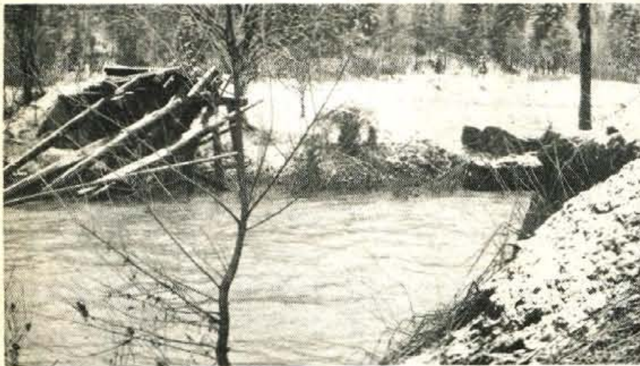
Podrt most v Zmencu nasproti hiše številka 10