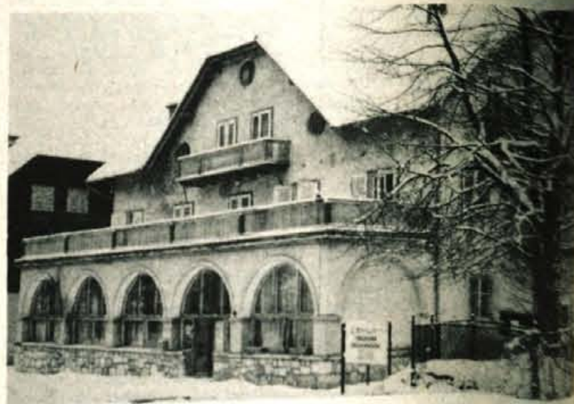
Korotan razpada, vendar kljub temu še služi predvsem jezerskim turistom. Gradnja novega doma terja združevanje sredstev uporabnikov

Ponosni so Jezerski na vse, kar so dali razvoju družbe. V dolino so romali dragoceni kubiki lesa, ki se danes dosežejo 20.000. V dolino so odhajali in odhajajo ljudje, pridni in dela vajeni. Del te vrednosti se mora vrniti v kraj, bodisi kot naložbe v turistične objekte, v komunalno opremljanje, v gradnjo stanovanj, v kmetijstvo in gozdarstvo in mogoče