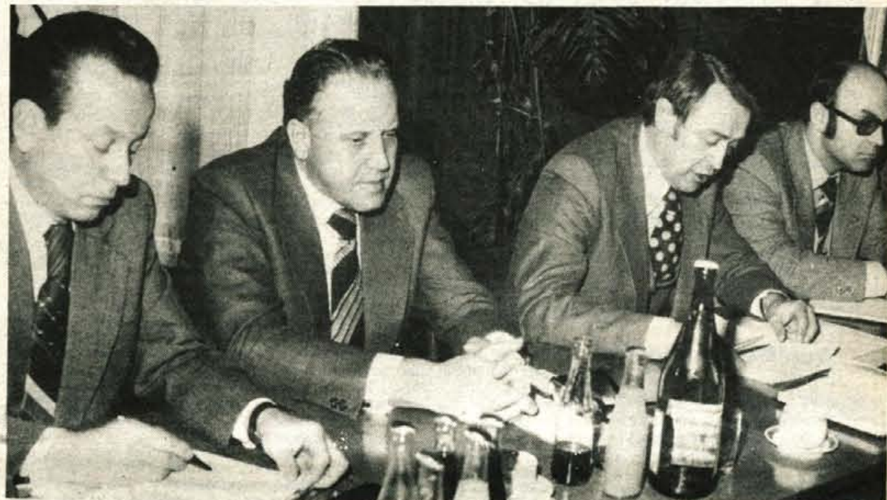
Kranj — Na včerajšnji dopoldanski razširjeni seji komiteja občinske konference ZKS so obravnavali ugotovitve delovne skupine CK ZKS z obiska v kranjski občini. Na seji je bil tudi predsednik CK ZKS France Popit.

Z mobilizacijo komunistov bi sedanje slabosti in probleme lahko uspešneje odpravljali