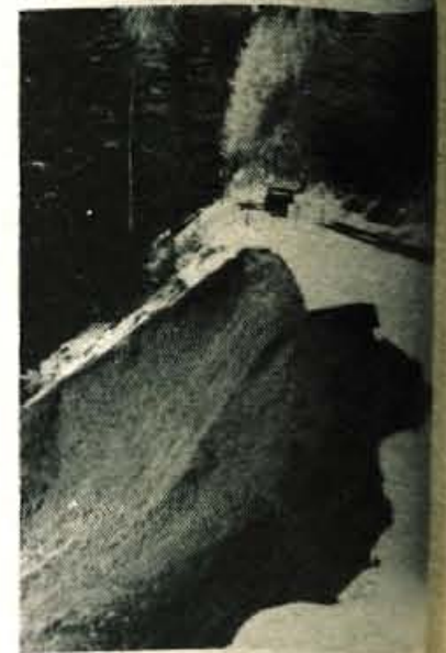
Nad 30.000 kubičnih metrov je zdrsnilo ob cesti na Jezersko. Na vrh je mogoče le z osebnim avtomobilom

Smučarsko prvenstvo ljubljanskega armadnega območja, katerega pokrovitelj je mariborska občinska skupščina, vsekakor ne bo le velika športna prireditel, ampak tudi dobra preizkušnja kondicije vojakov in starešin. Tisti tekmovalci, ki se bodo najbolj izkazali med tekmovanji na Arehu, pa bodo od 23. do 28. februarja zastopali ljubljansko armadno območje na 3. smučarskem prvenstvu JLA na Popovi Šapki v Makedoniji.