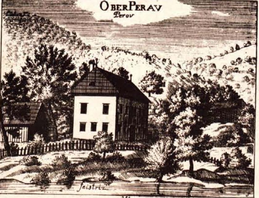
Gornje Perovo (po Valvazorju)