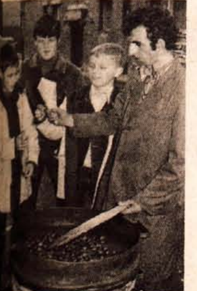
je tu res prava jesen, so potrdili gostanjarji ki so te dni pripravili svoje pečice in na njih veselo... Veliko je letos tega gozd... Pri kranjskem kinu... Mala me... velika pa 12 din.