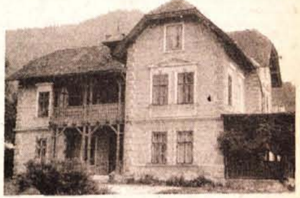
Spodnje Perovo — danes