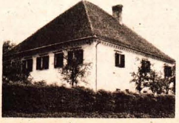
Gornje Perovo — danes