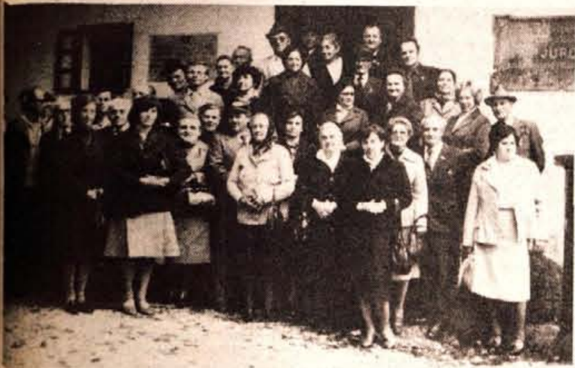
Skupnice pred Jurčičevo rojstno hišo so prišle ravno prav za skupinski posnetek.