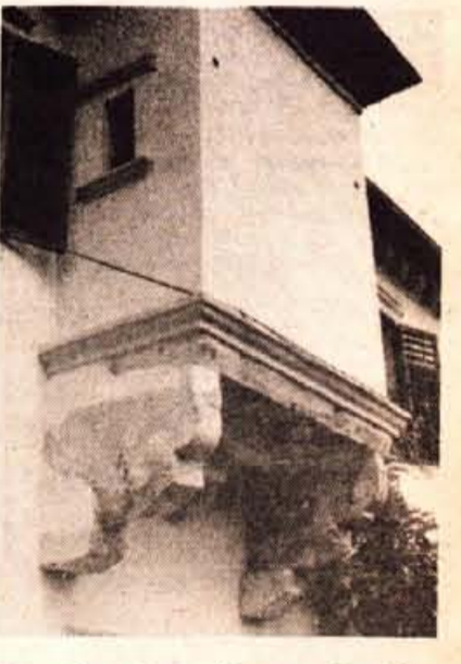
Konzoli pri gradiču na Gornjem Perovem