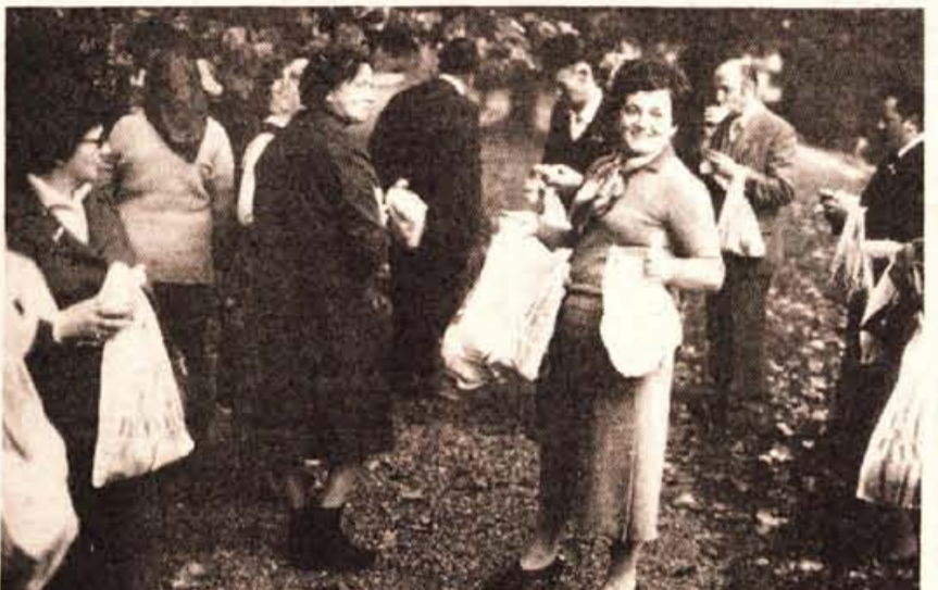
»Kdo še nima malice...«

Le nekaj kilometrov stran, v Ivančni gorici, nas je čakalo ime-