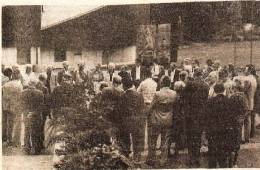
Na enodnevnem srečanju so prvoborci iz Kranja in Tržiča obiskali tudi družbeni dom Joža Ažmana v Bohinju.

V rubriki Dogovorimo se objavljamo povzetke gradiva za zasedanje vseh treh zborov občinske skupščine Škofja Loka, ki je sklicano za sredo, 26. avgusta. Posebej opozarjamo na analizo o uresničevanju družbenega plana občine Škofja Loka v letih 1976, 1977, 1978, prognozi o uresnitvi plana za leto in izhodišča resolucije za leto 1980.