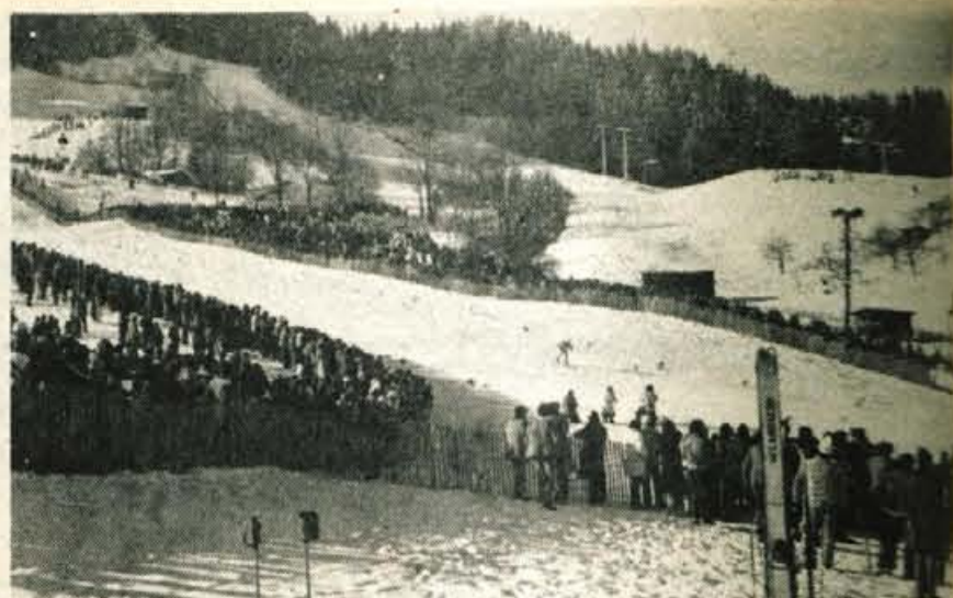
»Na norem smuku« s Petelinjega grebena je le ciljna ravnina še kolikor toliko normalna. Pa še tu smukači prinerijo v ciljno areno do 100 km na uro.

Na koncu je ostal brez uvrstitve. Ostali trije Jugoslovani so bili dobri, saj so bili na solidnih mestih.