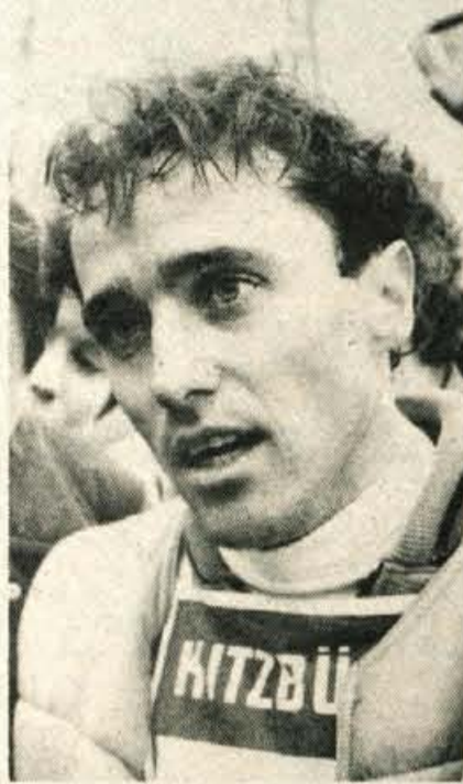
Najstarejši slalomist med najboljšimi slalomisti na svetu Christian Neureuther iz ZRN je bil nasmijan ob svoji zmagi.