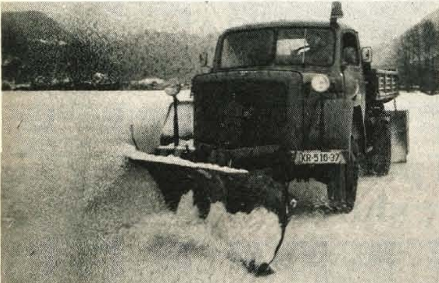
Cesta v Zapuže je bila najslabša, z debelo snežno odejo, pod njo pa ledeno cestišče.

Kaj pravijo radovljiški komunalci o letošnji zimski službi na cestah radovljiške občine — Stroški pluzenja in posipanja so precejšnji — Zakaj so nekatere ceste slabše, druge boljše vzdrževane?