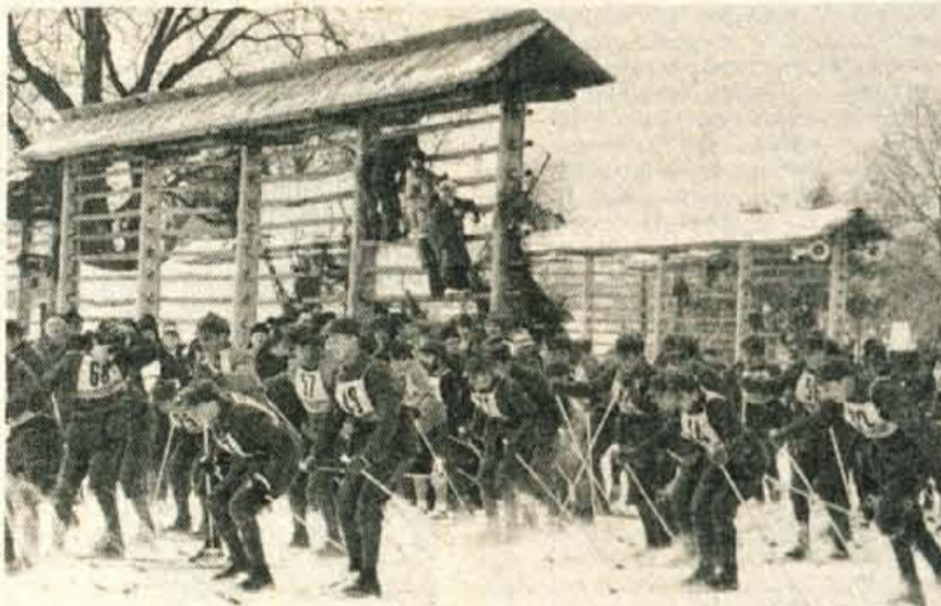
Za pripadnike naših oboroženih sil je sodelovanje na maratonskih delih vzgoje in krepitve vzdržljivosti