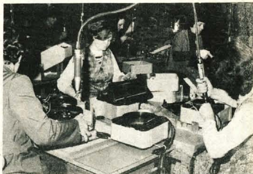
Koliko delavcev? – Načrti investicijskih vlaganj gorenjskega gospodarstva so znani: po svoji obsežnosti in strukturi pa seveda zahtevajo tudi več kadrov. Kako se možnosti pokrivanja potreb po novih delavcih skladajo z novimi investicijami je vsekakor ena prvih in najpomembnejših nalog skupnosti za zaposlovanje.

Pravilnik ureja tako pravice in obveznosti brezposelnih in invalidnih oseb kot tudi pravice in obveznosti skupnosti za zaposlovanje ter temeljnih in drugih organizacij združenega dela.