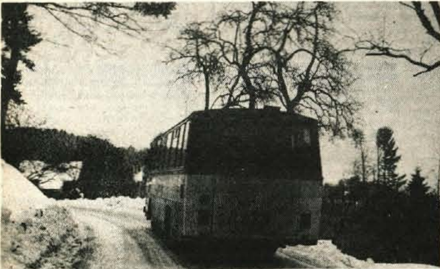
Delavski avtobusi so imeli ob hudem sneženju na cesti proti Kamni gorici in Podnartu večkrat zamude zaradi slabega vzdrževanja ceste.