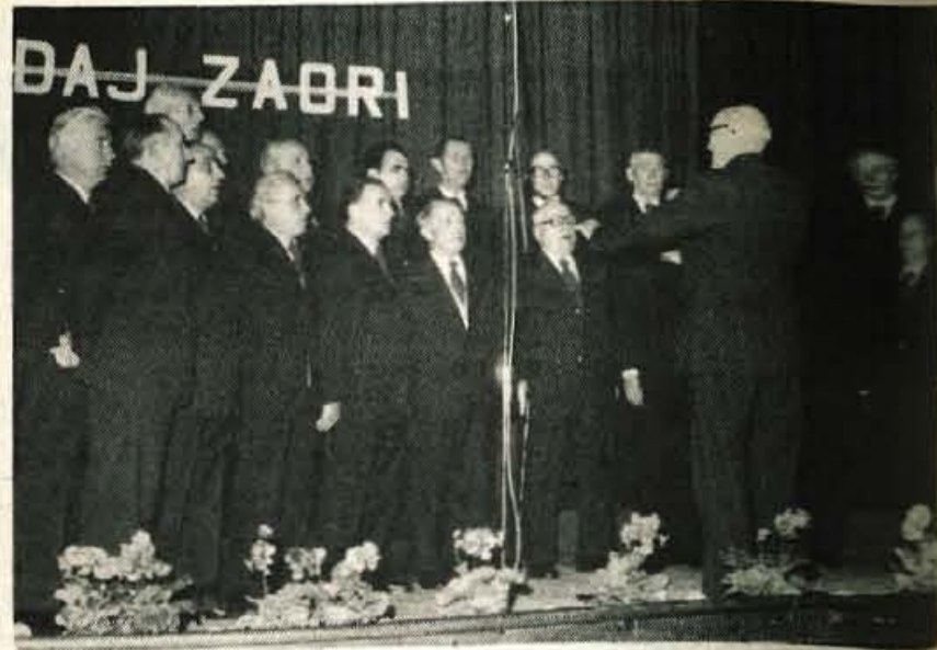
Na Kokrici smo lahko slišali tudi pevce zbora Društva upokojencev, ki so teden pred tem pripravili koncert ob 15. obletnici svojega dela. F. Perdan

Petorica žigosanih je italijanski vojni film, ki pripoveduje o petih hrabrih »nezgodnežihe«.