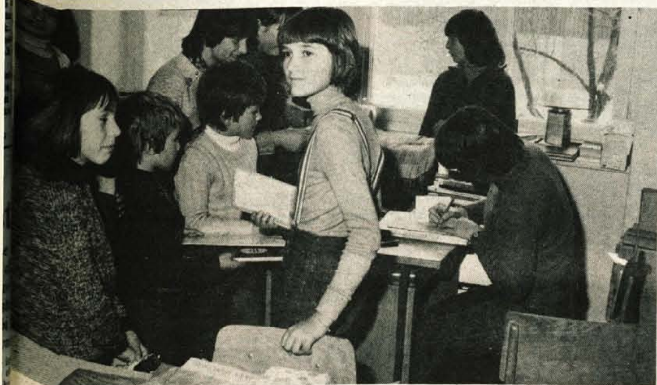
V katero šolo in poklic – Prav sedaj potekajo intenzivne priprave na letošnji zgodnejši vpis na srednje in višje šole. Obenem pa bo treba skrbno pripraviti tudi akcijo za preusmerjanje mladine, ki ne bo sprejeta na šole, ki si jih je izbrala. Namere mladih so sicer znane, vendar pa se le deloma pokrivajo s potrebami gospodarstva. V vseh občinah prav sedaj ustanavljajo koordinacijske odbore za usmerjanje vpisa mladih v ustrezne šole.

Program dela tega področja je za vse občinske skupnosti za zaposlovanje kot tudi za medobčinsko skupnost za zaposlovanje enoten. Obsega finančne analize, finančno računovodske posle in ostala finančna računovodska posla. Ob tem je treba dodati, da se je z ustanovitvijo občinskih skupnosti za zaposlovanje obseg dela bistveno povečal, saj bo potrebno namesto enega voditi sedaj šest med seboj ločenih knjigovodskih poslovanj.