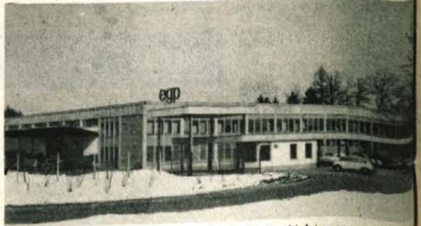
Embalažno grafično podjetje iz Škofje Loke, ki letos praznuje 20. obletnico, se s svojo embalažo vse bolj uveljavlja. O kakovosti njihovih izdelkov pričajo številni jugoslovanski oskarji za embalažo in med njimi priznanji Eurostar, ki so jih dobili za izdelavo embalaže Iskrinih izdelkov. Poseben poudarek dajejo izdelavi embalaže PAL-box palete, ki jo izdelujejo edini v Jugoslaviji in embalaži iz vodotesne lepenke. — (L. B.)

Osnovna razdelitev namer generacije osmošolcev 1978/1979 (leva stran slike) v primerjavi z vključitvami prejšnje generacije 1977/1978 (desna stran slike, šrafinirano polje). Zaradi preglednosti smo izpustili učence, ki nameravajo oziroma so že ostali doma na kmetiji. Iz slike je razvidno, da se namere in vključitve zlasti razlikujejo pri dvehletnih in štiriletnih poklicnih šolah: vključitev v te šole je za 8,6 odstotka večja od letos izraženih namer. Ostala razmerja so razvidna iz slike.