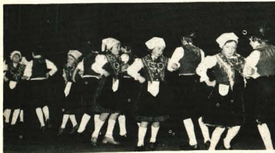
S koroškimi plesi so nastopili mladi folkloristi prosvetnega društva Zarja iz Zelezne Kaple

IZOBRAŽEVALNI CENTER pri DDU UNIVERZUM . telefon 312-133, 312-745