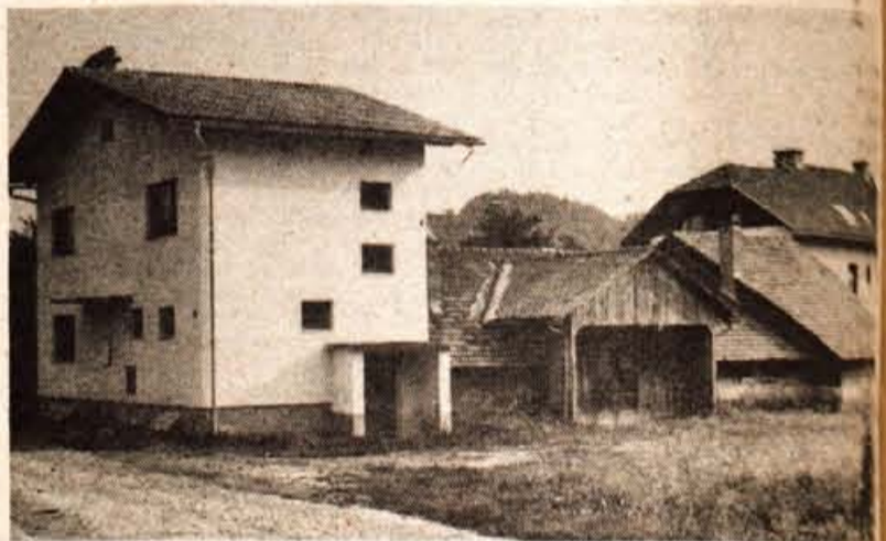
Za kulturno dejavnost v Gorjah nimajo primerne prostora, nekaj časa so folkloristi delali kar v leseni lopi. Zadnja prireditev v neprimernih prostorih je bila pred štirimi leti...

Med društvi je treba omeniti prizadevne radioamaterje. Društvo ima 32 članov, ki prihajajo večinoma s blejske in iz gorjanske osnovne šole ter se spoznavajo z radioamaterstvom. Probleme imajo s financiranjem in z nabavo materiala, ga je težko dobiti, povrh vsega pa