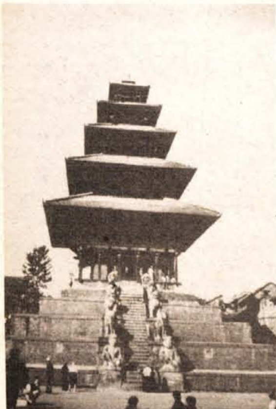
Velika pagoda v Bhadgaonu, največja v Kathmandujski kotlini.

Pozno zvečer smo prispeli v Pokhara. Pokhara pomeni jezero. Kraj je dobil ime po velikem jezeru, ki se razprostira na jugozahodnem koncu kotline. Od tu je čudovit pogled na skupino Anapurn. Pred njo, pomaknjen bolj na jug, pa se ponosno dviga Machapuchare (Ribji rep), ena najlepših gor na svetu. Daleč na zahodu pa se vidi s čadom obdani Dhaulagiri. S čolni smo se prepeljali preko jezera in se povzpeli na greben, od koder je bil pogled še lepši. Ustavili smo se pri eni od domačij. Postregli so nam s čajem - dudh ča (čaj z mlekom. Gospodinja nam je čašo oprala s pomočjo blata, ki ga je zajela blizu gnoja. Ze smo se videli z drisko na stranišču. Ko je odšla v hišo po čaj, sva z Marjonom hitro pomila kozarce z vodo. Čaj je bil odličen. Kati pajsa? (koliko stane?) smo vprašali. Samo odkimali so z glavo, češ, kaj bi to. To je bil lep dokaz, da turizem v te kraje še ni prišel. Cesa takega na poti pod Everest nisimo več doživeli.