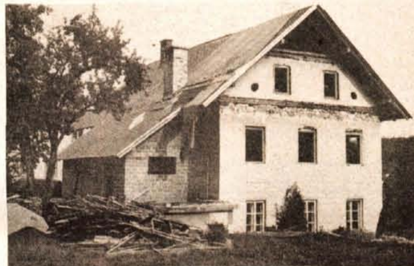
V Gorjah obnavljajo vrtec, pridobili bodo nekaj novega prostora ter uredili primernejše pogoje za otroško varstvo...

Krajevna skupnost je s samoprispevkom položila precej asfalta na makadamske ceste v krajevni skupnosti - Čaka še kanalizacija in telefonsko omrežje - Prizadevna dejavnost organizacij in društev - Pozabljena poključna luknja