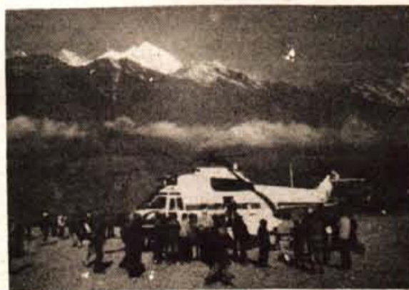
Helikopter je pristal na letališču v Lukli (2805 m) sredi radovednih domačinov.

Kot imajo v Nepalu navado, so naš polet iz nepojasnjenih razlogov odložili za en dan. Naslednjega dne smo se zgodaj zjutraj vkrcali v ogromen trup helikopterja. Našega Serpa, Tembo, je bilo kar strah. Med poletom so mu stopile na čelo potne kaplje. Helikopter je letel precej nizko nad zemljo, tako da smo lahko opazovali pokrajino. Vsa dežela, visoko v hribe, je obdelana. Številne terase so v tem času rumeno - rjave. Ko bo prišel monsun, bo pokrajina oživila. Po trideset uri letenja smo pristali v Lukli. To je majhna vasica. Prebivalci, posebej pa otroci, se ob prihodu helikopterja ali letala zberejo okrog letališča. Radovedno opazujejo jeklene ptice katerih pa so se v veliki meri že privadili. Večjo pozornost vzbujajo sahabi ali sabi (gospodje), ki priletijo. Večina od njih bo najela nosače, to pa je zanje zaslužek. Helikopter je dvignil velik oblak prahu. Podnebje je tu bolj hladno kot v Kathmanduju. Temba je hitro zbral 30 nosačev. Ti so tovore raznesli po domovih, kjer so jih pripravili za nošnjo. Ta čas je Pemba, eden od nosačev, ki so lani naši ogledni ekspediciji nosili do baze, nas štiri povabil na čaj. To je mlečna tekočina, podobna pivu, ki je kar dobrega okusa.