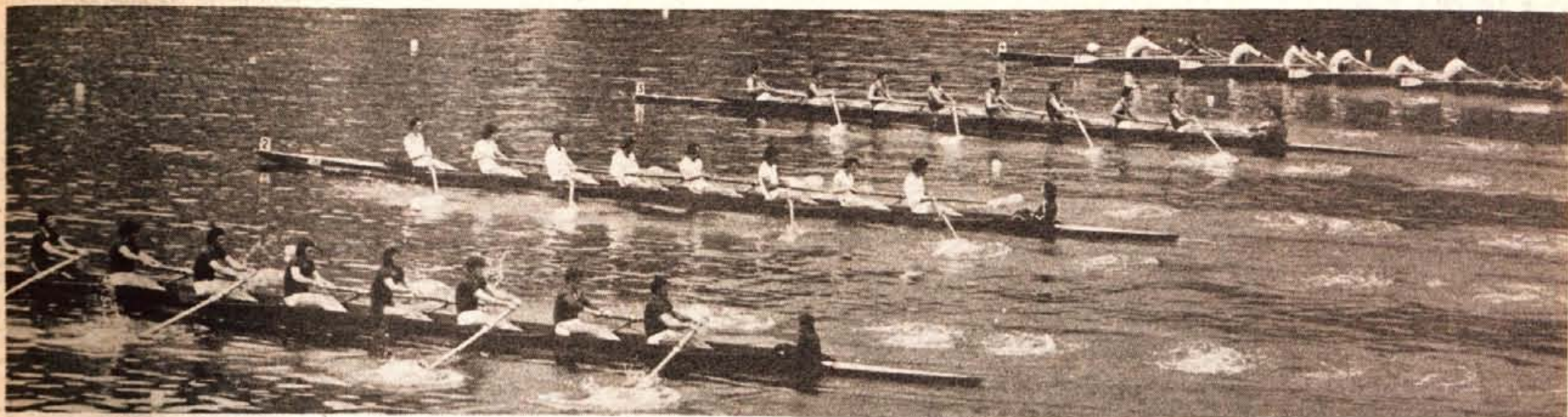
Bled bo od 28. avgusta do 9. septembra gostil nad 1600 udeležencev osmega svetovnega prvenstva v veslanju. Na gladini Blejskega jezera se bodo v teh dneh borile ženske, lahki veslači in elita. To bo po udeležbi največje svetovno prvenstvo doslej. Vsekakor je vedno na veslaških regatah »sparadna disciplina« tekma osmercev. CP GLAS je pred pričetkom svetovnega prvenstva izdal tudi posebno prilogo o veslanju. Dobili jo bodo vsi naročniki, veslači, gostje in vsi akreditirani novinarji. (-h)