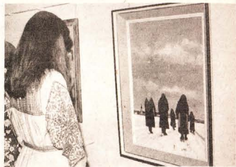
Skupinska razstava – Gorenjski muzej v Kranju in združenje likovnih skupin pri zvezi kulturnih organizacij Slovenije sta v galeriji Prešernove hiše v Kranju pripravila razstavo del članov likovnih skupin iz severovzhodne Slovenije.

Pred tem je avtor svoja dela razstavljal v sindikalnem domu v Kropi pod pokroviteljstvom delovnega kolektiva Plamen iz Kroepe. Ob tej priložnosti so izdali posebno knjižico – katalog z njegovimi najboljšimi deli.