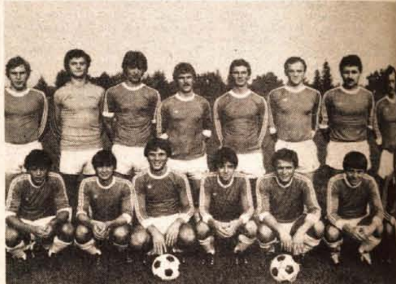
Peta selekcija Kranja pred novo tekmovalno sezono