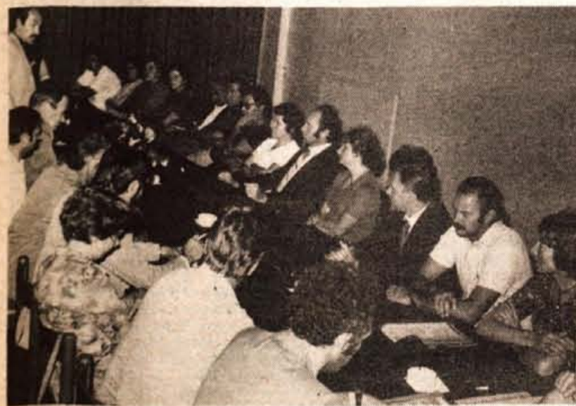
Delavci Almire iz Radovljice in Sukna iz Zapuž so svoje sodelovanje potrdili s samoupravnim sporazumom.

GLASILO SOCIALISTIČNE ZVEZE DELOVNEGA LJUDSTVA ZA GORENJSKO