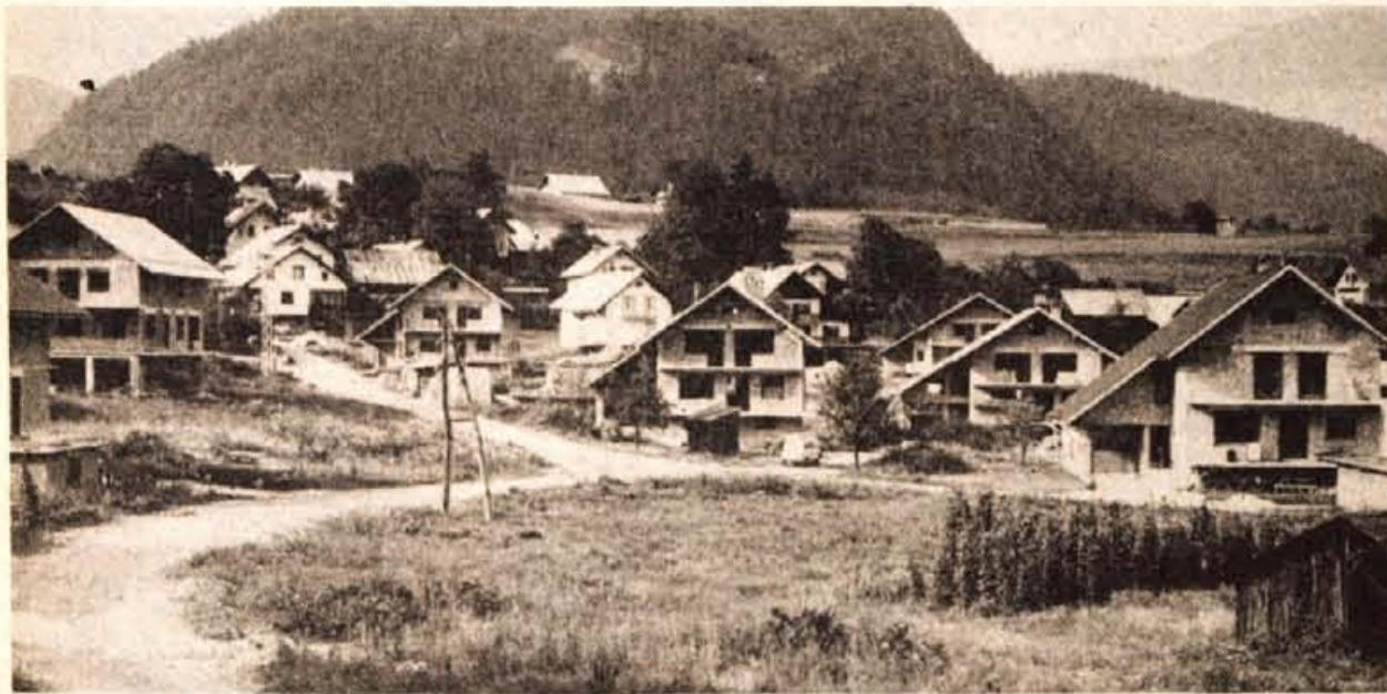
V Gorjah so začeli z intenzivno zasebno gradnjo na območjih, ki so za to določena...